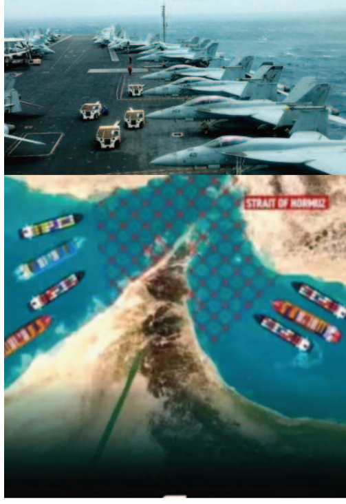
జలసంధి మార్గం దాదాపు మూతపడటంతో అంతర్జాతీయ మార్కెట్లో చమురు ధరలు రికార్డు స్థాయికి చేరుకున్నాయి.

వాషింగ్టన్/టెహ్రాన్, మార్చి 18: మధ్యప్రాచ్యంలో యుద్ధ జ్వాలలు అదుపు తప్పి ఎగిసిపడుతున్నాయి. ఇరాన్ లక్ష్యంగా అమెరికా బలగాలు బుధవారం తెల్లవారుజామున అత్యంత శక్తిమంతమైన వైమానిక దాడులకు దిగాయి. పూర్వోక్తంగా కిలకమైన హార్వాజ్ జలసంధి తీరప్రాంతంలో ఉన్న ఇరాన్ భూగర్భ క్షిపణి స్థావరాలే లక్ష్యంగా ఈ దాడులు జరిగాయి. సుమారు 2,268 కిలోల బరువుండే 'బంకర్ బస్టర్' బాంబులను ప్రయోగించి, కాంక్రీట్ కట్టడాలను ఛేదించుకుంటూ వెళ్లి లోపల ఉన్న నౌకా విధ్వంసక క్షిపణులను అమెరికా ధ్వంసం చేసింది. అంతర్జాతీయ నౌకాయానానికి ముప్పు పొంది ఉండన్న నిఘా వర్గాల సమాచారంతోనే ఈ ఆపరేషన్ చేపట్టినట్లు అమెరికా సెంట్రల్ కమాండ్ అధికారికంగా ప్రకటించింది.