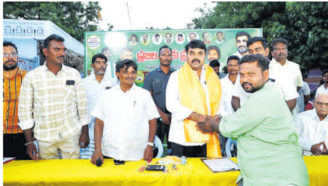
అభివృద్ధి, విద్యుత్ సమస్యలు, పంచెల మంజూరు తదితర సమస్యలపై పాల్గొన్నారు.