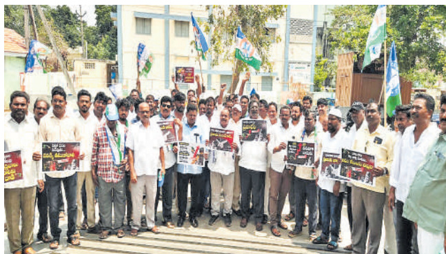
తుంగలో తొక్కారని విమర్శించారు. కూటమి పెద్దలు ఇచ్చిన హామీని నెరవేర్చకుండా పెట్రోల్, డీజిల్