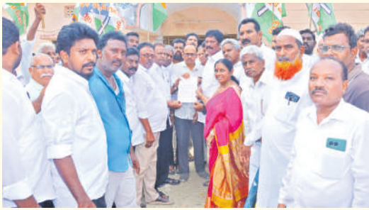
పెట్రోల్, డీజిల్ ధరలను