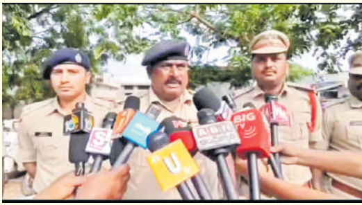
గంజాయి, అసాంఘిక కార్యకలాపాలకు పాల్పడితే