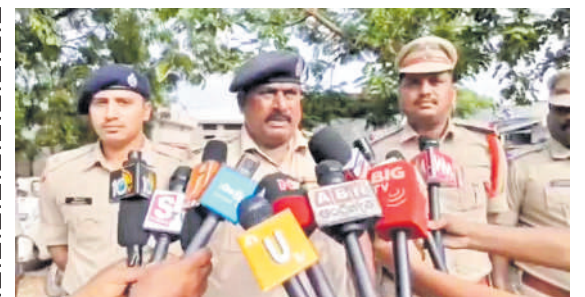
గంజాయి, అసాంఘిక కార్యకలాపాలకు పాల్పడితే