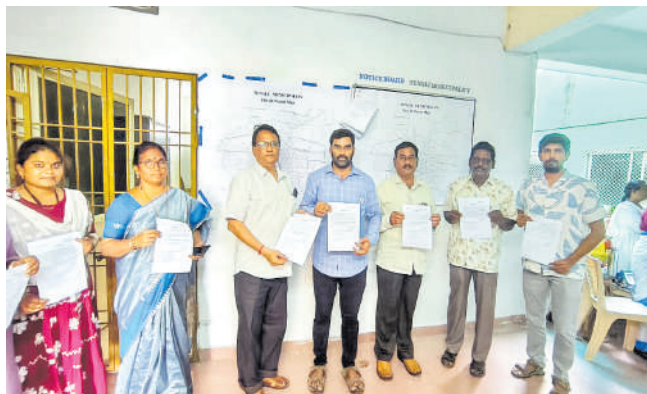
పట్టణ పరిధిలోని వివిధ ప్రభుత్వ కార్యాలయాలలో ప్రదర్శనకు ఉంచారు.

తెనాలి మే 18(మనసులో మాట) మునిసిపాలిటీలో వార్డుల పునర్విభజన ప్రక్రియలో భాగంగా ప్రస్తుతం ఉన్న 40 వార్డులను 52 వార్డులుగా పెంచినట్లు గుంటూరు పురపాలక పరిపాలన శాఖ సంచాలకుల సర్క్యులర్ మేరకు తెనాలి మునిసిపాలిటీ పరిధిలో 52 వార్డులుగా పునర్విభజన చేపట్టి, సంబంధిత వార్డుల వివరాల ముసాయిదా ఉత్తర్వులను సోమవారం మునిసిపాలిటీ కమిషనర్ జె. రామ అప్పల నాయుడు విడుదల చేశారు. ఈ ముసాయిదా ఉత్తర్వులను ప్రజల అవగాహనకు మునిసిపాలిటీ కార్యాలయ నోటీసు బోర్డులో అలాగే