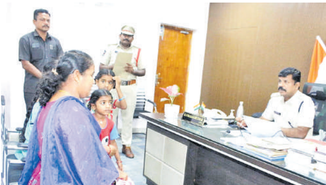
వారితో ముఖాముఖీ మాట్లాడి సమస్యలను అడిగి తెలుసుకొని, అర్జీలను క్షుణ్ణంగా పరిశీలించారు. వెంటనే