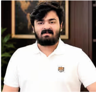
బాధితురాలితో నిజం చెప్పకుండా ఉండేలా ఒత్తిళ్లు తెచ్చారనే ఆరోపణలు వచ్చాయి.