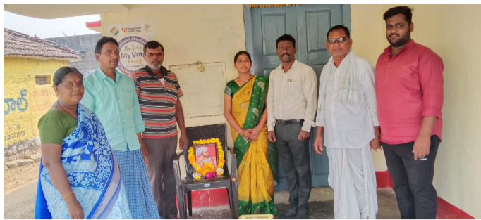
నందం లో ఘనంగా చత్రపతి శివాజీ మహారాజ్ జయంతి వేడుకల్లో సర్పంచ్ గ్రామ ప్రజలు