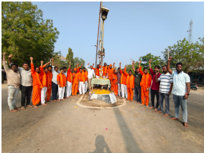
నర్సాపూర్ జి మండల కేంద్రంలో ఘనంగా చత్రపతి శివాజీ మహారాజ్ జయంతి వేడుకలు