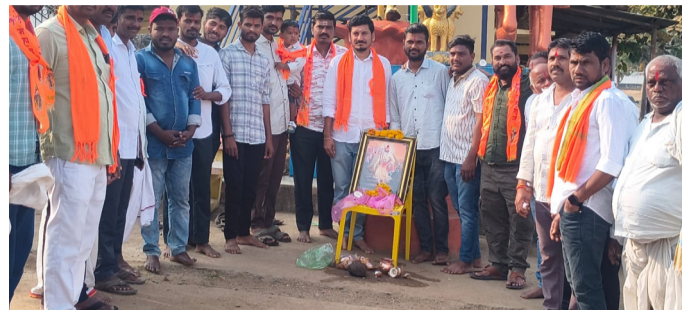
కుస్తి గ్రామంలో ఘనంగా శివాజీ జయంతి వేడుకలు