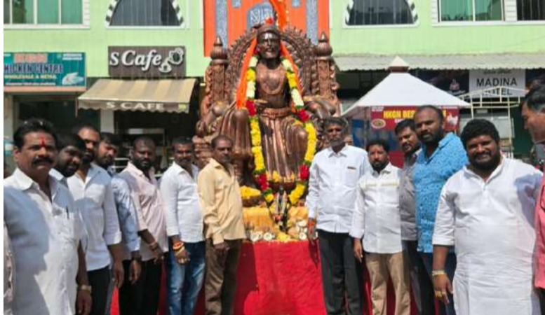
శివాజీ మహారాజ్ జయంతి ఉత్సవాలు స్థానికులతో కలిసి ఆంజనేయులు సాగర్