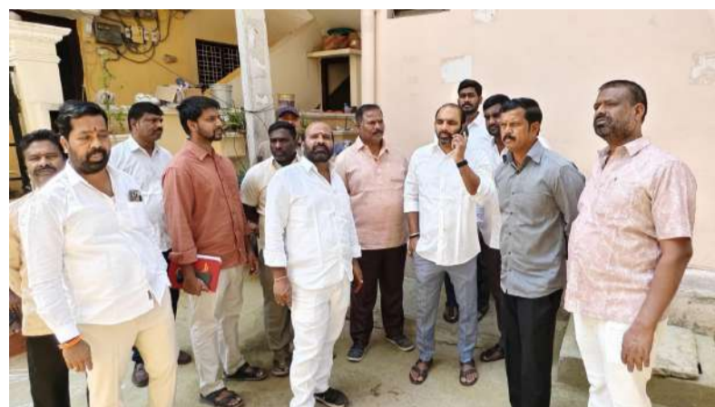
స్థానికులతో సమావేశమై సమస్యలు తెలుసుకుంటున్న ద్విశ్యం