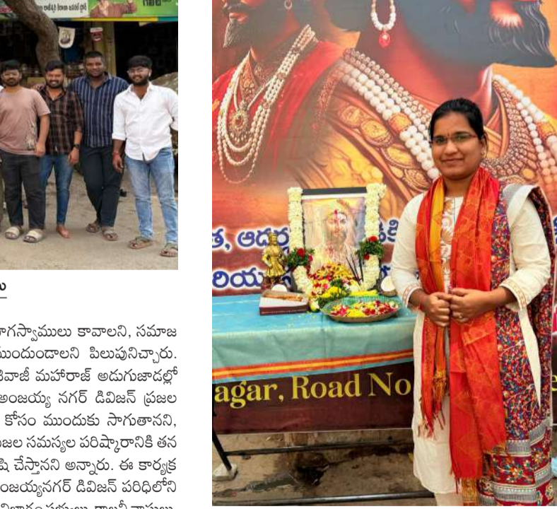
శివాజీ మహారాజ్ జయంతి వేడుకల్లో ముత్తోజు ఆమని