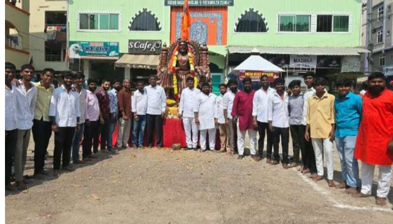
శివాజీ మహారాజ్ జయంతి ఉత్సవాలు స్థానికులతో కలిసి ఆంజనేయులు సాగర్