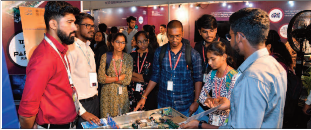
హైదరాబాద్ మార్చి 19 (సమయం న్యూస్): హైదరాబాద్లోని రసాయన శాస్త్ర పరిశోధన సంస్థ ప్రాంగణంలో సీ-డాక్ సంస్థ 39వ స్థాపన దినోత్సవాన్ని ఘనంగా నిర్వహించారు.

ఆధునిక సాంకేతిక దిశలపై ఒక రోజు శిక్షణా కార్యక్రమం నిర్వహించారు. అతిపెద్ద గణన వ్యవస్థలు, క్యాంటం గణన, కృత్రిమ మేధస్సు, వస్తువుల అంతర్దాలం, తదుపరి తర సైబర్ భద్రత వంటి రంగాల్లో తాజా అభివృద్ధులు, వినియోగాలపై నిపుణులు వివరణ ఇచ్చార అలాగే ప్రజలకు అందుబాటులో ఉంచిన సాంకేతిక ప్రదర్శనకు వివరిత స్పందన లభించింది. వెయ్యికి పైగా మంది పాల్గొని వివిధ సాంకేతిక పరిజ్ఞానాలను ప్రత్యక్షంగా అనుభవించారు. ప్రభుత్వ విభాగాలు, విద్యాసంస్థలు, పరిశోధకులు ఈ కార్యక్రమంలో పాల్గొన్నారు. ఈ ప్రదర్శనలో కృత్రిమ మేధస్సు, బ్లక్ చైన్, శక్తి ఆరోగ్యం, వ్యవసాయం, విద్య వంటి విభిన్న రంగాలకు చెందిన పరిజ్ఞానాలు ప్రదర్శించబడ్డాయి. శాస్త్రవేత్తలు స్వయంగా వివరణ ఇచ్చి పాల్గొన్నవారికి అవగాహన కల్పించారు. యువతలో సాంకేతిక ఆసక్తిని పెంపొందించడమే కాకుండా దేశ అభివృద్ధిలో భాగస్వాములు కావాలని ఈ కార్యక్రమం ప్రేరణనిచ్చిందని నిర్వాహకులు తెలిపారు.