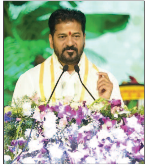
దేవస్వానం తరువైన నిర్వహించే తిరుకణ్ణా బ్రహ్మాత్మవాలకు రావాలని ఆహ్వానం పత్రం అందజేశారు.