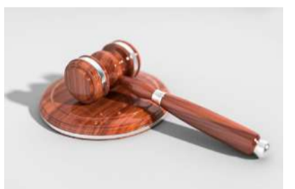
పోస్ట్ మోర్టల్ నిపుణులు, వైద్య నిపుణులతో సమన్వయం చేసుకుంటూ డిజిటల్ ఆధారాలను పక్కనాడిగా సేకరించినట్లు తెలిసింది.

దీసుకుని వారిపై లైంగిక దాడి చేసేవారు. ఈ క్రమంలో వారితో అశ్లీల వీడియోలు చిత్రీకరించి, వాటిని ఇంట రైట్ లో ప్రసారం చేసినట్లు సీబీఐ దర్యాప్తులో తెలిసింది. బాధితుల్లో మూడేళ్ల పసిపిల్లలు కూడా ఉండటం ఈ నేర తీవ్రతకు అర్థం పడుతోంది. ఈ కేసు విచారణ చేపట్టిన సీబీఐ, 2020 అక్టోబర్ 31 న కేసు సమూహం చేసి, 2021 ఫిబ్రవరి 10న రాంభవన్ దంపతులపై ఛార్జి షీట్ దాఖలు చేసింది. ఐపీసీ, పోక్సో చట్టంలోని పలు కఠిన సెక్షన్ల కింద వీరిని దోషిలుగా నిర్ధారించా తుక్త వారం కోర్టు తీర్పు ఇచ్చింది. నిందితుల నైతిక పతనం, నేరాల తీవ్రత దృష్ట్యా వారికి పశ్చాత్తాపపదే అవకాశం కూడా ఇవ్వరాదని, అత్యున్నత శిక్ష మాత్రమే సరైనదని న్యాయమూర్తి తన తీర్పులో పేర్కొన్నారు. నిందితుల లైంగిక దాడిలో తీవ్రంగా గాయపడిన కొందరు చిన్నారులు ఆసుపత్రిలో చికిత్స పొందగా, మరికొందరికి మెల్లతప్పు వంటి సమస్యలు తలెత్తాయి. చాలామంది ఇప్పటికీ మానసిక వేదన అనుభవిస్తున్నారని సీబీఐ తెలిసింది. ఈ కేసులో బాధితులందరికీ ఉత్తరప్రదేశ్ ప్రభుత్వం తలా రూ. 10 లక్షల చొప్పున పరిహారం అందించాలని కోర్టు ఆదేశించింది. నిందితుల ఇంటి నుంచి స్వాధీనం చేసుకున్న సగదును కూడా బాధితులకు సమానంగా పంచాలని సూచించింది. దర్యాప్తు సమయంలో బాధితులైన చిన్నారుల పట్ల సీబీఐ అధికారులు అత్యంత సున్నితంగా వ్యవహరించారని, వారికి కొన్ని లింగ ఇమ్మింగి వారి మానసిక స్థైర్యాన్ని కాపాడారని సీబీఐ ఒక ప్రకటనలో వెల్లడించింది.