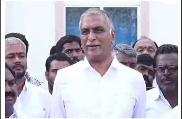
రైతుబంధు నాట్లు వేసేటప్పుడు ఇస్తారా? .. కోతలు జరిగేటప్పుడు ఇస్తారా? >> 2లో