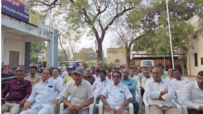
సమావేశంలో హాజరైన రేషన్ డీలర్స్

అమృత్ తెలంగాణ ఆదిలాబాద్ న్యూస్ : ఆదిలాబాద్ జిల్లాలో ప్రభుత్వ రాయిటీ బియ్యం అక్రమాలను అరికట్టేందుకు పట్టణంలోని రేషన్ డీలర్లతో ప్రత్యేక సమావేశం నిర్వహించినట్లు ఆదిలాబాద్ డిఎస్పీ ఎల్ జీవన్ రెడ్డి తెలిపారు.