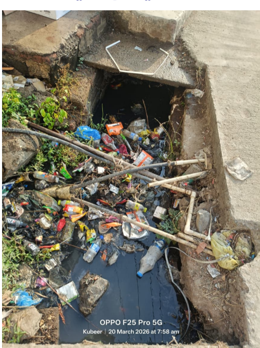
చెత్త తో పేరుకుపోయిన మురికి కాలువలో మిషన్ భగీరథ మంచినీటి ప్రేవులు

నిర్మల్ జిల్లా కుబ్బీర్ మార్చ్ 22 అమృత తెలంగాణ కుబ్బీర్ గ్రామంలోని పలు విధులలో మురికి కాలువలు చెత్త చెదరంతో పాటు ప్లాస్టిక్ కవర్లతో, బాటిల్స్ పేరుకుపోయి, మురికి నీరు ప్రవహించకుండా ఉండిపోవడంతో రాత్రింబగళ్లు దోమలతో గ్రామస్థులు తీవ్ర అవస్థలు, ఎదుర్కొంటున్నారని అశుభ్రతతో ఒకపక్క మురికి వాసన తో పాటు దోమలు విజృంభిస్తుండడంతో నరకం అనుభవిస్తున్నామని మలేరియా డెంగ్యూ టైఫాయిడ్ వ్యాధుల బారిన పడుతున్నామని ,తక్షణమే మురికి కాలువలను శుభ్రపరచగలరని, అదే విధంగా మిషన్ భగీరథ నీరు గ్రామంలోని పలు విధులలో వృధాగా మురికి కాలువలలో ప్రవహిస్తున్నాయని, వాటిపై సరైన చర్యలు