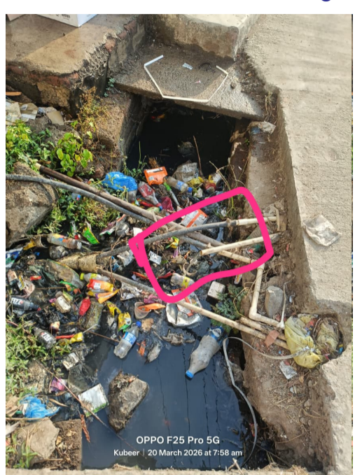
మిక్ కలర్ నల్లల్లో మిషన్ భగీరథ నీళ్లు వృధాగా మురికి కాలువలోకి ప్రవహిస్తున్న దృశ్యం