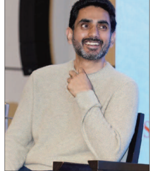
అర్ధవంతమైన విద్యా సంస్కరణలు, బలమైన పారిశ్రామిక వాతావరణం, మన యువతకు మెరుగైన అవకాశాల కోసం నా కృషిని కొనసాగిస్తాను. మీ ఆశీస్సులు, మార్గనిర్దేశానికి నా కృతజ్ఞతలు అని తన పోస్టులో పేర్కొన్నారు

తెలియజేశారు. ఇవాళ మంత్రి లోకేశ్ పుట్టినరోజు జరుపుకుంటున్నారు. ఆయనకు శుభాకాంక్షలు తెలుపుతూ పవన్ కల్యాణ్ ఒక ప్రకటన విడుదల చేశారు. రాష్ట్ర విద్యా వ్యవస్థలో భావి తరాల ప్రయోజనాలకు అనుగుణంగా మార్పులు తీసుకురావడంలో లోకేశ్ గారు ముందున్నారు. ఉపాధ్యాయులు, తల్లిదండ్రుల మధ్య సుహృద్భావ వాతావరణం కల్పిస్తూ, పాఠశాలల్లో మౌలిక వసతుల కల్పనపై ప్రత్యేక దృష్టి సారించారు. రాష్ట్రంలో ఐటీ సంస్థల స్థాపనకు కృషి చేస్తూ, యువతకు ఉద్యోగ, ఉపాధి అవకాశాలు మెరుగుపరిచేందుకు ప్రణాళికలు సిద్ధం చేశారు. ప్రజలకు సేవ చేస్తూ రాష్ట్రాన్ని అభివృద్ధి పథంలోకి తీసుకువెళ్లేందుకు ఆయనకు భగవంతుడు మరింత శక్తిని, సుఖసంతోషాలను అందించాలని ప్రార్థిస్తున్నామని అని పవన్ పేర్కొన్నారు. పవన్ కల్యాణ్ శుభాకాంక్షలపై నారా లోకేశ్ సోషల్ మీడియా వేదికగా స్పందించారు. మీ అత్యుయ శుభాకాంక్షలకు, ప్రోత్సాహానికి చాలా ధన్యవాదాలు పవన్ అన్న. మీ ప్రోత్సాహకర మాటలు నా సంకల్పానికి మరింత బలాన్నిచ్చాయి.