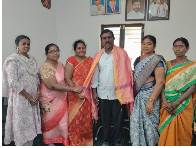
సర్పాహార జీ పాలకవర్గ సభ్యులను సన్మానిస్తున్న దృశ్యం