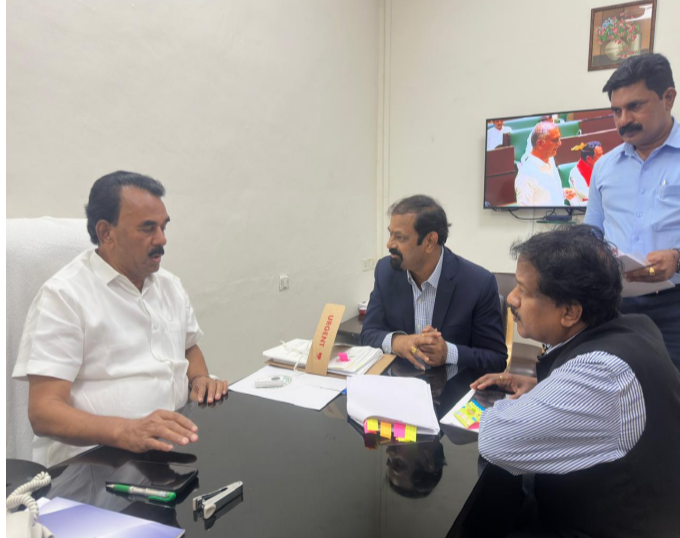
సమావేశాల తర్వాత ట్రిపుల్ ఐటీని సందర్శించి, విద్యార్థులతో చర్చిస్తామని ఈ సందర్భంగా మంత్రి తెలిపారు.