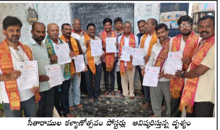
సీతారాముల కళ్యాణోత్సవం పోస్టర్లు ఆవిష్కరిస్తున్న దృశ్యం