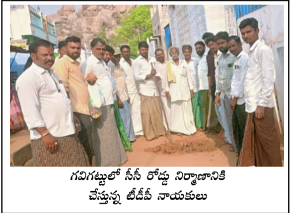
గవిగట్టులో సీసీ రోడ్డు నిర్మాణానికి చేస్తున్న డి.వై.ఎస్.ఆర్. నాయకులు

ఉపాధి హామీ పథకం కింద గ్రామాభివృద్ధికి మరో అడుగు ..