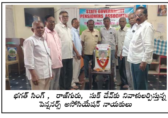
భగత్ సింగ్, రాజ్ గురు, సుఖ దేవ్ కు నివాళులర్పిస్తున్న పెన్షనర్స్ అసోసియేషన్ నాయకులు

అనంతపురం రూరల్ (తెలుగోడు), మార్చి 23: అనంతపురం నగరపాలక సంస్థలో ప్రత్యేక అధికారుల పాలన రావడంతో ఎమ్మెల్యే దగ్గుపాటి ప్రసాద్ నగరపాలక సంస్థపై దృష్టి పెట్టారు. ప్రస్తుతం నగరపాలక సంస్థకు ప్రత్యేక అధికారిగా ఉన్న జిల్లా కలెక్టర్ ఓ.అనంత్ తో కలెక్టరేట్లో కీలక సమావేశం జరిగింది. కమిషనర్ జస్టెస్ రావు, ఇతర అధికారులతో పాటు ఆయన జిల్లా కలెక్టర్ ని కలిశారు. నగరంలో జరుగుతున్న అభివృద్ధి కార్యక్రమాలు, ఇంకా చేపట్టాల్సిన పనులు, ప్రజా సమస్యలు, ఇతర వాటిపై ప్రధానంగా చర్చించారు. ప్రస్తుతం జరుగుతున్న పనులు వేగవంతమయ్యేలా అధికారులకు ఆదేశాలు ఇచ్చేలా చూడాలని ఎమ్మెల్యే దగ్గుపాటి కోరారు. అలాగే నగరంలో అక్రమ కట్టడాలు గురించి ప్రత్యేకంగా దృష్టి సారించాల్సిన అవసరం ఉందన్నారు.