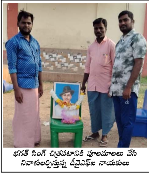
భగత్ సింగ్ చిత్రపటానికి పూలమాలలు వేసి నివాళులర్పిస్తున్న డి.వై.ఎస్.ఆర్. నాయకులు