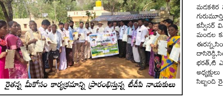
రైతన్న మీకోసం కార్యక్రమాన్ని ప్రారంభిస్తున్న డి.డి.పి నాయకులు

రోజ్, (తెలుగోడు) మార్చి 23: రాష్ట్ర ప్రభుత్వ ఆదేశాల మేరకు రైతన్నా మీ కోసం కార్యక్రమాన్ని మండలంలోని దొడ్డేరి రైతు సేవా కేంద్రంలో సోమవారం మండల తెలుగుదేశం పార్టీ నాయకులు ప్రారంభించారు. రైతు శ్రేయస్సు కోసం ప్రభుత్వ ప్రత్యేక కృషి చేస్తుందని ఇందులో భాగంగానే ప్రతి ఏటా ప్రతి రైతుకు 20 వేలు చొప్పున అన్నదాత సుభీభవ, ఓపిం కిసాన్ అందిస్తున్నారని తెలిపారు. అన్నదాతా సుభీభవ - ఓపిం కిసాన్ పథకం కింద మూడు విధతల్లో ఒక్కొక్కరికి రూ.20 వేల చొప్పున అదృత ఉన్న ప్రతి రైతు