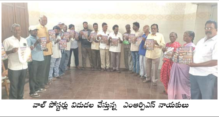
వాలి పోస్టర్లు విడుదల చేస్తున్న ఎంఆర్ఎస్ నాయకులు