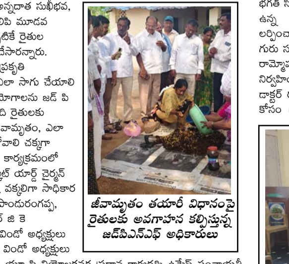
జీవామృతం తయారీ విధానంపై రైతులకు అవగాహన కలిపిస్తున్న జి.డి.పి.ఎస్.ఎఫ్ అధికారులు