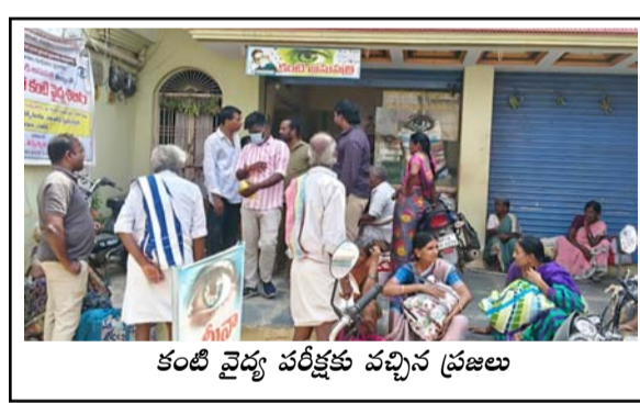
కంటి వైద్య పరీక్షకు వచ్చిన ప్రజలు