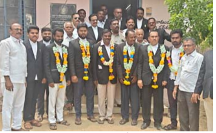
మడకశిర బాల్ అసోసియేషన్ కార్యవర్గం