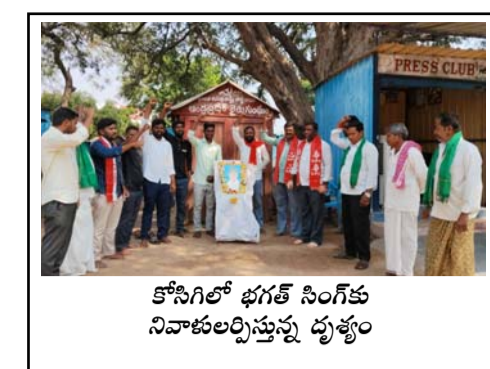
కోసిగిలో భగత్ సింగ్ కు నివాళులర్పిస్తున్న దృశ్యం

అనంతపురం రూరల్ (తెలుగోడు), మార్చి 23: అనంతపురం నగరపాలక సంస్థలో ప్రత్యేక అధికారుల పాలన రావడంతో ఎమ్మెల్యే దగ్గుపాటి ప్రసాద్ నగరపాలక సంస్థపై దృష్టి పెట్టారు. ప్రస్తుతం నగరపాలక సంస్థకు ప్రత్యేక అధికారిగా ఉన్న జిల్లా కలెక్టర్ ఓ.అనంత్ తో కలెక్టరేట్లో కీలక సమావేశం జరిగింది. కమిషనర్ జస్టెస్ రావు, ఇతర అధికారులతో పాటు ఆయన జిల్లా కలెక్టర్ ని కలిశారు. నగరంలో జరుగుతున్న అభివృద్ధి కార్యక్రమాలు, ఇంకా చేపట్టాల్సిన పనులు, ప్రజా సమస్యలు, ఇతర వాటిపై ప్రధానంగా చర్చించారు. ప్రస్తుతం జరుగుతున్న పనులు వేగవంతమయ్యేలా అధికారులకు ఆదేశాలు ఇచ్చేలా చూడాలని ఎమ్మెల్యే దగ్గుపాటి కోరారు. అలాగే నగరంలో అక్రమ కట్టడాలు గురించి ప్రత్యేకంగా దృష్టి సారించాల్సిన అవసరం ఉందన్నారు.