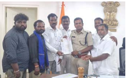
వెన్నీకి వినతి పత్రం అందజేస్తున్న టీఎస్పీఎమ్మార్పీఎస్, దళిత సంఘాలనేతలు