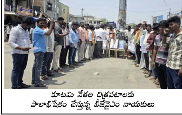
కూటుపి నేతల చిత్రపటాలకు పాలాభిషేకం చేస్తున్న బీజేపైని నాయకులు