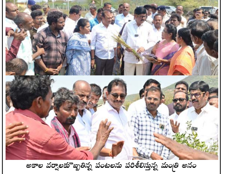
అకాల వర్షాలకు బిచ్చితిన్న పంటలను పరిశీలిస్తున్న మంత్రి ఆసం