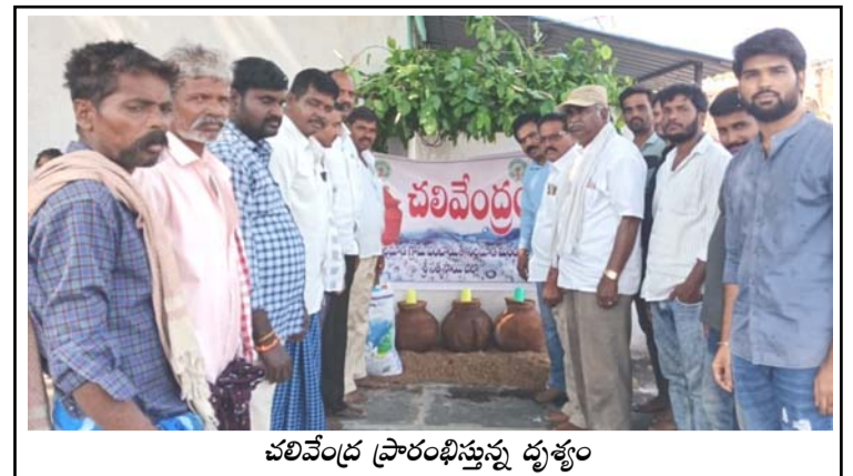
చలివేంద్ర ప్రారంభిస్తున్న దృశ్యం