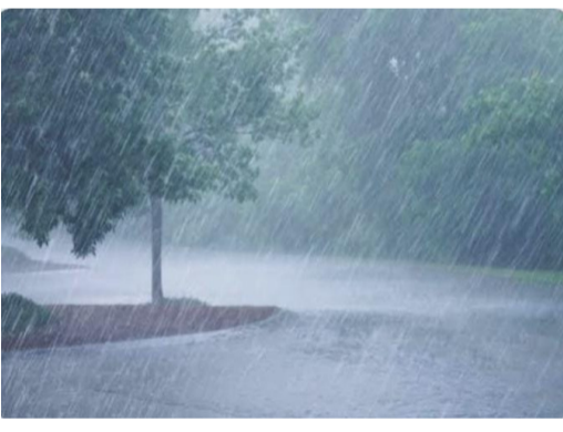
ఆదుకోవాలని రైతులు కోరుతున్నారు.

మల్లాపూర్ అమృత్ తెలంగాణ ఫిబ్రవరి 24, జగిత్యాల జిల్లా మల్లాపూర్ మండలంలోని పలు గ్రామాల్లో సోమవారం రాత్రి ఈదురు గాలులతో పాటు ఉరుములు మెరుపులతో కూడిన కురిసిన అకాల భారీవర్షానికి రైతులు తీవ్రంగా నష్టపోయారు. ఈదురు గాలులకు మామిడి పూత, కాదులు రాలి పోవడంతో రైతుల బాధపడుతున్నారు. పలు గ్రామాల్లో చేతికొడివచ్చిన ఎర్రమిర్చి పంటలతోపాటు, ఉడకబెట్టి జిల్లాల్లో ఎండబెట్టిన పసుపు పంట సైతం కురిసిన వర్షానికి నీరునిలిచి చెడిపోయి చాలా నష్టపోయామని రైతులు ఆవేదన వ్యక్తం చేస్తున్నారు. ప్రభుత్వం సరైన సమయంలో సరైన తగినంత ఎరువులు ఇవ్వకపోవడంతో అంతంత మాత్రమైనా పండి చేతికొడిన పంటలు అకాల వర్షాలకు నష్టపోవడంతో