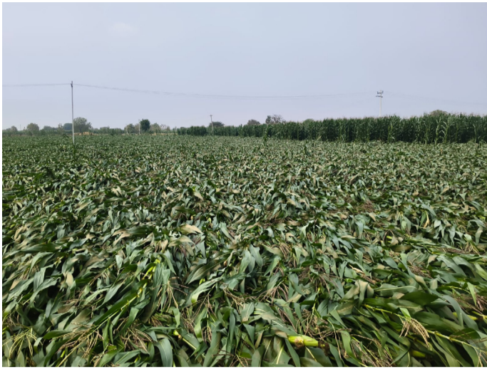
అకాల వర్షానికి నేలకొరిగిన మొక్కజొన్న

వర్షం తో నష్టపోయిన రైతాంగాన్ని ప్రభుత్వం ఆదుకోవాలి నష్టపోయిన పంటను పరిశీలించిన ఎమ్మెల్యే పటేల్