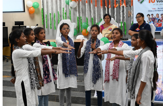
ఓటు హక్కు పై విద్యార్థులతో ప్రమాణం చేస్తున్న దృశ్యం