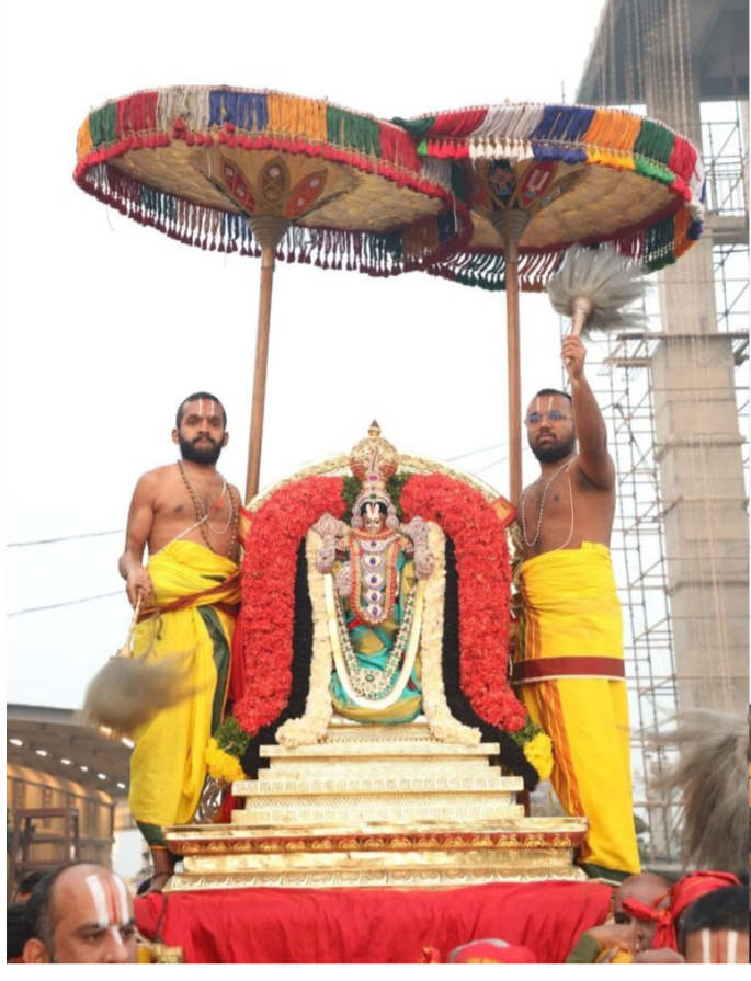
రథోత్సవం పై అధిరోహింప జేసి ఆలయ మాడవీధులలో శోభాయమానంగా ఊరేగించారు.

యాదాద్రి: అమృత్ తెలంగాణ: తెలంగాణ రాష్ట్రంలోని ప్రముఖ వైష్ణవ పుణ్యక్షేత్రమైన యాదాద్రి తిరుమల స్వర్ణగిరి దేవస్థానంలో ఆదివారం రోజున సప్త వాహనాలపై శ్రీదేవి భూదేవి సమేతంగా ఊరేగిన శ్రీనివాసుడు. స్వర్ణగిరి దేవస్థానంలో రథ సప్తమి వేడుకలలో భాగంగా నేటి ఉదయం సుప్రభాత సేవ మొదలుకొని సప్త వాహనాలు సూర్య ప్రభా వాహనం, చంద్ర ప్రభా వాహనం, గరుడ వాహనాలపై శ్రీదేవి భూదేవి సమేతంగా స్వర్ణగిరి శ్రీనివాసుడు అలయ పురవీధులలో వందలాది మంది భక్తుల గోవిందా నామాలు పఠిస్తూ స్వామివారి పల్లకి సేవను మోసేందుకు అత్యంత ఉత్సాహాన్ని కనబరిచారు. రథ సప్తమి వేడుకలలో చిన్నపిల్లలు కూచిపూడి భరతనాట్యం వంటి కార్యక్రమాలతో ఆలయానికి విచ్చేసిన భక్తులను ఆలరించారు. మధ్యాహ్నం స్వామివారి నిత్యాన్న ప్రసాద కార్యక్రమంలో భాగంగా నేడు సుమారు 3000 మందికి పైగా భక్తులు స్వామివారి నిత్యాన్న ప్రసాదాన్ని స్వీకరించారు. రాత్రి 8 గంటలకు స్వర్ణగిరి శ్రీనివాసుని దివ్య విమాన