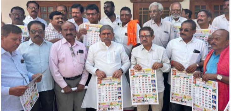
లింగాయతి నూతన క్యాలెండర్ ఆవిష్కరణ