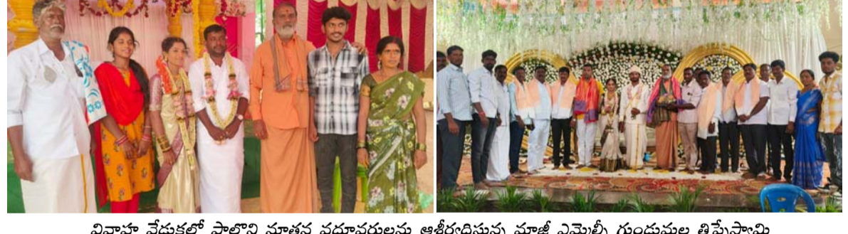
వివాహ వేడుకల్లో పాల్గొని సూతన పద్మావతిలను ఆశీర్వాదిస్తున్న మాజీ ఎమ్మెల్యే గుండుమల తిప్పేస్వామి