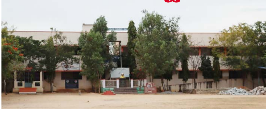
(మొదటి పేజి (తరువాతి))

ఉచితంగా అందించడంతో పాటు 'తల్లికి వందనం' వంటి ప్రోత్సాహక పథకాలు అమలు చేస్తున్నా ఫలితం కనిపించడం లేదు. దీంతో అన్ని సౌకర్యాలున్నా పిల్లలు బడికి రావడం లేదంటే లోపం ఎక్కడో ఉందనే భావన కలగక తప్పదు. ఇక మరింత ఆశ్చర్యకరమైన విషయం ఏమిటంటే నల్లమాద జిల్లా పరిషత్ ఉన్నత పాఠశాల పీఠం శ్రీ పథకానికి ఎంపిక కావడంతో పాఠశాల అభివృద్ధికి కేంద్ర ప్రభుత్వం ద్వారా భారీగా నిధులు అందుతున్నాయి. ఈ నిధులతో విద్యార్థుల అవసరాలకు అనుగుణంగా మరిన్ని మౌలిక వసతులు, ఆధునిక తరగతి గదులు, డిజిటల్ విద్యా సదుపాయాలు, ల్యాబ్ లు, క్రీడా వసతులు ఏర్పాటు చేసే అవకాశం ఉన్నప్పటికీ, వాటి ప్రభావం విద్యార్థుల సంఖ్య పెరుగుదలలో మాత్రం కనిపించడం లేదన్న విషయం ఉన్నాయి. నిధులు రావడం గొప్ప... కానీ పిల్లలు లేకపోతే ఆ నిధుల ప్రయోజనం ఎవరికీ అని విద్యార్థులకు ప్రశ్నిస్తున్నారు. మరోవైపు పాఠశాలకు వెళ్లాలమని చెప్పి ఇంటి నుంచి బయలుదేరిన కొందరు విద్యార్థులు నల్లమాదకు వచ్చి అటూ ఇటూ తిరుగుతూ సుమయాన్ పుణా చేసుకుంటున్నారని ఆందోళన వ్యక్తం అవుతోంది. బడికి ఉంటే మా పిల్లలు సురక్షితంగా ఉంటారు. బడి బయట ఉంటే వాళ్లు దారి తప్పతున్నారు అంటూ కొందరు తల్లిదండ్రులలో కూడా పలు అభిప్రాయాలు వ్యక్తం అవుతున్నాయి. ఆ విషయంలో తల్లిదండ్రుల పర్యవేక్షణ లోపం స్పష్టంగా ఉందని, ఉపాధ్యాయులు కూడా ఎటువంటి చర్యలకు