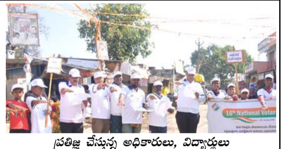
ప్రతిజ్ఞ చేస్తున్న అధికారులు, విద్యార్థులు.