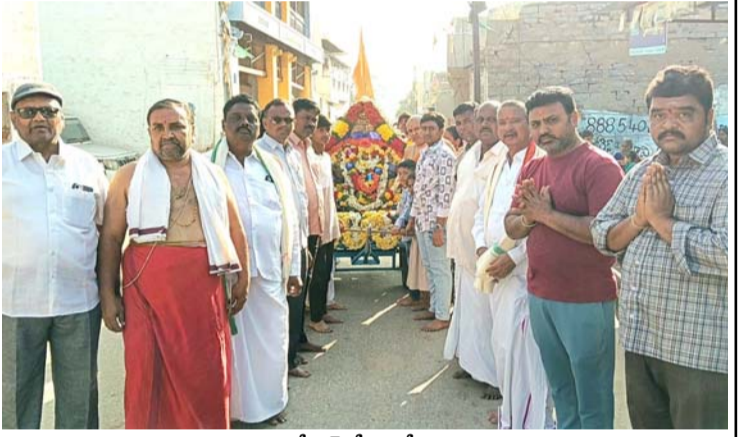
రథసప్తమి సందర్భంగా కనేకల్లో ఊరేగింపు నిర్వహిస్తున్న భక్తులు