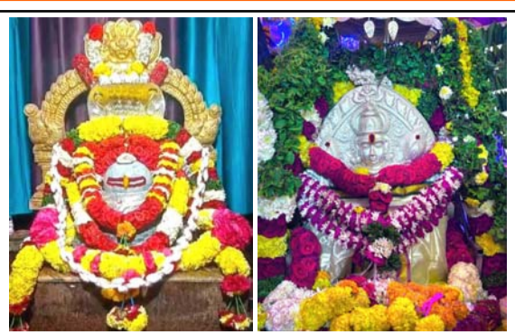
ప్రత్యేక అలంకరణలో శ్రీ చక్ర భీమలింగేశ్వర స్వామి, శ్రీ అశ్వర్థ నారాయణ స్వామి

శ్రీ అశ్వర్థ నారాయణస్వామి, శ్రీ చక్ర భమలింగేశ్వరస్వామి నామస్తరణతో మారుమోగిన్న అశ్వర్థం.. మొదటి ఆదివారం ముస్తాబైన శ్రీ అశ్వర్థ నారాయణస్వామి కట్ట ..