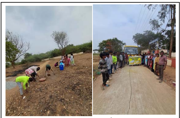
ప్రాథమిక పాఠశాల ఆవరణను చేస్తున్న విద్యార్థులను ఎన్.ఎస్.ఎస్. స్టేషన్ ప్రోగ్రాంలో పాల్గొన్న విద్యార్థులను