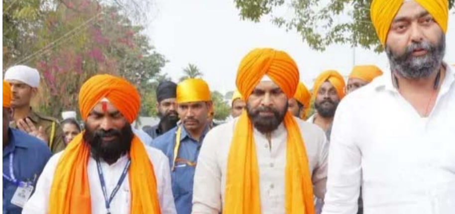
ముంబాయి (తెలుగోడు), జనవరి 25 :

రాష్ట్ర ఉప ముఖ్యమంత్రి పవన్ కళ్యాణ్ ఆదివారం మహారాష్ట్ర పర్యటనలో భాగంగా ముఖ్యమంత్రి దేవేంద్ర ఫడ్నెవీస్ తో కలిసి నాందేడ్ లోని తబ్లీ సచ్ ఖండ్ గురుద్వారాను సందర్శించారు. సిక్కులు 10వ ఖండ గురువు శ్రీ గురు గోవింద్ సింగ్ సాయుధా సమాధి మందిరాన్ని దర్శించుకున్న పవన్ కళ్యాణ్ అక్కడ ప్రత్యేక ప్రార్థనల్లో పాల్గొన్నారు. పవిత్ర ఎలక్ట్రానిక్ డౌనేషన్ మెషిన్లు పవన్ కళ్యాణ్ ప్రారంభించారు. శ్రీ గురు తేగ్ బహదూర్ సింగ్ 35వ వేదన పవన్ కళ్యాణ్, అనంతరం మాట్లాడుతూ శ్రీ గురు తేగ్ బహదూర్ సింగ్ దేశంవేటికీ న్యూర్నిచ్చిన మహనీయుడని పేర్కొన్నారు. ఆయన త్యాగం భవిష్యత్ తరాలకు మార్గదర్శకమని, అలాంటి గురువు షాహిద్ సమాగమంలో పాల్గొనడం గౌరవమని తెలిపారు..