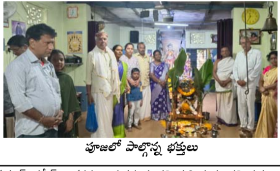
పూజలో పాల్గొన్న భక్తులు