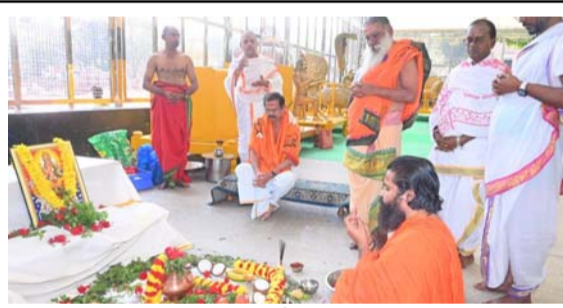
రథసప్తమి పూజలు చేస్తున్న ఆలయ అధికారులు

శ్రీశైలం (తెలంగాణ), జనవరి 25 : శ్రీశైలం మహా శ్రీశైలంలో రథసప్తమి (మాఘ శుద్ధ సప్తమి) పర్వదినాన్ని పురస్కరించుకుని ఆదివారం నాడు ఆలయప్రాంగణంలోని అక్షయహోదేవి అలంకార మండపంలో సూర్యారాధన జరిపించారు. ముందుగా దేశం శాంతి సౌభాగ్యాలతో విలసిల్లాలని, ప్రకృతి వైపరీత్యాలను సంభవించకుండా సకాలంలో తగినంత వర్షాలు కురిసి దేశం పాడివంటలతో తులతూగాలని, జనసందరికి ఆయురారోగ్యాలు కలిగి వారికి ఆకాలమరణాలు జరగకుండా ఉండాలని, దేశంలో అన్ని ప్రమాదాలు, వాహన ప్రమాదాలు జరగకుండా ఉండాలని, అన్ని సామాజిక వర్గాల ప్రజలు సుఖశాంతలతో ఉండాలంటూ ఆలయ అర్చకులు, వేదపండితులు లోక కల్యాణ సంకల్పం వహించారు. తరువాత కలశస్థాపన చేసి కార్యక్రమం నిర్వహించగా జరగాలని మహాభజనపూజ జరిపించారు. అనంతరం వైదికాచార్యులు ఆయా ఓజ్జ్వలాలతోనూ, ప్రత్యేక ముద్రలతోనూ సూర్యసమస్థానాలు చేసారు. ఈ కార్యక్రమంలో భాగంగానే సూర్యయంత్ర పూజ, వేదపారాయణలు, అరుణపారాయణ, జరిపించారు. అనంతరం సూర్యభగవానుడికి ఉత్తరపూజనము (పోడోవోచారపూజ), నివేదన, మంత్రపుష్పము జరిపించబడ్డాయి. మన పూజాలలో ఈ సూర్యారాధన ఎంతో విశేషంగా చెప్పబడింది. సూర్యారాధన వల్ల అనారోగ్యం తొలగి