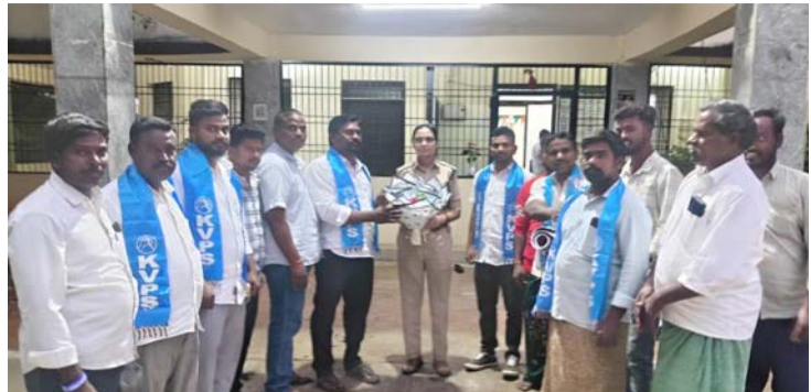
కెవిపిఎస్ నూతన క్యాలెండర్ ఆవిష్కరణ