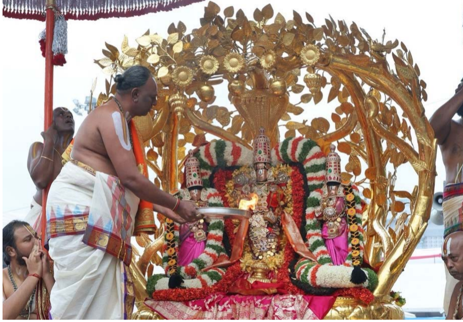
తిరుమల (తెలుగోడు), జనవరి 25 :

రథసప్తమి పర్వదినాన్ని పురస్కరించుకుని తిరుమల శ్రీ వేంకటేశ్వర స్వామి సన్నిధి భక్తులతో కిటకిలాడుతోంది. సూర్య జయంతిగా పరిగణించే ఈ అమృతావ సందర్భంలో తిరుమలలో రథసప్తమి ఉత్సవాలు చిన్న బ్రహ్మోత్సవాలలా అత్యంత వైభవంగా జరుగుతున్నాయి. ఏడాది లో ఒకేసారి స్వామివారు ఏడు వాహనాలపై విహరించే అరుదైన ఘట్టానికి లక్షలాది మంది భక్తులు తరలివచ్చారు. నిత్యైకార్యాల ముగిసిన అనంతరం ఉదయం 5.30 గంటలకు శ్రీమధుర్వ స్వామివారు ఆయనం నుంచి వాచనం మండపానికి చేరుకున్నారు. అక్కడ విశేష సమర్పణల అనంతరం సూర్యోదయనికి ముందు సర్కారు హోటల్లో సూర్యప్రభ వాచనం సేవ ప్రారంభమైంది. సూర్యోదయ సమయంలో సూర్యప్రభపై స్వామివారి దర్శనం భక్తులకు ఆధ్యాత్మిక పరవశాన్ని కల్పించింది. ఆ తర్వాత స్వామివారు చిన్నశేష, గురు, హాస, ఆశ్చ, గజ వాహనాలపై తిరుమాద వీధుల్లో