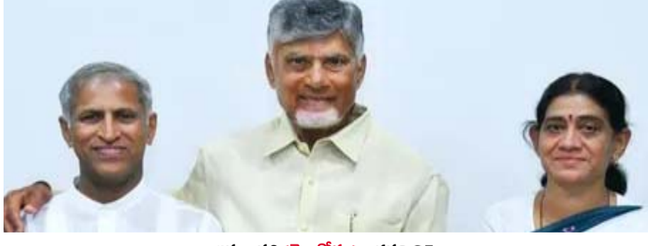
అమరావతి (తెలుగోడు), జనవరి 25 :

ప్రభుత్వ సలహాదారుగా మంతెన, ఒక్కరూపాయి సదుపాయం కూడా వర్షాన్ని సంపాదన నిర్ణయం