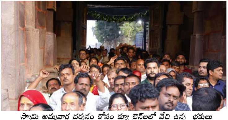
స్వామి అమ్మవార్ల దర్శనం కోసం క్యూ లైన్లో వేచి ఉన్న భక్తులు

శ్రీశైలం (తెలంగాణ), జనవరి 25 : ప్రముఖ శైవ శ్రేణిగా శక్తివీరంగా విరాజిల్లుతున్న శ్రీశైల మహా శ్రీశైలానికి భక్తులు తాకిడి తీసుకుంటున్నారు. దేశ నలుమూలల నుండి శ్రీశైలం చేరుకున్న భక్తులు స్వామి అమ్మవార్లను దర్శించుకునేందుకు పోటీపడ్డారు. వరస నెలలపై రోజులు కావడంతో భక్తుల రద్దీ శ్రీశైలానికి పోటీపడి భక్తుల రద్దీతో పాటు భక్తులకు స్వామి అమ్మవార్ల దర్శన చేశాలి మార్పులు చేయాలి అంటూ ఎక్కువ సమయం పడుతోంది. ట్రాఫిక్ ఇబ్బందులతో భక్తులు తీవ్ర ఇబ్బందులు ఎదుర్కొన్నారు. అధిక సంఖ్యలో భక్తులు శ్రీశైలం చేరుకోవడంతో వసతి కూడా ఇబ్బందికరంగా మారింది రూముల దొరక్క భక్తులు రోడ్డుపైనే కుటుంబ సభ్యులతో రాతంతా గడిచారు సుమారు 70 వేల మంది ష్రా భక్తులు స్వామి అమ్మవార్లను దర్శించుకున్నారు అందనా.