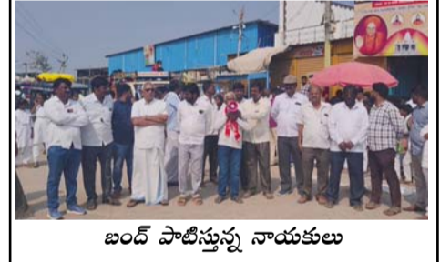
బంద్ పాటిస్తున్న నాయకులు