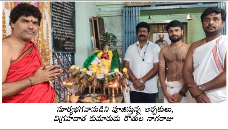
సూర్యభగవానుడిని పూజిస్తున్న అర్చకులు, విగ్రహదాత కుమారుడు రాతుల నాగరాజు