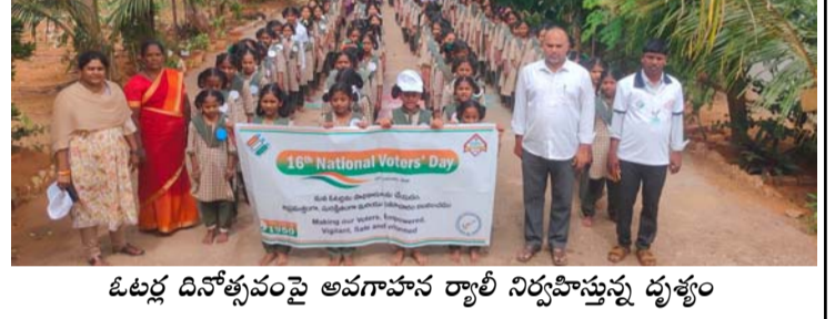
ఓటర్ల దినోత్సవంపై అవగాహన ర్యాలీ నిర్వహిస్తున్న దృశ్యం