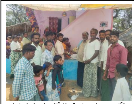
కుసుమన్న మృతదేహానికి పూలమాలలు వేసి నివాళులర్పిస్తున్న దృశ్యం