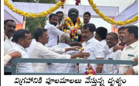
విగ్రహాలికి పూలమాలలు వేస్తున్న దృశ్యం