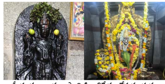
శ్రీ సూర్యనారాయణ స్వామికి అభిషేకం చేస్తున్న దృశ్యం శ్రీ లక్ష్మీ నరసింహ స్వామికి పూలతో అలంకరణ