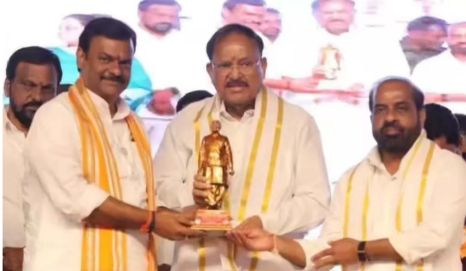
విజయవాడ (తెలుగోడు), జనవరి 25 :