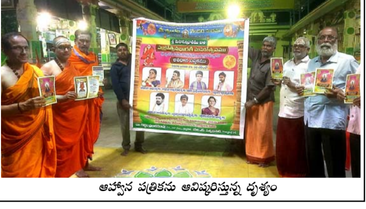
ఆహ్వాన పత్రాలను అందిస్తున్న భక్తులు