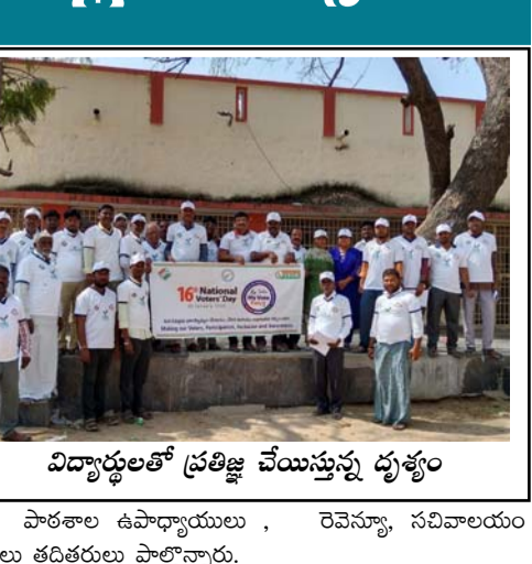
విద్యార్థులతో ప్రతిజ్ఞ చేస్తున్న దృశ్యం

రేవన్న, పాఠశాల ఉపాధ్యాయులు , రెవెన్యూ, సచివాలయం ఉద్యోగులు తదితరులు పాల్గొన్నారు.