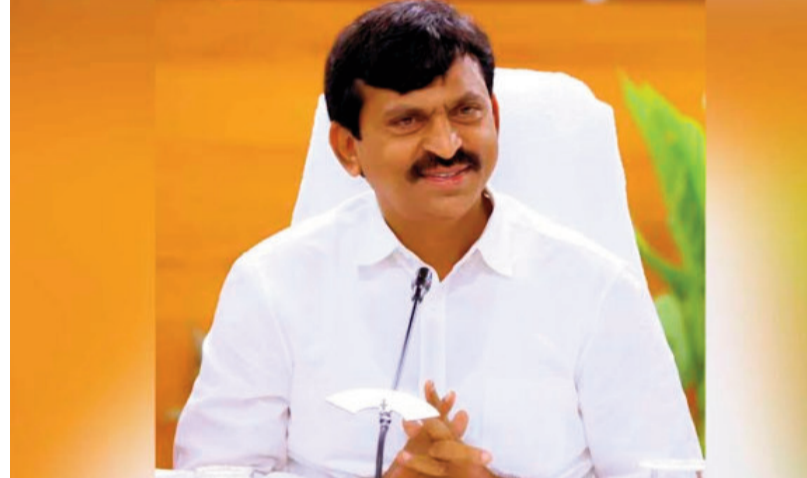
- ప్రజలకు గౌరవప్రదమైన సేవలే లక్ష్యం. - మంత్రి పొంగులేటి శ్రీనివాస్ రెడ్డి.