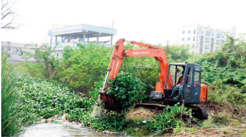
పర్వత నీరు సాఫీగా వెళ్లేందుకు చర్యలు.