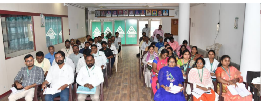
హాజరైన డిసిసి బి బ్యాంకు అధికారులు

ఈ సందర్భంగా కలెక్టర్ మాట్లాడుతూ, ప్రస్తుత ఆర్థిక సంవత్సరం ముగిపునకు వస్తున్న తరుణంలో బ్యాంక్ కార్యకలాపాలను మరింత వేగవంతం చేయాలని అధికారులను ఆదేశించారు. ముఖ్యంగా మార్చి నెలాఖరు నాటికి