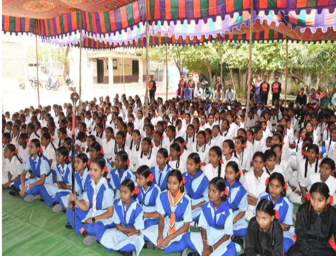
హాజరైన విద్యార్థిని విద్యార్థులు