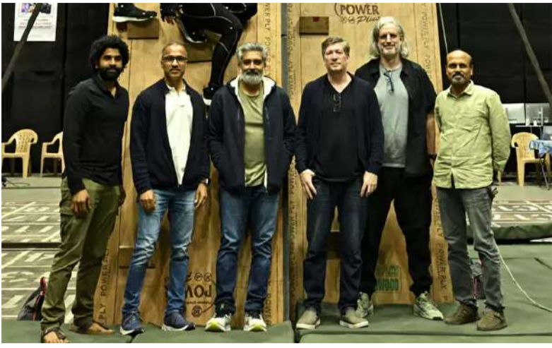
మోషన్ క్యాప్చర్ టెక్నాలజీతో 'వారణాసి' షూట్..