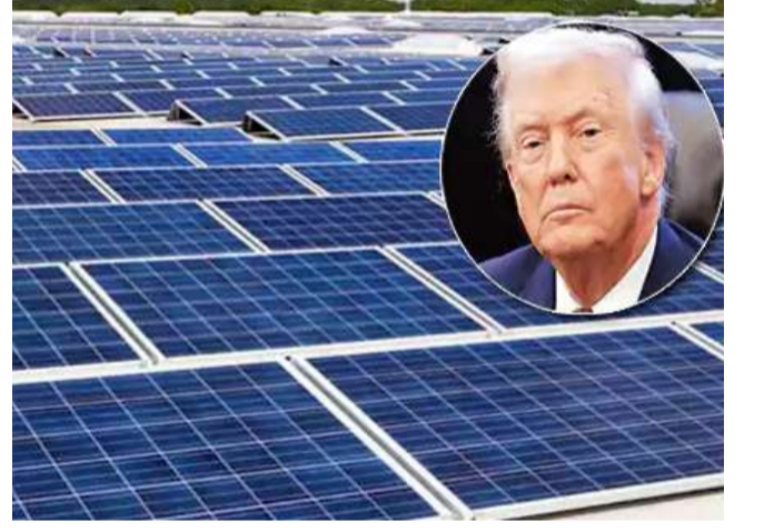
అమెరికా అధ్యక్షుడు డొనాల్డ్ ట్రంప్ మరోసారి భారత్ను టార్గెట్ చేశారు. మన దగ్గరి నుంచి అమెరికాకు దిగుమతి అయ్యే సోలార్ ఉత్పత్తులపై (Solar Imports) ప్రాథమికంగా 126 శాతం డ్యూటీ విధించారు.

మరోసారి ట్రంప్ టార్గెట్లో భారత్.. ఆ దిగుమతులపై 126 శాతం డ్యూటీ..! అమెరికా అధ్యక్షుడు డొనాల్డ్ ట్రంప్ మరోసారి భారత్ను టార్గెట్ చేశారు. మన దగ్గరి నుంచి అమెరికాకు దిగుమతి అయ్యే సోలార్ ఉత్పత్తులపై (Solar Imports) ప్రాథమికంగా 126 శాతం డ్యూటీ విధించారు. ఇండోనేసియాపై ప్రాథమిక సుంకాలను 86 శాతం నుంచి 143 శాతం డ్యూటీ వేశారు. ఫారెన్ సబ్సిడీల ఆధారంగా రేటును నిర్ధారించినట్లు అమెరికా వాణిజ్య శాఖ వెల్లడించింది. ఈ మూడు దేశాల నుంచి అగ్రరాజ్యానికి దిగుమతి అవుతున్న స్టీల్, ప్లాస్టిక్ వంటి సోలార్ దిగుమతుల విలువ 4.5 బిలియన్ డాలర్లని అంతర్జాతీయ మీడియా కథనాలు వెల్లడించాయి. తమ సోలార్ ఉత్పత్తులపై ఈ దేశ ప్రభుత్వం అసంబద్ధ రీతిలో సబ్సిడీలు ఇస్తున్నాయని ట్రంప్ (Donald Trump) ప్రభుత్వం వాదించింది. అమెరికా ఫస్ట్ విధానానికి ట్రంప్ తొలి ప్రాధాన్యం ఇస్తున్నారు. స్థానిక తయారీని ప్రోత్సహించడానికి తాపత్రయపడుతున్నారు. ఈ అధిక డ్యూటీ కారణంగా అమెరికా వినియోగదారులు సోలార్ దిగుమతులపై ఎక్కువ చెల్లించాల్సి ఉంటుంది. ఇదిలాఉంటే.. ప్రపంచ దేశాలపై ఇప్పటికే ట్రంప్ ఎడాపెడా విధించిన సుంకాలను అమెరికా సుప్రీంకోర్టు రద్దు చేసిన సంగతి తెలిసిందే. ఇలాంటి సమయంలో ఈ డ్యూటీ విధింపు ప్రాధాన్యం సంతరించుకుంది.