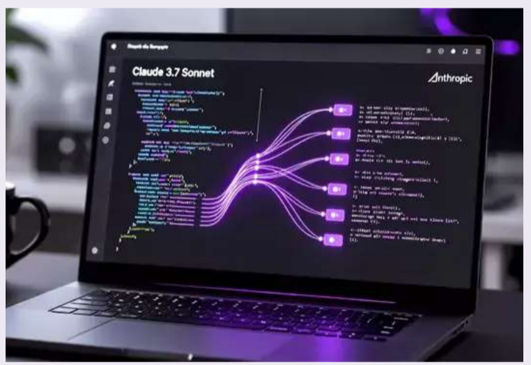
విలువ 380 బిలియన్ డాలర్లకు పెరిగినట్లు ఆంధ్రోపిక్ ఓ ప్రకటనలో పేర్కొంది. మార్కెట్ క్రితం ఒక డాలర్తో మొదలైన ఆదాయం ప్రస్తుతం 14 బిలియన్ డాలర్లకు పెరిగిందని తెలిపింది.

ఆంధ్రోపిక్.. అనతి కాలంలోనే టెక్ దిగ్గజాలను అధిగమించి! టెక్ రంగంలో 'ఆంధ్రోపిక్' ఏబి (Anthropic AI) ప్రకంపనలు సృష్టించింది. కొత్త ఏబి మోడల్లతో కంపెనీలను ఆకర్షిస్తోంది. దీంతో ఆ సంస్థ మార్కెట్ విలువ అనతికాలంలోనే లికార్డు స్థాయికి చేరింది. ఐదేళ్ల క్రితం స్థాపనగా ప్రారంభమైన ఆ సంస్థ.. మార్కెట్ విలువలో అనేక టెక్ దిగ్గజాలను మించిపోతోంది. తాజాగా ఆంధ్రోపిక్ విలువ 380 బిలియన్ డాలర్లకు చేరినట్లు అంచనా. ఓపెన్ఎఐ (OpenAI) నుంచి బయటకు వచ్చిన కొందరు పరిశోధకులు 2021లో ఆంధ్రోపిక్ ఏబిని స్థాపించారు. క్లౌడ్ (Claude) ట్రాండ్ కింద కొత్త ఏబి మోడల్లను అందుబాటులోకి తీసుకొస్తున్నారు. సొంతగా కోడ్ రాయడం, సాఫ్ట్వేర్లో లోపాలను పరిష్కరించడం, డేటా అనాలిసిస్ తో పాటు కలిపి పనిచేసే టూల్స్ కు కూడా పూర్తిచేసే సామర్థ్యంనున్నట్లు చెబుతోన్న సంస్థ. ఐటీ సర్వీస్ ప్రొవైడర్లకు నవారో విసురుతోంది. అయినప్పటికీ ఈ ఏబి టూల్స్ వల్ల వేగంగా పని జరగడంతోపాటు ఖర్చులు తక్కువయ్యే అవకాశం ఉండడంతో అనేక కంపెనీలు ఇందులో పెట్టుబడులు పెడుతున్నట్లు తెలుస్తోంది. ఇటీవల సిరీస్ బీ నుంచి 30 బి.డాలర్లు పెట్టుబడులు సేకరించడంలో సంస్థ విలువ 380 బిలియన్ డాలర్లకు పెరిగినట్లు ఆంధ్రోపిక్ ఓ ప్రకటనలో పేర్కొంది. మార్కెట్ క్రితం ఒక డాలర్తో మొదలైన ఆదాయం ప్రస్తుతం 14 బిలియన్ డాలర్లకు పెరిగిందని తెలిపింది.