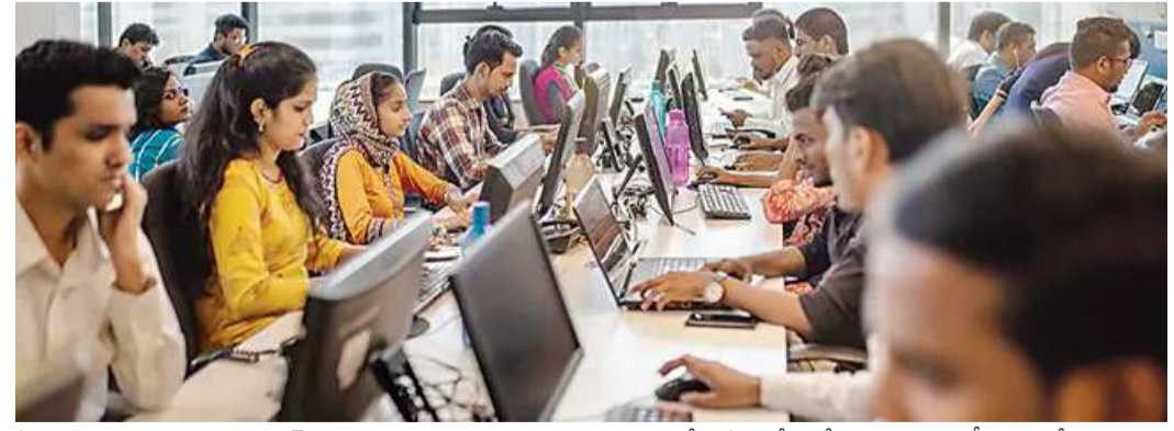
ఏబి ఆదాయాలు 1012 బిలియన్ డాలర్ల (సుమారు రూ.90,000 1,08,000 కోట్లు) మేర ఉండొచ్చని నాసికామ్ అంచనా వేసింది. అన్ని కంపెనీలూ ఏబి ఆదాయాలను వెల్లడించలేదన్నారు. సాధారణంగా అమెరికా నుంచి మనకు పనికింకాని ఉద్యోగులను వెళ్లించడం, అయితే ఈసారి అమెరికా పనిశీల్. మధ్య ప్రాచ్య ప్రాంతాల వేగవంతమైన వృద్ధిని నమోదుచేతాయని నందియార్ పేర్కొన్నారు. దేశీయంగా ఐటీ కంపెనీలకు ఆదాయం 202526లో 7.9% వృద్ధి చెందింది. ఇది ప్రపంచ స్థాయి సగటు కంటే అధికం. రంగం వారిగా మాస్టర్ ఆఫ్ నెట్వర్క్, పర్యాటక, రవాణా రంగాల్లో అధిక వృద్ధి కనిపిస్తోంది.

అనిల్ అంబానీ నివాసం అటాచ్ చేసిన ఈడీ రిలయన్స్ గ్రూప్ చైర్మన్ అనిల్ అంబానీ (Anil Ambani)కి చెందిన ముంబయి నివాసం 'అబ్డే'ను ఈడీ అధికారులు అటాచ్ చేశారు. మనీలాండరింగ్ నిరోధక చట్టం (PMLA) కింద ఈ చర్యలు తీసుకున్నట్లు అధికారిక వర్గాలు వెల్లడించాయి. 17 అంతస్తులతో 66 మీటర్ల ఎత్తున్న ఈ నివాసంపై అరెస్టులు జరిగాయి. ముంబయిలోని పాలి హిల్ ప్రాంతంలో ఉంది. దీని విలువ సుమారు రూ.3,716 కోట్లు ఉంటుందని అంచనా. అనిల్ గ్రూప్ కంపెనీలు కోట్ల రూపాయల బ్యాంకు రుణాల మోసానికి పాల్పడినట్లు ఆరోపణలు ఉన్నాయి. రిలయన్స్ కమ్యూనికేషన్స్ (RCOM)లో సంబంధం ఉన్న కేసులో భాగంగా ఆ ఇంటిని ఈడీ అటాచ్ చేసినట్లు సంబంధిత వర్గాలు తెలిపాయి. దీంతో ఈ కేసులో ఇప్పటివరకు అటాచ్ చేసిన ఆస్తుల విలువ దాదాపు రూ.15,700 కోట్లకు చేరుకుంది. మరోవైపు.. ఈ నెల 26న విచారణకు హాజరు కావాలిందిగా అనిల్ అంబానీకి ఈడీ (Enforcement