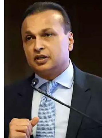
రిలయన్స్ గ్రూప్ చైర్మన్ అనిల్ అంబానీ (Anil Ambani)కి చెందిన ముంబయి నివాసం 'అబ్డే'ను ఈడీ అధికారులు అటాచ్ చేశారు. మనీలాండరింగ్ నిరోధక చట్టం (PMLA) కింద ఈ చర్యలు తీసుకున్నట్లు అధికారిక వర్గాలు వెల్లడించాయి.

అనిల్ అంబానీ నివాసం అటాచ్ చేసిన ఈడీ రిలయన్స్ గ్రూప్ చైర్మన్ అనిల్ అంబానీ (Anil Ambani)కి చెందిన ముంబయి నివాసం 'అబ్డే'ను ఈడీ అధికారులు అటాచ్ చేశారు. మనీలాండరింగ్ నిరోధక చట్టం (PMLA) కింద ఈ చర్యలు తీసుకున్నట్లు అధికారిక వర్గాలు వెల్లడించాయి. 17 అంతస్తులతో 66 మీటర్ల ఎత్తున్న ఈ నివాసంపై అరెస్టులు జరిగాయి. ముంబయిలోని పాలి హిల్ ప్రాంతంలో ఉంది. దీని విలువ సుమారు రూ.3,716 కోట్లు ఉంటుందని అంచనా. అనిల్ గ్రూప్ కంపెనీలు కోట్ల రూపాయల బ్యాంకు రుణాల మోసానికి పాల్పడినట్లు ఆరోపణలు ఉన్నాయి. రిలయన్స్ కమ్యూనికేషన్స్ (RCOM)లో సంబంధం ఉన్న కేసులో భాగంగా ఆ ఇంటిని ఈడీ అటాచ్ చేసినట్లు సంబంధిత వర్గాలు తెలిపాయి. దీంతో ఈ కేసులో ఇప్పటివరకు అటాచ్ చేసిన ఆస్తుల విలువ దాదాపు రూ.15,700 కోట్లకు చేరుకుంది. మరోవైపు.. ఈ నెల 26న విచారణకు హాజరు కావాలిందిగా అనిల్ అంబానీకి ఈడీ (Enforcement