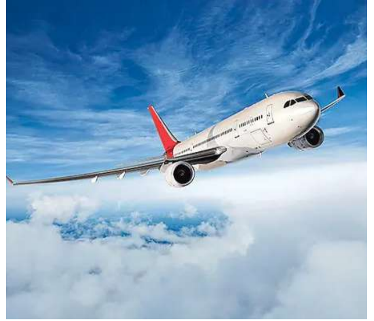
కుల రద్దీ 68% పెరిగి 17.5 17.9 కోట్ల మందికి చేరాల్సి వెల్లడించింది. అంతర్జాతీయ విమాన ప్రయాణికుల రద్దీలో అంచనా వేయగా, ప్రస్తుతం 03 శాతానికి ఇక్రా తగ్గించింది. పాతావరణ ప్రతికూలతలు, 2025 జూన్లో విమానం కూలిన ఘటన, డిమాండ్లో ఇండిగో సర్వీసుల రద్దు పరిణామాలు ఇందుకు కారణమవుతాయని వివరించింది. 202627లో దేశీయ విమాన ప్రయాణి