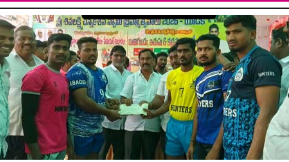
రెండవ బహుమతి గెలుచుకున్న పాపిలి జట్టుకు నగదు అందుకుంటున్న దృశ్యం