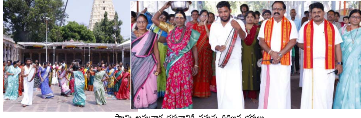
స్వామి అమ్మవార్ల దర్శనానికి వస్తున్న గిరిజన భక్తులు

గ్రామోత్సవంలో ప్రత్యేకంగా చెంచుల సంప్రదాయ నృత్యాలు ప్రదర్శిస్తుంటారు. లాగే సంక్రాంతి బ్రహ్మోత్సవాలలో దివ్య కల్పాణ మహోత్సవానికి చెంచు భక్తులను ప్రత్యేకంగా ఆహ్వానిస్తుంటారు. శ్రీస్వామివారి ఉచిత స్వర్ణదర్శనానికి చెంచుగిరిజన భక్తులను ఎంపిక చేయడంలో స్థానిక ఐ.టి.డి.ఎ ప్రాజెక్టు అధికారి వారి సహకారాన్ని తీసుకుంటున్నారన్నారు. ఈ కార్యక్రమంలో దేవస్థానం అధికారులు, సిబ్బంది పాల్గొన్నారు.