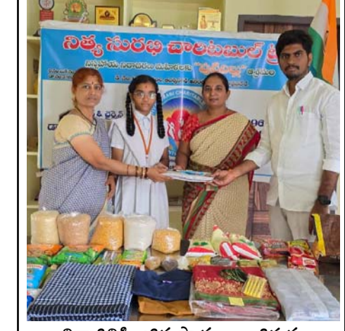
విద్యార్థిని ఆర్థిక సాయం అందిస్తున్న నిత్యసురభి ట్రస్టు సభ్యులు