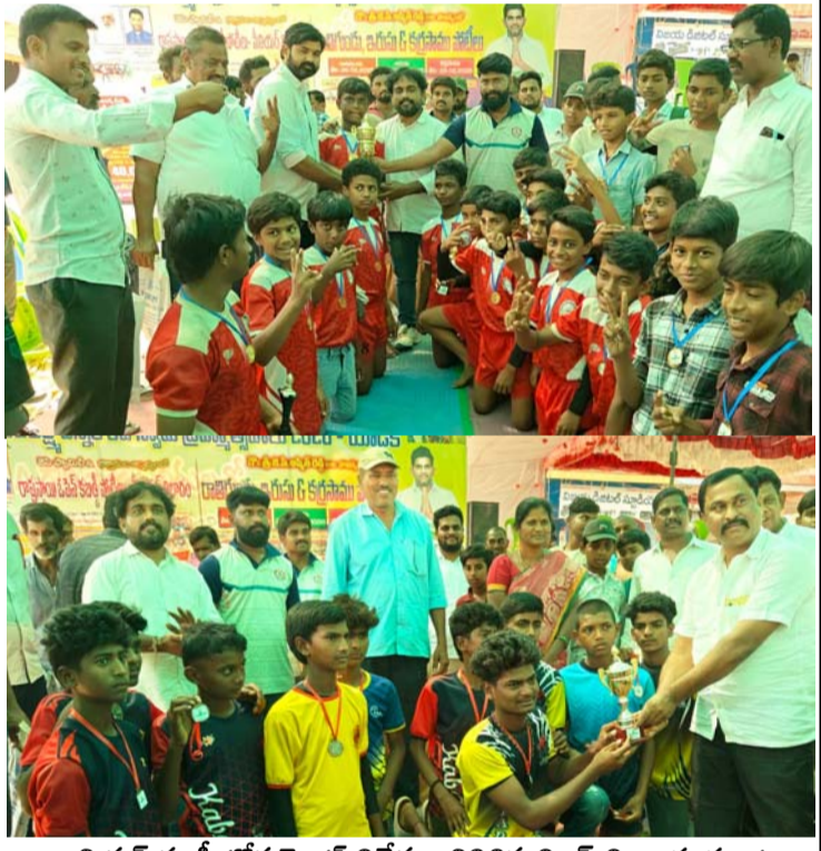
జూనియర్ కబడ్డీ టోర్నమెంట్ విజేతగా నిలిచిన విజన్ విద్యా సంస్థ జట్టు

శ్రీ లక్ష్మీ చెన్నకేశవ స్వామి బ్రహ్మోత్సవాల సందర్భంగా నిర్వహించిన జూనియర్స్ కబడ్డీ టోర్నమెంట్ నందు యాడికి పట్టణానికి చెందిన విజన్ ఇంగ్లీష్ మీడియం హై స్కూల్ జట్టు రామం చెరువు జిల్లా పరిషత్ ఉన్నత పాఠశాల పై విజయం సాధించి ట్రోఫీని కైవసం చేసుకోవడం జరిగింది. వీరికి స్టార్ పారడైజ్ యాజమాన్యం వారు బహుమతులను మరియు మెడల్స్ ని ప్రధానం చేశారు అలాగే ఈ టోర్నమెంట్లో జైస్ రైతుల శ్రీరంగ జెస్ డిపెండెంట్ గా గజేష్ ఎంపికయ్యారు. పిల్లల్ని ఆధారం చేసుకుని గ్రామ పెద్దలు గ్రామ ప్రజలు ఉత్తేజపరిచారు వీరి ఆల తీరు చాలామందిని మంత్రముగ్ధుల్ని చేసింది భవిష్యత్తు తరచి వీరు మంది కబడ్డీ క్రీడాకారులుగా తయారవుతారని అందరూ చర్చించుకున్నారు.. ఈ టోర్చుమెంట్లు ఘనంగా నిర్వహించినందుకు కమిటీ వారికి ప్రజలు ప్రత్యేక కృతజ్ఞతలు తెలిపారు వీరిని విజన్ విద్యాసంస్థల యాజమాన్యం ప్రత్యేకంగా ఆఫీసరించింది.