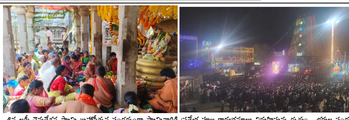
శివ లక్ష్మి చెన్నకేశవ స్వామి బ్రహ్మోత్సవ సందర్భంగా స్వామివారికి ప్రత్యేక పూజ కార్యక్రమాలు నిర్వహిస్తున్న దృశ్యం. భక్తుల సందడి