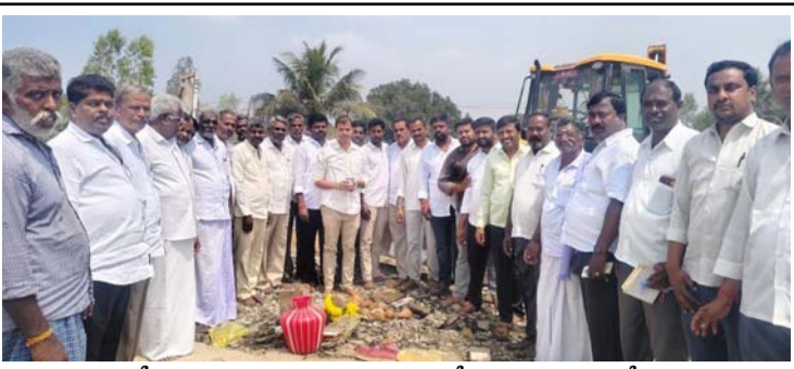
రోడ్డు నిర్మాణానికి భూమి పూజ చేస్తున్న కూటమి నేతలు