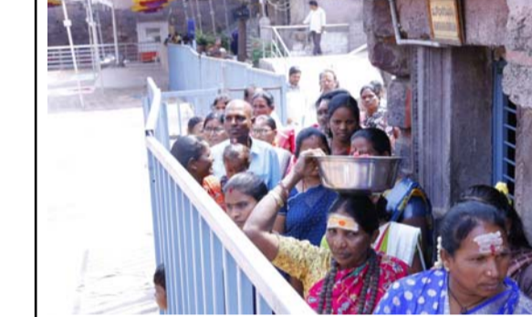
స్వామి అమ్మవార్ల దర్శనానికి వస్తున్న గిరిజన భక్తులు