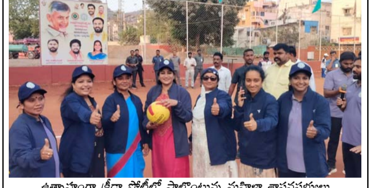
ఉత్సాహంగా క్రీడా పోటీల్లో పాల్గొంటున్న మహిళా శాసనసభ్యులు

రొళ్ల (తెలుగోడు), ఫిబ్రవరి 24 : రోళ్ల మండలం అవనికంట గ్రామ పరిధిలోని టోర్ బావులపై రైతులు రబీలో సాగుచేసిన పంటలను వ్యవసాయ అధికారి వెంకట బ్రహ్మం బుధవారం పరిశీలించారు. రైతులు సాగుచేసిన రాగి,వేరుశనగ పంటల్లో అధిక దిగుబడి ఉంటుందని తీసుకోవలసిన జాగ్రత్తలను వివరించారు.వేరుశనగ పంట పరిశీలించి అకుమచ్చ తెగులు గుర్తించారు. నివారణ కు ఎక్కువగా 5 శాతం ఎస్ సి 2ఎం ఎల్ 2ఓ లీటర్ నీటిలో కలిపి పిచికారీ చేసుకోవాలని సూచించారు.