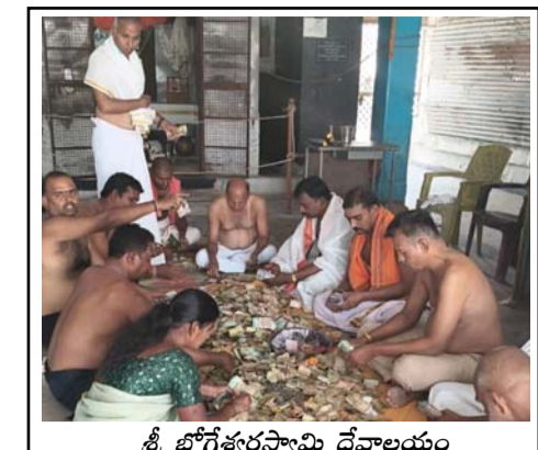
శ్రీ భోగేశ్వరస్వామి దేవాలయం హుందీ లెక్కిస్తున్న దృశ్యం