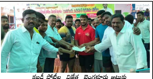
కబడ్డీ టోర్నమెంట్ విజేత బెంగళూరు జట్టుకు 50 వేల రూపాయల నగదు అందిస్తున్న దృశ్యం