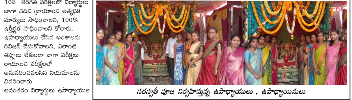
సరస్వతీ పూజ నిర్వహిస్తున్న ఉపాధ్యాయులు, ఉపాధ్యాయులు