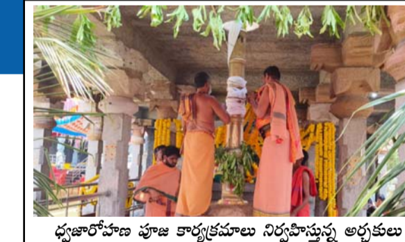
ధ్వజారోహణ పూజ కార్యక్రమాలు నిర్వహిస్తున్న అర్చకులు