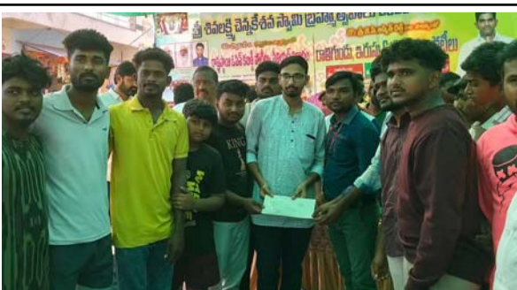
మూడవ బహుమతి గెలుచుకున్న జట్టు తమిళనాడు జట్టు నకదు అందుకుంటున్న దృశ్యం. 4 వ విజేతగా యాడికి జట్టు నగదు బహుమతి