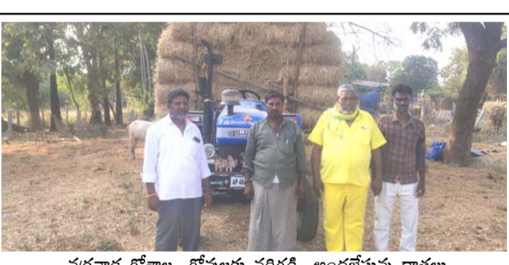
నరసాద గోశాల గోవులకు పరిగడ్డి అందజేస్తున్న దాతలు