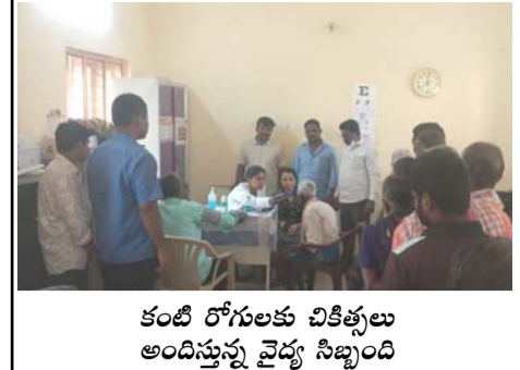
కంటి రోగులకు చికిత్సలు అందిస్తున్న వైద్య సిబ్బంది