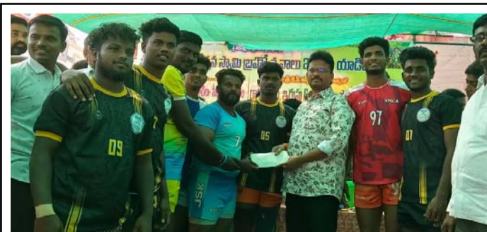
మూడవ బహుమతి గెలుచుకున్న జట్టు తమిళనాడు జట్టు నకదు అందుకుంటున్న దృశ్యం. 4 వ విజేతగా యాడికి జట్టు నగదు బహుమతి