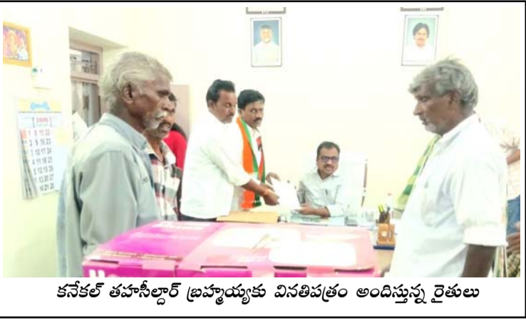
కనెక్ట్ తహసీల్దార్ బ్రహ్మయ్యకు వినతిపత్రం అందిస్తున్న రైతులు