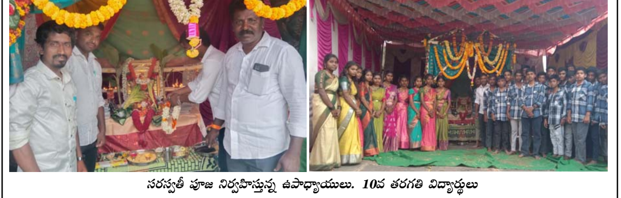
సరస్వతీ పూజ నిర్వహిస్తున్న ఉపాధ్యాయులు. 10వ తరగతి విద్యార్థులు