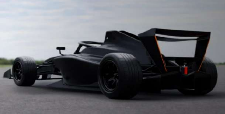
అమెరికా స్ట్రాట్ కంపెనీ రెన్ ఫోర్మూలా ఆర్ ఎంబిఎల్ రంగంలో విస్తూర్ణ డిజైన్ తో 2.8 సెకన్లలో 0-96 కి.మీ. వరకు వేగం చేసింది. ఫార్ములా 1 రేసింగ్ కారు తరహాలో

రాన్ని బట్టి 4 వీలర్ గా కన్స్ట్రక్ట్ చేసుకోవచ్చని కంపెనీ చెబుతోంది. ఇందులో సుజుకీ హయామిని 1,340 సీసీ ఫోర్ సిలిండర్ ఇంజిన్ అమర్చారు. ఇది 10,500 rpm వద్ద 210 hp, 9,800 rpm వద్ద 163 Nm టార్క్ ను విడుదల చేస్తుంది. సిక్స్ స్పీడ్ ట్రాన్స్ మిషన్ తో వస్తోంది. దీని బరువు 517 కిలోలు. పైబెర్గాస్ బాడీతో వస్తోంది. ఇది 2.8 సెకన్లలోనే 0-96 కిలోమీటర్ల వేగాన్ని అందుకుంటుంది. ఎస్పీ3 జేస్ మోడల్ 78,499 డాలర్లుగా కంపెనీ నిర్ణయించింది. అంటే దేశీయ కరెన్సీ ప్రకారం రూ. 73.72 లక్షల నుంచి ప్రారంభమవుతుంది. టర్కీ చార్జింగ్ మోడల్ ధర లక్ష డాలర్లుగా కంపెనీ నిర్ణయించింది. అంటే దీని ధర రూ. 95.32 లక్షలుగా ఉంటుంది. ఎర్లెయోక్స్ డెలివరీలను ఈ ఏడాది నవంబరులో, వచ్చే ఏడాది లాంచ్ ఎడిషన్ తీసుకొస్తారు.