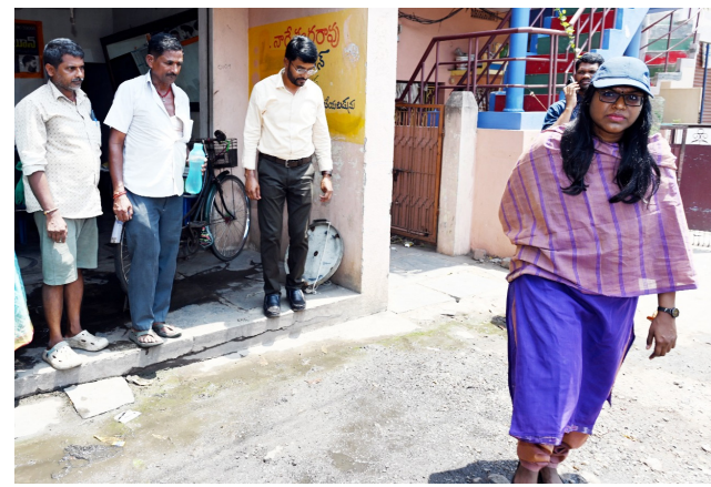
పలూరు/కైకలూరు, మే 25(మనసులో మాట)

కైకలూరు నియోజకవర్గం పర్యటనలో భాగంగా సోమవారం బైపాస్ రోడ్డు గంగానమ్మ గుడివద్ద రోడ్లమీద చెత్త ఉండడం చూసి వెంటనే కారుదిగి ఇంటింటికి వెళ్లి రోడ్లమీద చెత్త ఎవ్వరూ వేశారని, ఇలా వెయ్యడం వలన పరిసరాలు పరిశుభ్రత లేకపోతే మనకు అంటు రోగాలు వస్తాయని జిల్లా కలెక్టరు