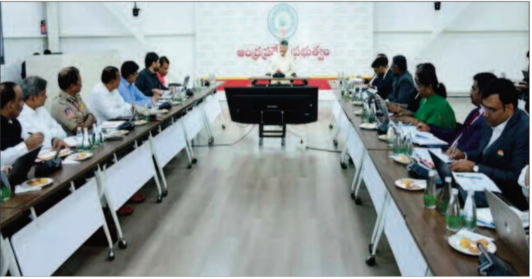
ఇచ్చి, నిరంతర పర్యవేక్షణ ద్వారా వారిని టెక్నాలజీ వైపు మళ్లించాలని సూచించారు.

అమరావతి, జనవరి 26: సాంకేతికత అంటే కేవలం సౌకర్యం కాదు.. అది పారదర్శకమైన, వేగవంతమైన పాలనకు ఒక శక్తివంతమైన ఆయుధం అని ఆంధ్రప్రదేశ్ ముఖ్యమంత్రి నారా చంద్రబాబు నాయుడు స్పష్టం చేశారు. సోమవారం క్యాంపు కార్యాలయంలో రియల్ టైమ్ గవర్నెన్స్ సాఫ్ట్వేర్ నిర్వహించిన ఉన్నత స్థాయి సమీక్షలో ఆయన పాలనా యంత్రాంగానికి సరికొత్త దిశానిర్దేశం చేశారు. 2026 సంవత్సరాన్ని 'టెక్నాలజీ డ్రైవెన్ డిసిఎన్ మేకింగ్ ఇయర్' (సాంకేతిక ఆధారిత నిర్ణయాల సంవత్సరం) గా ప్రకటించిన ముఖ్యమంత్రి, ఆర్టిజిఎన్పై ఇంటిలిజెన్స్ పాత్రను పెంచాలని అధికారులను సీఎం ఆదేశించారు. ఏబిని సమర్థంగా వినియోగించడం ద్వారా ప్రజల నుంచి వచ్చే ఫిర్యాదులను మానవ ప్రయత్నం లేకుండా, అత్యంత వేగంగా మరియి కచ్చితత్వంతో పరిష్కరించవచ్చని ఆయన తెలిపారు. పనితీరులో లోపాలన్న ఉద్యోగులకు అధునాతన శిక్షణ