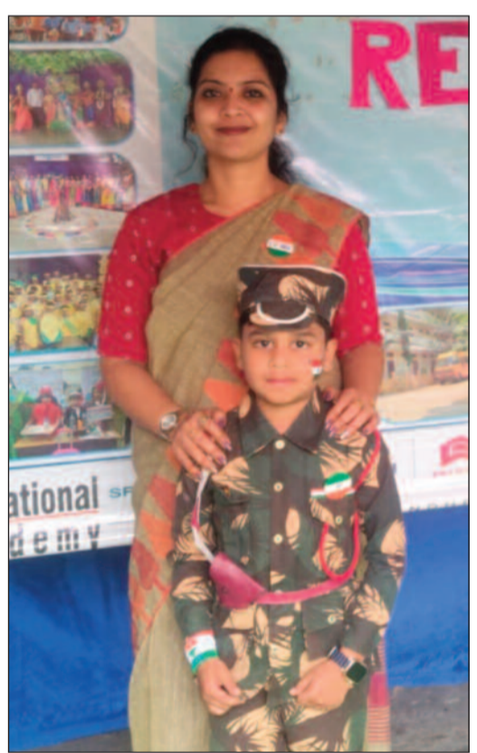
సమయం న్యూస్, కరీంనగర్: స్థానిక అశోక నగర్లోని ఎస్ఆర్ డిజి స్కూల్లో 77వ గణతంత్ర దినోత్సవ వేడుకలు సోమవారం అత్యంత వైభవంగా నిర్వహించారు. పాఠశాల ప్రాంగణంలో ఏర్పాటు చేసిన జాతీయ పతాకాన్ని