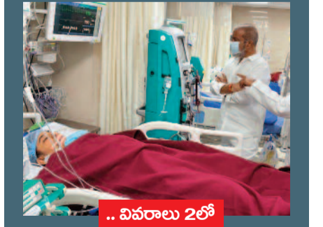
.. వివరాలు 2లో

నిజామాబాద్ దాడి ఘటన దారుణం ఎక్స్ ప్లెజ్ కాన్పిట్టెబల్ ను పరామర్శించిన దామోదర దాడికి కారకులను వదిలిపెట్టింది లేదన్న మంత్రి