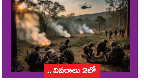
.. వివరాలు 2లో

■ పదిమంది భద్రతా సిబ్బందికి తీవ్ర గాయాలు