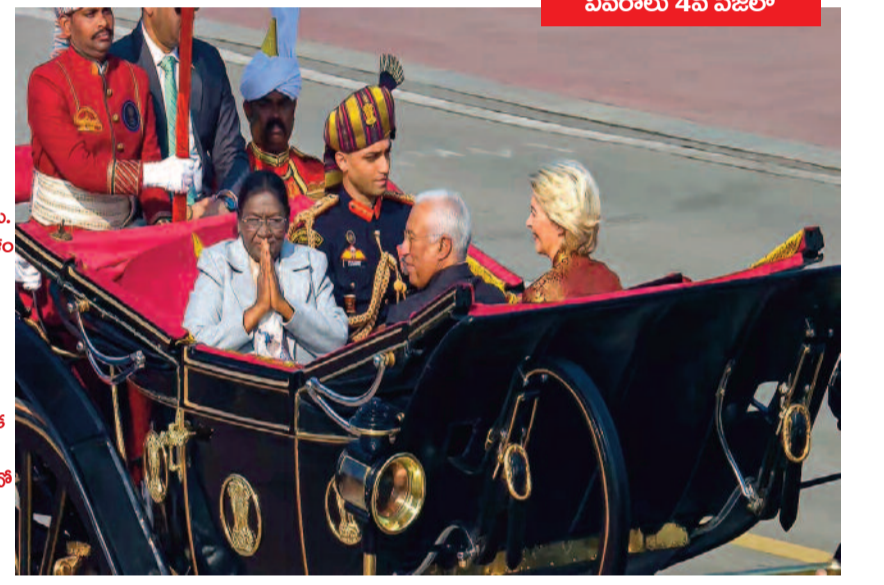
వివరాలు 4వ పేజీలో

దేశ రాజధాని దిల్లీలో గణతంత్ర వేడుకలు అంబరాన్నింటాయి. ఉదయం 10.30 గంటలకు కర్ణాటకలో రాష్ట్రపతి ద్రాపబీ ముర్ము జాతీయ జెండాను ఆవిష్కరించారు. అనంతరం సైనిక దళాల కవాతు ప్రారంభమైంది. అపారితో పాటు ప్రచండ తేలికపాటి హారికాస్టర్ విన్యాసాలు ఆకట్టుకున్నాయి. పోరులో ధరించే దుస్తులతో అశ్విక దళం తొలిసారి ఈ పరేడ్లో పాల్గొంది. ఇరవే పా సమాఖ్యకు చెందిన సైనిక విభాగం కూడా ప్రదర్శనలిచ్చింది. దేశ అభివృద్ధి ప్రస్థానం, సాంస్కృతిక వైవిధ్యం, సైనిక బలం, ఆపరేషన్ సిందూర్లో వాడిన ప్రధాన ఆయుధ వ్యవస్థలు పంటిపి ప్రత్యేక ఆకర్షణగా నిలిచాయి. ఈ వేడు కలకు యూరోపియన్ కౌన్సిల్ అధ్యక్షుడు ఆంటోనియో కోస్టా, ఇరోపా కమిషన్ అధ్యక్షురాలు ఉర్బలా వాన్డెర్ లేయన్ ముఖ్య అతిథులుగా హాజరయ్యారు.