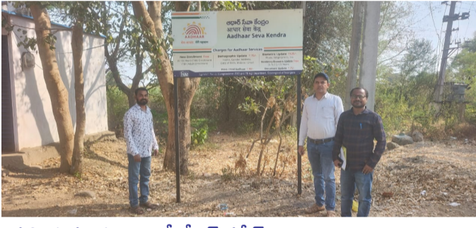
స్పష్టంగా ఆదేశించారు. సేవల విషయంలో ఎలాంటి నిర్లక్ష్యం, అలస్యం జరగకుండా చూడాలని, ప్రతి దరఖాస్తును సమయానికి పరిష్కరించాలని సూచించారు. అలాగే, ఈఎన్డీ కార్యాలయం నిర్దేశించిన మార్గదర్శకాలను ఖచ్చితంగా పాటిస్తూ ప్రజలకు నాణ్యమైన సేవలు అందించాలని అధికారులకు తెలిపారు. కేంద్రాల్లో పారదర్శక ఉండేలా అవసరమైన సూచనలు ఇచ్చారు. మీసేవా కేంద్రాల్లో ప్రజలకు ఏమైనా ఉల్లంఘనలు కనుగొనబడిన వక్షంలో ఈఎన్డీ నిబంధనల ప్రకారం చర్యలు తీసుకుంటామని స్పష్టం చేశారు.