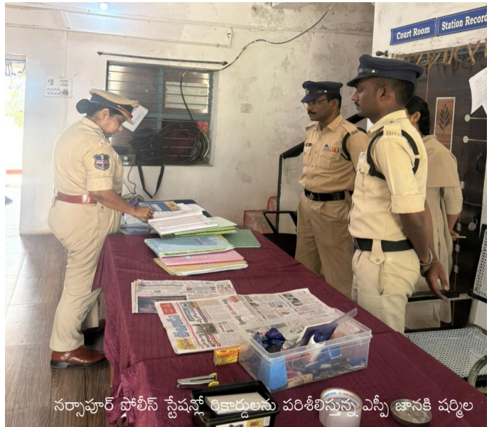
నర్సాపూర్ పోలీస్ స్టేషన్లో రికార్డులను పరిశీలిస్తున్న ఎస్సీ జానకి పర్వల

నిర్మల్ జిల్లా, నర్సాపూర్ జి మార్చి 26 అమృత తెలంగాణ నర్సాపూర్ జి మండల కేంద్రంలోని పోలీస్ స్టేషన్ ను గురువారం జిల్లా ఎస్సీ జానకి పర్వల, ఆకస్మికంగా తనిఖీ చేశారు. ఈ సందర్భంగా రికార్డులు పరిశీలించి, సిబ్బందికి పలు సూచనలు ఇచ్చారు. సమస్యలను అడిగి తెలుసుకున్నారు. శాంతి భద్రతల పరిరక్షణలో పోలీసులు కనబరుస్తున్న చొరవపై ఆమె సంతృప్తి వ్యక్తం చేశారు. పోలీస్ సిబ్బందితో ఆమె శాంతి భద్రతల విషయంలో తగు సూచనలు, సలహాలు ఇచ్చారు. ఎస్సీ గణేష్ పోలీస్ సిబ్బంది ఉన్నారు