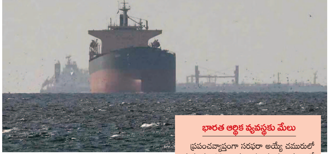
భారత ఆర్థిక వ్యవస్థకు మేలు

ప్రపంచవ్యాప్తంగా సరఫరా అయ్యే చమురులో సుమారు 20 శాతం ఈ మార్గం గుండానే వెళ్తుంది. జలసంధి పునరుద్ధరణతో అంతర్జాతీయ మార్కెట్లో ఇంధన ధరలు స్థిరపడే అవకాశం ఉంది. ముఖ్యంగా భారత్కు చమురు దిగుమతులు సులభతరం కావడంతో పాటు ఎగుమతి రంగంపై ఉన్న ఒత్తిడి కూడా తగ్గుతుంది. ఈ నిర్ణయం పట్ల అంతర్జాతీయ వాణిజ్య వర్గాలు హర్షం వ్యక్తం చేస్తున్నాయి.