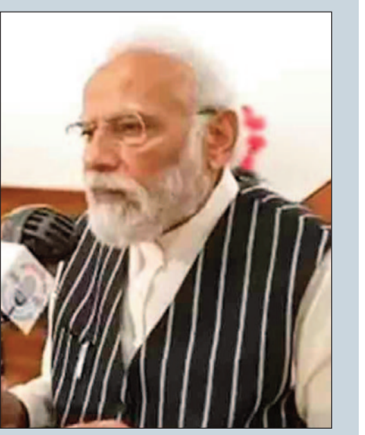
తాజా పరిస్థితులపై ప్రధాని మోడీ దేశ ప్రజలను ఉద్దేశించి కీలక ప్రకటన చేసే అవకాశం ఉందని రాజకీయ వర్గాలు భావిస్తున్నాయి. యుద్ధం వల్ల తలెత్తే ఆర్థిక భారానికి సంబంధించి ధరల స్థిరీకరణ నిధి వినియోగంపై కూడా ఈ సమావేశంలో స్పష్టత వచ్చే అవకాశం ఉంది.

నిత్యావసరాల ధరల స్థిరీకరణ మరియు విదేశాల్లో చిక్కుకున్న భారతీయుల రక్షణే ప్రధాన అజెండాగా ఈ సమావేశం సాగనుంది. యుద్ధం వల్ల చమురు కొరత ఎర్పడుతున్నాడని తగిన ప్రణాళికలు రూపొందించడం, సరఫరా మార్గాలను సురక్షితంగా ఉంచడం వంటి అంశాలపై ప్రధాని రాష్ట్రాలకు దిశానిర్దేశం చేయనున్నారు. అంతర్జాతీయ పరిణామాలు ఎలా ఉన్నా స్థానికంగా ఆర్థిక స్థిరత్వాన్ని కాపాడుకోవాలని, కేంద్ర-రాష్ట్రాల 'టీమ్' ఇండియాగా ఐక్యంగా ఉండి ఏలాంటి అత్యవసర పరిస్థితివైనా ఎదుర్కోవడానికి సిద్ధంగా ఉండాలని మోడీ పిలుపునివ్వనున్నారు. ప్రధానంగా చమురు భద్రత (సాఫ్టీ రాపెషిటివ్) విషయంలో రాష్ట్రాల తీసుకోవాల్సిన ముందస్తు జాగ్రత్తలపై చర్చించనున్నారు.