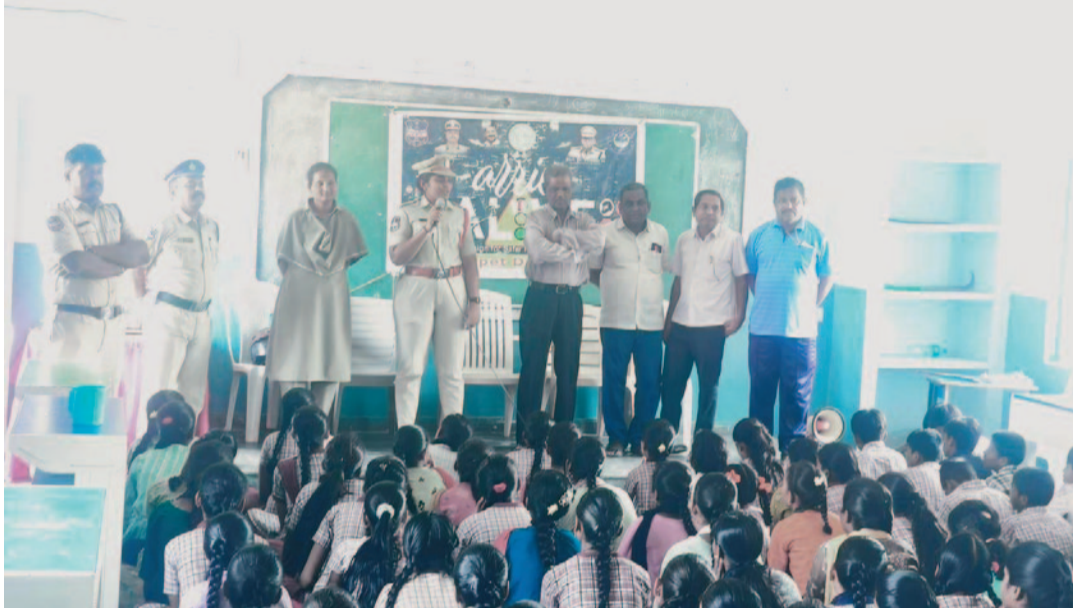
ద్వారా ప్రతి ఒక్కరూ రోడ్డు భద్రత నియమాలు తప్పనిసరిగా పాటించి, సురక్షిత ప్రయాణాన్ని అలవర్చుకోవాలని విద్యార్థులచే ప్రతిజ్ఞ చేయించడం జరిగింది. ఈ కార్యక్రమంలో పాఠశాల యాజమాన్యం, ఉపాధ్యాయులు, విద్యార్థులు పాల్గొన్నారు.