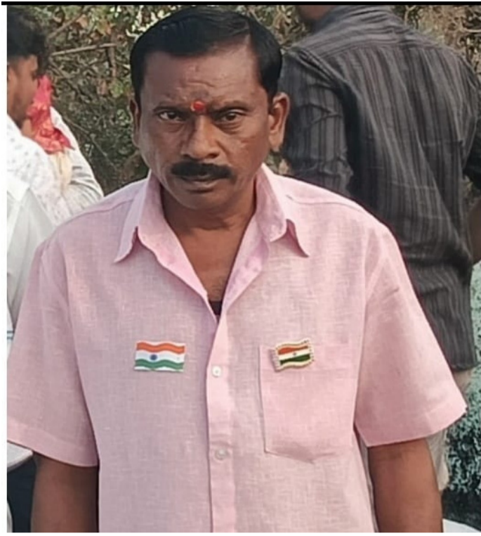
కెనాల్ లో పడిన మృతుడి ఫైల్ ఫోటో