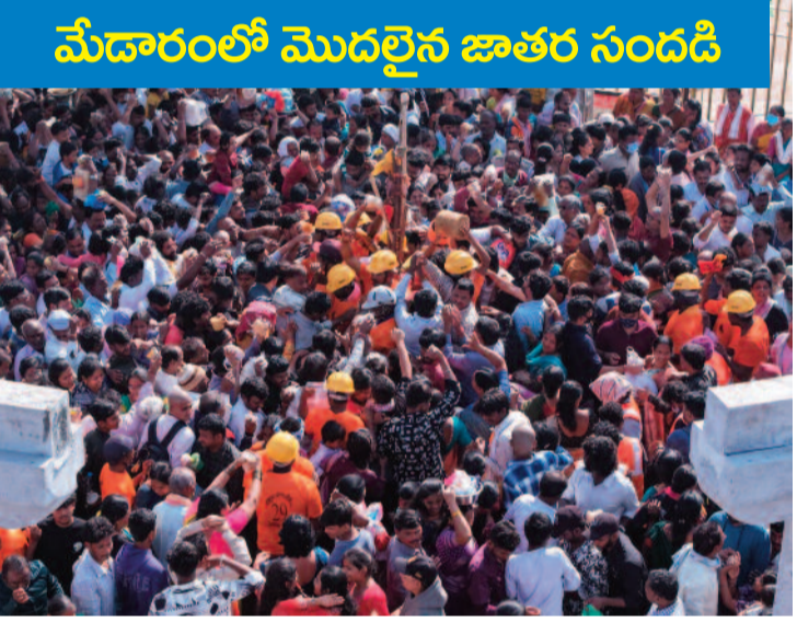
మేడారంలో మొదలైన జాతర సందడి

పగిడిద్దరాజు, జంపన్నలను చేర్చే ఘట్టం ప్రారంభం రేపు గద్దెనెక్కనున్న సమ్మక్క జనసంద్రంగా మేడారం పరిసరాలు జాతర నిర్వహణకు విస్తృత ఏర్పాట్లు