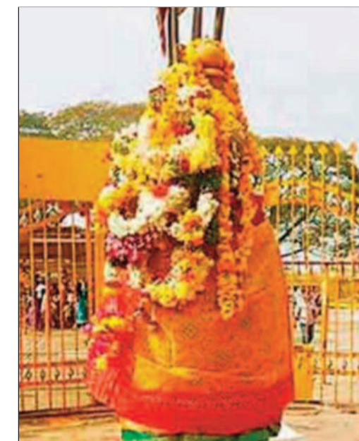
చేరుకుంటారు. గుడెలపై పగిడిద్దరాజును ప్రతిష్ఠించడంతో మహాజాతర మొదటి ఘట్టం మొదలవుతుంది.