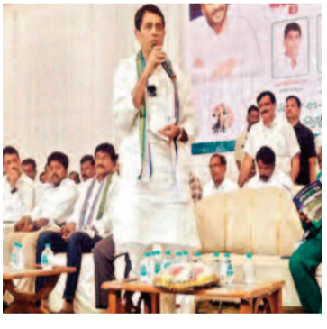
మాజీ మంత్రి బుగ్గన రాజేంద్రనాథ్ రెడ్డి

బుగ్గన రాజేంద్రనాథ్ రెడ్డి హాజరయ్యారు. ఈ సందర్భంగా మాజీ మంత్రి బుగ్గన మాట్లాడుతూ పండించిన పంటలకు గిట్టుబాటు ధర లేక రైతులు అల్లాడుతున్నా ప్రభుత్వానికి చీమకుట్టినట్లుగా కూడా లేదని ఆరోపించారు. గత ప్రభుత్వంలో తమ అధినేత వైఎస్ జగన్మోహన్ రెడ్డి మెడికల్ కాలేజీలను నిర్మిస్తే కూటమి ప్రభుత్వం వాటి ప్రయత్నిస్తుందని విమర్శించారు.