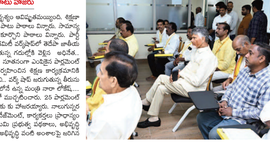
అమరావతి, జనవరి 27: టిడిపి కార్యాలయంలో అరుదైన దృశ్యం ఆవిష్కృతమయ్యింది.

అమరావతి, జనవరి 27: టిడిపి కార్యాలయంలో అరుదైన దృశ్యం ఆవిష్కృతమయ్యింది. శిక్షణ తరగతులకు హాజరైన పార్టీ అధినేత చంద్రబాబు అందరితో పాటు పాఠాలు విన్నారు. సామాన్య కార్యకర్తలానే సీఎం చంద్రబాబు పార్టీ శిక్షణ తరగతుల్లో కూర్చోని పాఠాలు విన్నారు. పార్టీ కేంద్ర కార్యాలయం ఎన్టీఆర్ భవన్ లో జరిగిన పార్టీ కమిటీ వర్క్ షాప్ లో తెదేపా జాతీయ అధ్యక్షుడు చంద్రబాబు పాల్గొన్నారు. వర్క్ షాప్ జరుగుతున్న గదుల్లోకి వెళ్లిన అధినేత.. నేతల మధ్య కూర్చోని శిక్షణ తరగతులను ఫాలో అయ్యారు. నూతనంగా ఎంపికైన పార్టీ కమిటీ పార్టీ అధ్యక్షులకు మాజీ మంత్రి పత్తిపాటి పుల్లారావు నిర్వహించిన శిక్షణ కార్యక్రమానికి చంద్రబాబు హాజరయ్యారు. నాయకులు చెప్పేది శ్రద్ధగా విని.. వర్క్ షాప్ జరుగుతున్న తీరును పరిశీలించారు. ఇవాళ ఉదయం నుంచి పార్టీ కార్యాలయంలోనే ఉన్న మంత్రి నారా లోకేశ్... ప్రతి గదిలోకి వెళ్లి వర్క్ షాప్ లోని అన్ని బృందాల సభ్యులతో ముచ్చటించారు. 25 పార్టీ కమిటీలకు సంబంధించి 1050 మంది కమిటీ సభ్యులు వర్క్ షాప్ లకు హాజరయ్యారు. నాలుగున్నర రోజుల పాటి ప్రయాణం, పార్టీ భావజాలం, క్యాండర్ మేనేజ్ మెంట్, కార్యకర్తల ప్రాధాన్యం వంటి అంశాలపై శిక్షణ తరగతులు నిర్వహించారు. కూటమి ప్రభుత్వ పథకాలు, అభివృద్ధి కార్యక్రమాలు, విజన్ ప్రణాళికలు, అన్ని ప్రాంతాల సమగ్ర అభివృద్ధి వంటి అంశాలపై జరిగిన వర్క్ షాప్ లో సీఎం పాల్గొన్నారు.