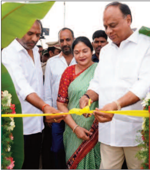
బీసీల అభివృద్ధికి నిరంతరం కృషి చేస్తామని మంత్రి సవిత్ పునరుద్ఘాటించారు. కార్యక్రమంలో బీసీ సంక్షేమ శాఖ కార్యదర్శి ఎస్. సత్యనారాయణ, బీసీ సంక్షేమ శాఖ డైరెక్టర్ మల్లిఖార్జున్, బీసీ పైనాన్స్ కార్యారోపణ చైర్మన్ అనంత కుమారి, తదితరులు పాల్గొన్నారు.

చట్టం అమలుపై చర్చించడంతోపాటు, మేనిఫెస్టోలో ఇచ్చిన హామీల ప్రకారం బీసీలకు అండగా నిలవడం, గతంలో ముఖ్యమంత్రి నారా చంద్రబాబు నాయుడు ప్రవేశపెట్టిన ఆదరణ 1, 2' పథకాల తరహాలోనే, ఇప్పుడు 'ఆదరణ-3' ను ఏ విధంగా సమర్థవంతంగా అమలు చేయాలనే అంశంపై 39 మంది కార్యారోపణ చైర్మన్లతో చర్చించామన్నారు. బీసీలకు 34% రిజర్వేషన్లు, నామినేటెడ్ పోస్టుల్లో రిజర్వేషన్లు కల్పనపై సుదీర్ఘంగా చర్చించామన్నారు. ముఖ్యమంత్రి ఇచ్చిన హామీ మేరకు రాష్ట్రవ్యాప్తంగా బీసీ భవన నిర్మాణానికి ప్రభుత్వం సిద్ధంగా ఉందన్నారు. పీఎం సూర్య ఘోష పథకం కింద బీసీలకు 20,000 రూపాయల అదనపు సబ్సిడీ అందించడం జరుగుతుందన్నారు. ప్రతి బీసీ బిడ్డను ఎంట్రప్రెన్యూర్ (వత్తివజాతీయత) గా చేయడమే ప్రభుత్వ లక్ష్యమన్నారు. డీఎస్సీ అభ్యర్థుల కోసం ప్రతి జిల్లాలో కో-టింగ్ సెంటర్లు ఏర్పాటు, ఇప్పటికే 300 మంది విద్యార్థులు దీని ద్వారా ఎంపిక కావడం విశేషమన్నారు. 'లా ఎక్సలెన్స్ ఐఎస్ అకాడమీ' ద్వారా బీసీ విద్యార్థులకు ఉచిత భోజన, వసతి సౌకర్యాలతో అత్యుత్తమ శిక్షణ సివిల్స్ లో అందిస్తున్నారు. కూటమి ప్రభుత్వం అంటేనే బీసీల ప్రభుత్వం" అని ముఖ్యమంత్రి చంద్రబాబు నాయుడు, పవన్ కళ్యాణ్, మంత్రి లోకేశ్ నాయకత్వంలో