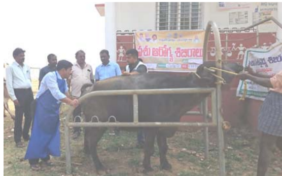
పశువులకు వైద్యం చేస్తున్న అధికారులు