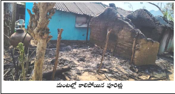
మంటల్లో కాలిపోయిన పూరిట్ల