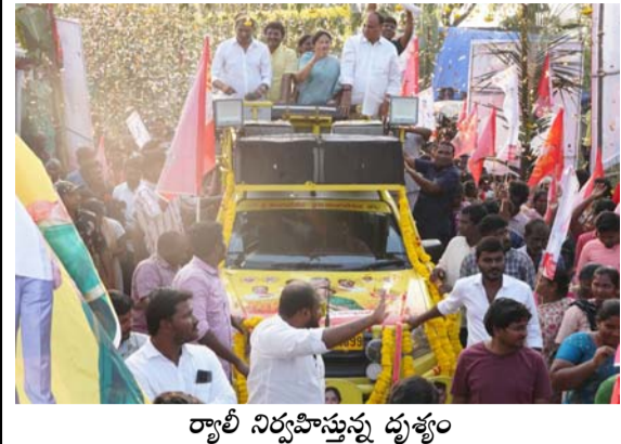
ర్యాలీ నిర్వహిస్తున్న దృశ్యం