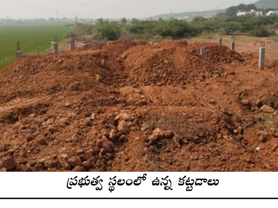
ప్రభుత్వ స్థలంలో ఉన్న కట్టడాలు

అంతకుముందు తహసీల్దార్ ఎస్ హెచ్ రోడ్డుకు సంబంధించిన అధికారులతో మాట్లాడారు. వెంటనే ఆగ్రహం కట్టాలను తొలగించాలని అవసరమైతే తమ సిబ్బంది పోలీస్ బందోబస్తు ఏర్పాటు చేసేందుకు సిద్ధంగా ఉన్నామని వెల్లడించారు. ఈ సందర్భంగా రెవెన్యూ అధికారులు తహసీల్దార్తో మాట్లాడుతూ వాళ్ళని పిలిపించామని వాయిదాలు