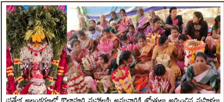
ప్రత్యేక అలంకరణలో కొల్లాపూరి మహాలక్ష్మి అమ్మవారికి జ్యోతులు అర్పించిన మహిళలు

రాళ్ల (తెలంగాణ), జనవరి 27 : మండలంలోని లక్ష్మీనపల్లి గ్రామంలో మంగళవారం రత్నగిరి కొల్లాపూరి మహాలక్ష్మి కి జ్యోతుల ఉత్సవాన్ని ఘనంగా నిర్వహించారు. ఉత్సవ విగ్రహాన్ని రత్నగిరి నుంచి మేళతాలతో వాయిద్యాల సమయం అమ్మవారిని ఊరేగింపుగా లక్ష్మీనపల్లి గ్రామానికి తీసుకెళ్లి పట్టణం కూర్చోపెట్టి ప్రత్యేక పూజలు నిర్వహించారు. ఈ సందర్భంగా మహిళా లు భక్తి శ్రద్ధలతో ఉపవాసదీక్షతో జ్యోతులను ఊరేగింపుగా తీసుకెళ్లి అమ్మవారి చుట్టూ ప్రదక్షిణలు చేసి జ్యోతులను అర్పించి మొక్కులను తీర్చుకొన్నారు.