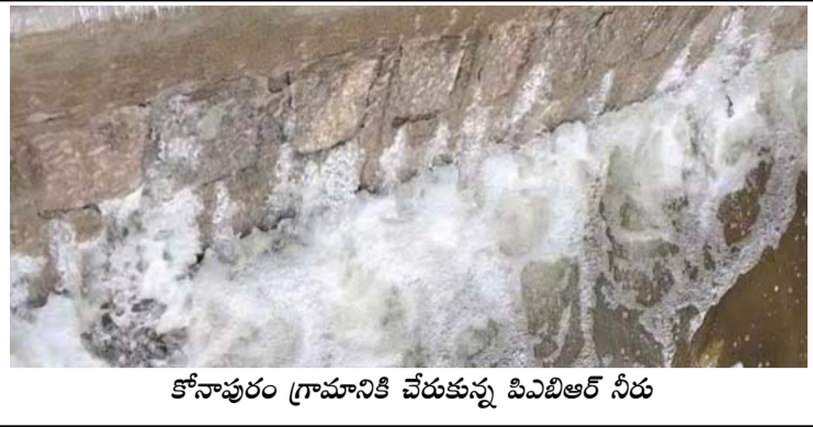
కోనాపురం గ్రామానికి చేరుకున్న పిఎలీఆర్ నీరు