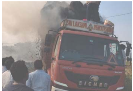
మంటలను అడుపు చేస్తున్న గ్రామస్థులు