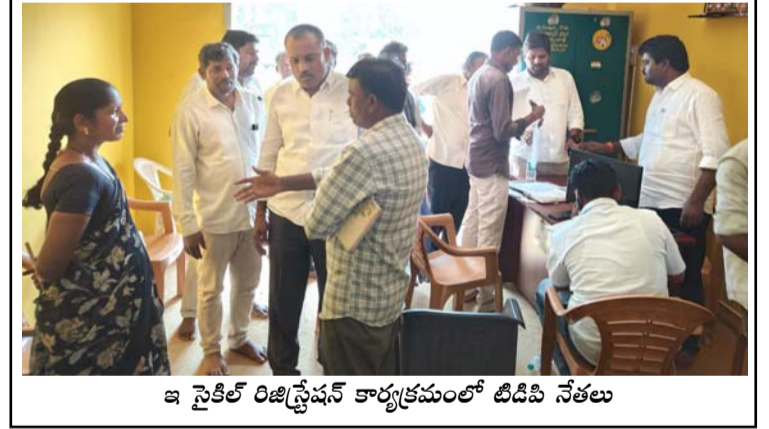
ఇ సైకిల్ రిజిస్ట్రేషన్ కార్యక్రమంలో టిడిపి నేతలు