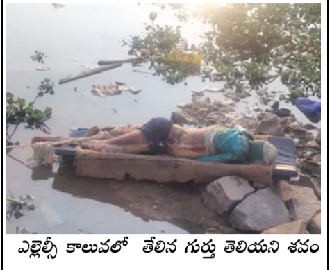
ఎల్లెల్లీ కాలువలో తేలిక గుర్తు తెలియని శవం