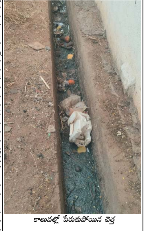
కాలువల్లో పేరుకుపోయిన చెత్త