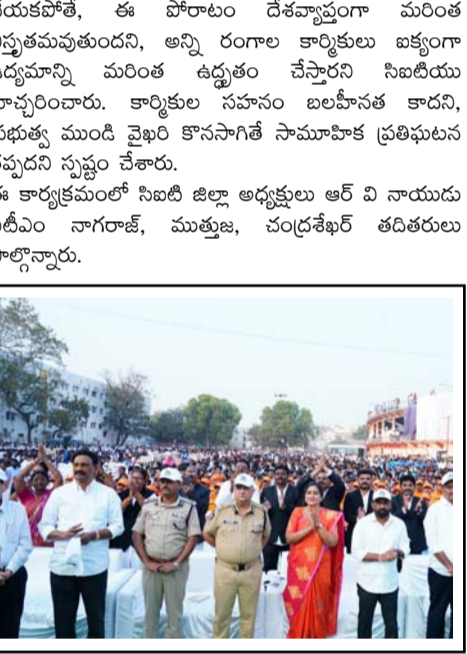
మత్తు పదార్థాల రహిత సమాజమే కూటమి ప్రభుత్వ లక్ష్యం