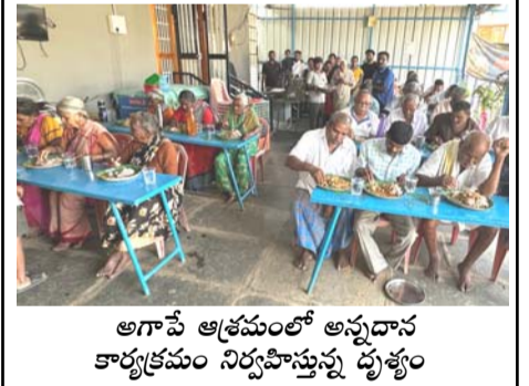
అగాపే ఆశ్రమంలో అన్నదాన కార్యక్రమం నిర్వహిస్తున్న భుజం