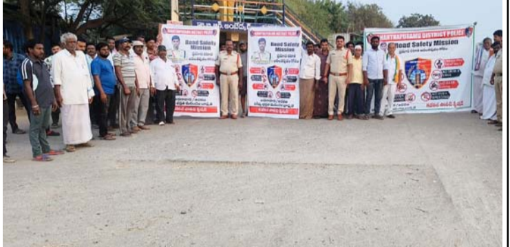
ప్రమాదాలపై ప్రయాణికులకు అవగాహన కల్పిస్తున్న పోలీసులు