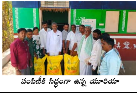
పంపిణీకి సిద్ధంగా ఉన్న యూరియా