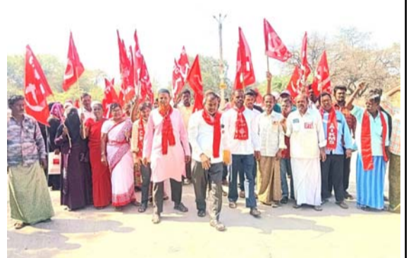
కనకల్లో రా్యతీ నిర్వహిస్తున్న వామపక్ష నాయకులు

కూటమి ప్రభుత్వం ఎన్నికల ముందు ఇచ్చిన హామీ మేరకు పట్టణంలో మూడు సెంటు, గ్రామాల్లో రెండు సెంటు అందించే క్రమంలో నిర్ణయం చేయడానికి వ్యతిరేకంగా కనకల్లో మంగళవారం వామపక్షం ఆధ్వర్యంలో రా్యతీ నిర్వహించారు. రా్యతీ స్థానిక అంబేద్కర్ సర్కిల్ నుండి ఎమ్మార్ కార్యాలయం వరకు నిర్వహించారు. అనంతరం డిప్యూటీ తాసిల్దార్ విశ్వనాథ్ కుమార్ కాంగ్రెస్ పార్టీ అధికారంలో వచ్చిన తర్వాత వామ పక్ష నాయకులు మాట్లాడుతూ కాంగ్రెస్ ప్రభుత్వ హయాంలో ఇంటి స్థలాలు లేని నిరుపేదలకు టౌన్ సర్వే నంబర్ 4041లో అనాటి ఎమ్మార్స్ రెండు సెంటు స్థలం పట్టాలు మంజూరు చేసినట్లు తెలిపారు. అయితే ఆ లేపుట్లలో మౌలిక వసతులైన నీరు, కరెంటు, రోడ్డు లాంటి సౌకర్యం కల్పించకుండా కాంగ్రెస్ ప్రభుత్వం కనుమరుగయ్యిందన్నారు. తరువాత అధికారంలోకి వచ్చిన డి.డి.పీ ప్రభుత్వం కూడా మౌలిక వసతులు కల్పించలేదన్నారు. డి.డి.పీ ప్రభుత్వం సైతం కనుమరుగైందన్నారు. తరువాత డి.డి.పీ కాంగ్రెస్ పార్టీ అధికారంలో వచ్చిన తర్వాత రాష్ట్రంలో ఏ ఒక్కరు ఇంటి స్థలం, ఇల్లు నిర్మాణం లేనివారు ఉండకూడదని చెప్పినా జగన్మోహన్ రెడ్డి అధికారంలో వచ్చాక గత ప్రభుత్వం ఇచ్చిన లేపుట్లపై అధికారులను ఉసిగొలిపి ఆ లేపుట్లలో అధికారుల ద్వారా ఎంక్వయిర్ చేయించి అక్రమంగా ఆ లేపుట్లకు అధికారికంగా ఇచ్చిన పట్టాలను రద్దు చేశారన్నారు. అధికారుల ద్వారా చెప్పించి పేదలను భయపెట్టేటటువంటి గురి చేసే వారికి ఇచ్చిన ఇంటి స్థలాలు లాక్కున్నారు.. ఇచ్చిన హామీని జగన్ కాలనీగా పేరు వట్టి వారు