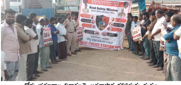
రోడ్డు ప్రమాదాల నివారణపై అవగాహన కల్పిస్తున్న భుజం