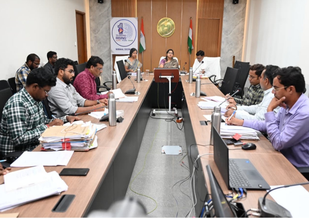
సంబంధిత అధికారులతో సమావేశమైన జిల్లా కలెక్టర్