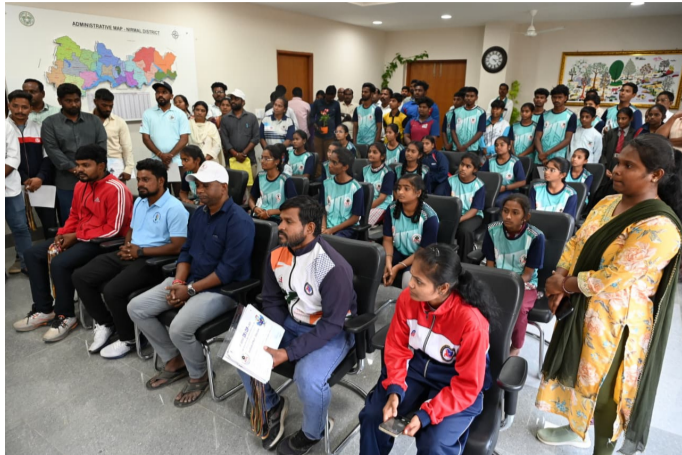
విద్యార్థులను సన్మానించిన జిల్లా కలెక్టర్