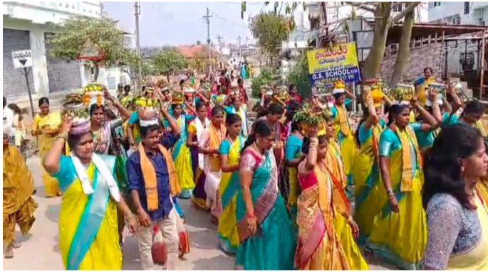
గంగమ్మ వద్దకు బోనాలతో బయలుదేరిన గంగపుత్రులు

నిర్మల్ నర్సాపూర్ (జి) ఫిబ్రవరి 27 అమృత తెలంగాణ నర్సాపూర్ జి మండల కేంద్రంలో నిర్వహించిన గంగామాత బోనాల ఉత్సవాలు భక్తిభావంతో పాటు ఆత్మీయతను పంచాయి. ఈ వేడుకల్లో గంగపుత్ర కులస్తుల పుట్టింటి ఆడపడుచులే ప్రధాన ఆకర్షణగా నిలిచారు. ఏ ప్రాంతంలో స్థిరపడినా, గంగామాత బోనాల పండుగ వచ్చినదంటే చాలు గంగపుత్రుల ఆడపడుచులందరూ తమ సొంత గ్రామానికి చేరుకోవడం ఇక్కడ ప్రత్యేకత. తమ పుట్టింటి వారితో కలిసి, సంప్రదాయబద్ధంగా