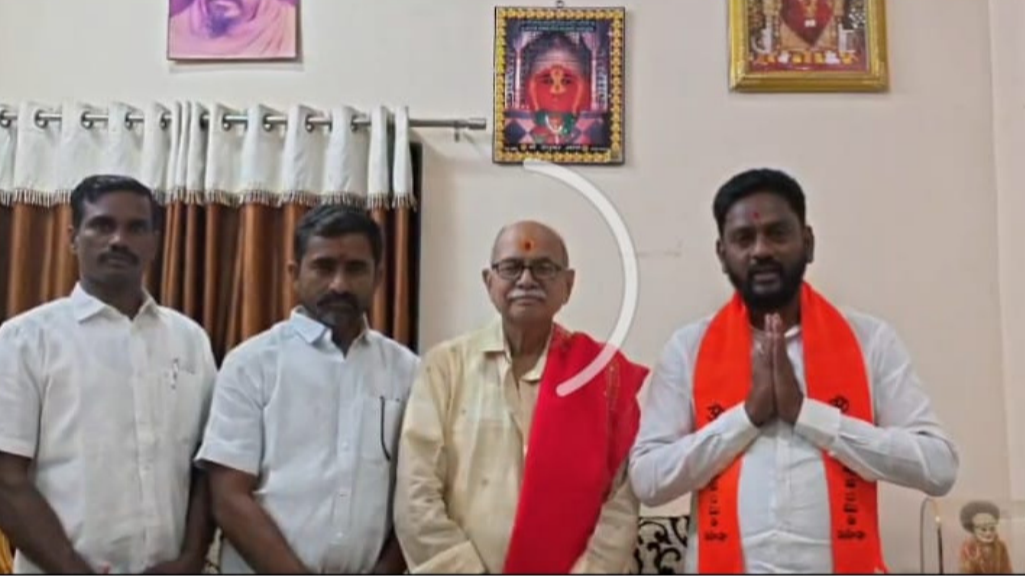
ఇందు ఉత్సాహ కమిటీ సభ్యులు