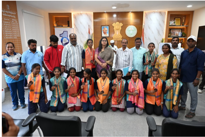
సీఎం కవ్ లో విజయలు సాధించిన