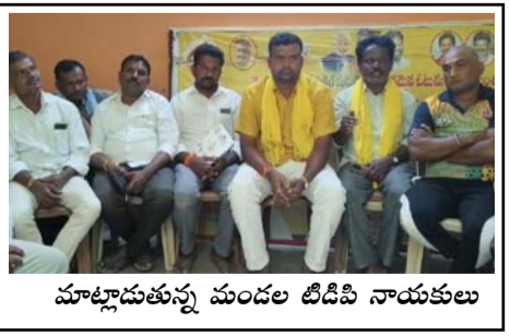
మాట్లాడుతున్న మండల టీడీపీ నాయకులు

అగళి (తెలుగోడు), ఫిబ్రవరి 27 : మార్చి 1న ఆదివారం అయినందున ఎస్టిఆర్ భరోసా పెన్షన్లు ఒక రోజు ముందుగా ఫిబ్రవరి 28వ పంపిణీ చేయనున్నట్లు మండల టీడీపీ నాయకులు తెలిపారు. కొత్తగా మంజూరైన 8,977 విఠతు (సీనియర్) పెన్షన్లతో కలిపి మొత్తం 62,76,322 మంది సింఘదారులకు రూ. 2725.79 కోట్లు స్వర్ణ గ్రామం/ స్వర్ణ వార్డు నిబంధించి పంపించారు ఇందివద్ద అందజేస్తారని రాష్ట్ర సూక్ష్మ చిన్న మధ్యతరహా పరిశ్రమలు, గ్రామీణ పేదరిక నిర్మాణం, ప్రవాహానధుల సాధికారత, సంబంధాల శాఖ మంత్రి కొండపల్లి శ్రీనివాస్ ఒక ప్రకటనలో తెలిపారు. అందులో భాగంగా అగళి మండల వ్యాప్తంగా వివిధ కేటగిరీల క్రింద వున్న సింఘదారులకు స్వర్ణ గ్రామం/ స్వర్ణ వార్డు నిబంధించి పంపిణీ చేస్తారని అన్నారు . పంపిణీ చేయగా మిగిలిన పెన్షన్లను 2 మార్చి 2026న సచివాలయ నిబంధించి పంపించారు ఇందివద్ద పంపిణీ చేస్తారని మండల టీడీపీ నాయకులు చెప్పారు. కూటమి ప్రభుత్వం ఏర్పడిన తరువాత రాష్ట్రంలో ఇప్పటివరకు సింఘదారు మొత్తంగా రూ. 57,80,868 కోట్లు ఖర్చు చేయటం జరిగిందని, ఇది రాష్ట్ర ప్రభుత్వానికి సామాజిక భద్రత పట్ల ఉన్న అంకితభావానికి నిదర్శనం అని మండల టీడీపీ నాయకులు పేర్కొన్నారు.