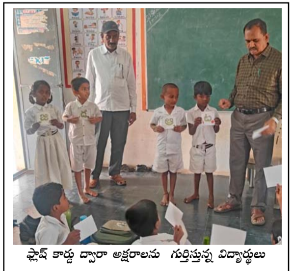
ఫ్లాష్ కార్డు ద్వారా అక్షరాలను గుర్తిస్తున్న విద్యార్థులు