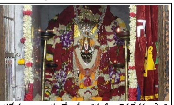
ప్రత్యేక అలంకారంలో శ్రీ శివలక్ష్మి చెన్నకేశవ స్వామి

మంగళహారతి, మంత్రపూజలు సమర్పణ అనంతరం భక్తులకు తీర్థ ప్రసాదములు పంపిణీ చేశారు. ధ్యేశారోహణ కార్యక్రమం అనంతరం స్వామివారికి ప్రత్యేక పూజలు అభిషేక అర్చనలు నిర్వహించారు. రాత్రి స్వామివారిని ప్రత్యేకంగా అలంకరించి శేష వాహనంలో ఉంచి ప్రత్యేక పూజా కార్యక్రమాలు నిర్వహించి అనంతరం స్వామివారి ఆలయం వద్ద నుండి చిన్న రథంపై కెనరా బ్యాండ్, పాత పోలీస్ స్టేషన్ సర్కిల్, లాలల వీధి, వైశ్య వీధి, కోట వీధి, పెద్దమ్మతల్లి ఆలయం మీదుగా స్వామి వారి పాదయాత్ర ఊరేగింపు. ఈ కార్యక్రమంలో అర్చకులు పెద్ద ఎత్తున భక్తులు పాల్గొన్నారు.