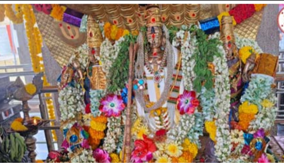
శ్రీదేవి భూదేవి సమేత శివలక్ష్మి చెన్నకేశవ స్వామివారికి ప్రత్యేక పూజా కార్యక్రమాలు స్వామివారికి ప్రత్యేక అలంకరణ. ఊరేగింపులో పాల్గొన్న భక్తులు