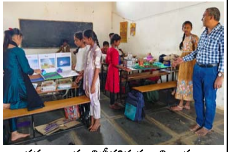
సమావాలను చిత్రకరిస్తున్న విద్యార్థులు