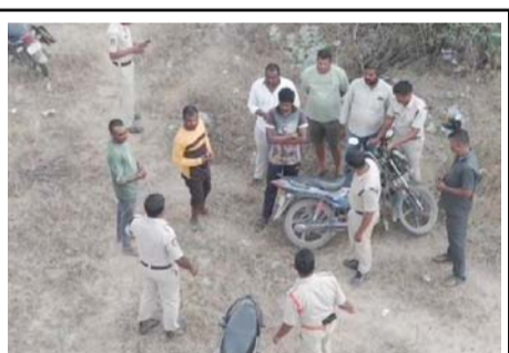
మండు బాబులను గుర్తించిన పోలీసులు