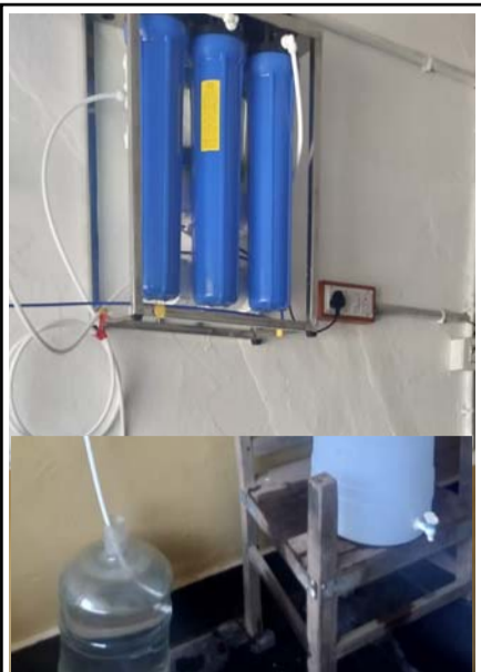
యాడికి ప్రభుత్వ వైద్యశాలకు నీటిశుద్ధి యంత్రం అందించిన దృశ్యం

యాడికి మండల కేంద్రంలోని ప్రభుత్వ ఆసుపత్రికి యాడికి గ్రామానికి చెందిన ఓ దాత తాగునీటి శుద్ధి యంత్రం అందజేశారు. ఆనంతపురం నగరంలో స్థిరపడిన దాత యాడికి ప్రభుత్వ వైద్యశాలకు వచ్చిన సమయంలో రోగులు నీటి సమస్య ఎదుర్కోవడం గమనించారు. వేసవికాలాన్ని దృష్ట్యా ఉంచుకొని రోగులకు ఎలాంటి తాగునీటి సమస్య తలెత్తకుండా నీటి శుద్ధి యంత్రం అందజేసినట్లు వైద్య సిబ్బంది తెలిపారు. ఈ సందర్భంగా దాతకు వైద్య అధికారులు, సిబ్బంది, ప్రజలు ధన్యవాదాలు తెలిపారు. అలాగే ఈ ఆసుపత్రిలో బ్యాటరీలు నాలుగు అవసరం ఉన్నాయని, కరెంటు పోయిన సమయంలో మందులు ఫ్రీజ్లో పెట్టుకోవడానికి చాలా ఇబ్బందిగా ఉందని అధికారులు తెలిపారు. దాతలు ముందుకు వచ్చి బ్యాటరీలు అందించాలని సిబ్బంది కోరారు.