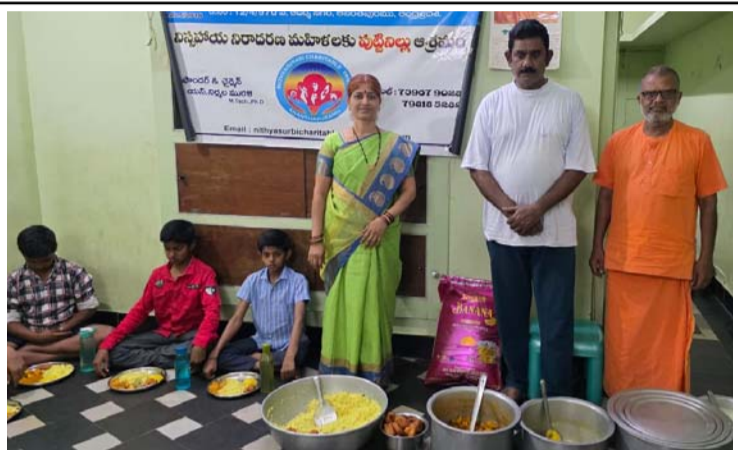
అన్నదానం చేస్తున్న నిత్యసురభి శ్రుస్థు సభ్యులు