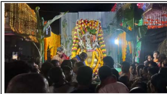
శేష వాహనంలో శివలక్ష్మి చెన్నకేశవ స్వామి ఊరేగింపు తో భక్తులకు దర్శనం

యాడికి మండల కేంద్రంలో వెలసిన శ్రీ శివ లక్ష్మి చెన్నకేశవ స్వామి బ్రహ్మోత్సవాలలో భాగంగా శుక్రవారం శేషవాహనంపై చెన్నకేశవ స్వామి భక్తులకు దర్శనమిచ్చారు. శుక్రవారం ఆలయం నందు అర్చకులు భక్తులు ఆధ్వర్యంలో ఉదయం నిత్య పూజలు ప్రత్యేక పూజలు నిర్వహించారు. ప్రాణాతి మంగళ వాయిద్య, గీతా మంగళహారతులు గంగాహారణం (బిందెనీవ) ఆగమహిత కార్యక్రమం గ్రామం నందు బలిహారణాలు భగవంతుని తిరుమళ్ళ నాధులు ఆరాధన, సహస్రనామ పూజ, ఉత్సవ మూర్తులను పల్లకి యందు ఉంచి గ్రామమున ఊరేగింపు. విశ్రాంతి సందర్భం..