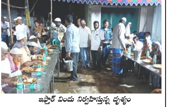
ఇష్టార్ విందు నిర్వహిస్తున్న దృశ్యం