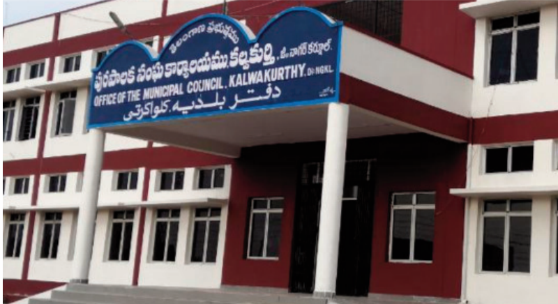
మీ జేబుకు చిల్లు... ఇల్లు టాక్స్ నల్ల టాక్స్ కట్టి ఉంటేనే నామినేషన్ వేయడానికి అర్హత....