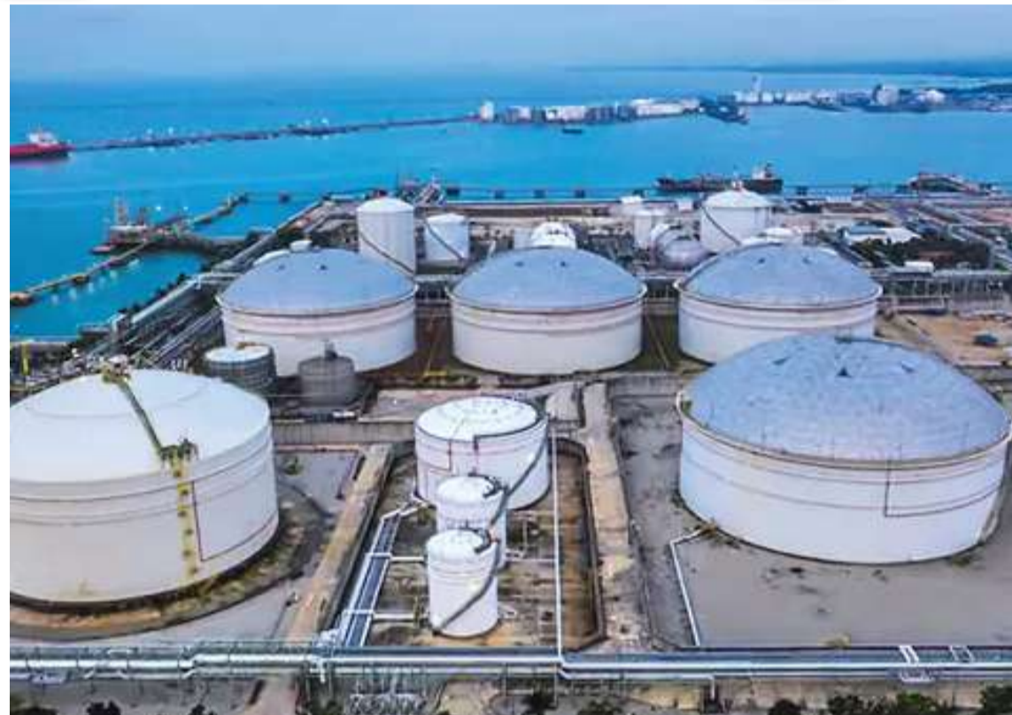
మిలియన్ టన్నుల గ్యాస్ సామర్థ్యం తగ్గినట్లు తెలుసుకుంటున్న భారత్. ఈ రెండు పరిణామాలు నేపథ్యంలో.. అంతర్జాతీయంగా గ్యాస్ సరఫరా 35 మి. టన్నుల మేర తగ్గాయని అంచనా. ఇది 500 ఎల్ఎన్జీ కార్గో

అంతర్జాతీయంగా ముడిచమురు ధర పెరుగుతున్న నేపథ్యంలో, రష్యా చమురు విక్రయాలపై అమెరికా ఆంక్షలు సడలించింది. వెంటనే అక్కడి సంస్థల నుంచి ముడిచమురు దిగుమతి చేసుకునేందుకు మన లిఫైనరీలు ఆర్డర్లు పెట్టాయి. ఇప్పుడు ద్రవరూప సహజ వాయువు (ఎల్ఎన్జీ) కొనుగోళ్లను పునరుద్ధరించాలని భావిస్తోంది. హయాజ్ జలసంధి అవాంతరాలు ఇప్పుడేపుడే తొలగిపోయేలా కనిపించకపోవడమే ఇందుకు నేపథ్యం. గ్యాస్ విక్రయానికి కూడా అమెరికా ఆంక్షలు తొలగిస్తుంది. దేశంలో కొరత కలిగిపోతున్నందున, ఎల్ఎన్జీ కోసం భారత్ ముందుకు వెళ్లాలనుకుంటే.. అమెరికా నుంచి త్వరగానే అనుమతులు రావచ్చని విశ్వసనీయ వర్గాలను ఉటంకిస్తూ వార్తా సంస్థ 'రాయిటర్స్' తెలిపింది.