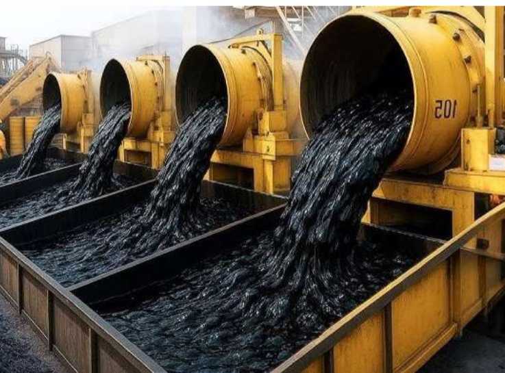
యూర్రానికి ముందు 70 దాల్చుగా ఉన్న ఒక బ్యారెల్ ఇవన్నీ ఇప్పటికే మన రిఫైనరీలపై ప్రభావం చూపుతున్నాయి. ఇందులో 100 దాల్చు దాటింది.

పశ్చిమాసియా ఉద్రిక్తతల వేళ అంతర్జాతీయంగా ఇంధన సంక్షోభం నెలకొంది. ఇలాంటి సమయంలో రష్యా తీవ్ర ప్రకటన చేసింది. ఏప్రిల్ ఒకటి నుంచి గ్యాసోలిన్ (ఇథిల్) ఎగుమతులపై నిషేధం విధిస్తున్నట్లు వెల్లడించింది. దేశీయ సరఫరాకు ప్రాధాన్యం ఇచ్చేందుకు, ధరలను స్థిరపరచే లక్ష్యంతో ఈ నిర్ణయం తీసుకుంది. ఈ నేపథ్యంలో భారత్పై ప్రభావం గురించి విశ్లేషణలు వస్తున్నాయి. భారత్ తన ఇంధన అవసరాలు తీర్చుకునేందుకు 80శాతం మేర ముడిచమురు దిగుమతులపైనే ఆధారపడుతోంది. అందులో 20 శాతం రష్యా నుంచి వస్తున్నాయి. మన వద్ద భారత్లో రిఫైనర్లలో సామర్థ్యం ఉండటంతో.. మన దిగుమతుల్లో గ్యాసోలిన్ లోక ఇతర శుద్ధి చేసిన ఉత్పత్తుల వాటా స్వల్పమే. దేశంలో రిఫైనరీలు రోజూకు 5.6 మిలియన్ల బ్యారెల్ల మేర చమురును శుద్ధి చేస్తున్నాయి. ఈ రిఫైనర్లలో వల్ల దేశీయ అవసరాలు తీరడమే గాకుండా పలు ఉప ఉత్పత్తులు విదేశాలకు ఎగుమతి అవుతున్నాయి. కాబట్టి.. గ్యాసోలిన్ ఎగుమతిపై రష్యా (Russia) నిషేధం భారత్పై చూపే ప్రభావం పరిమితమే. ఈ నిషేధం సహా ప్రపంచ ఇంధన మార్కెట్లో అంతరాయాలతో ముడిచమురు ధరలు పెరగొచ్చిన అందోహం వ్యక్తమవుతోంది. ఇప్పటికే భారత్ యుద్ధం కావడంగా హున్జూబ్లో నౌకల రవాణాకు ఆటంకం ఏర్పడటంతో చమురు ధరలు భగ్గుమంటున్నాయి.