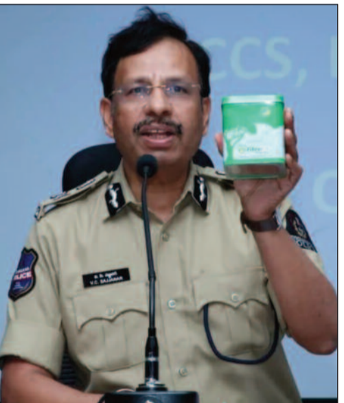
పరిస్థితి తెచ్చుకోవద్దు. మీ పరిసరాల్లో ఎవరైనా బెట్టింగ్ కు పాల్పడుతున్నట్లు తెలిస్తే వెంటనే దయల్ 100 లేదా మా వాట్సాప్ నంబర్ 94906 16555 కు సమాచారం