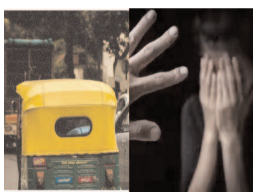
ఒడికట్టారు. ఆ తర్వాత ఆమెను అక్కడే వదిలిపెట్టి

విజయవాడ: దేశవ్యాప్తంగా మహిళలపై అత్యాచారాలు రోజురోజుకూ పెరిగిపోతున్నా ఉన్నాయి. ప్రతి రోజూ ఏదో ఒక చోట వారిపై కామాంధులు లైంగిక దాడులకు లాల్చుతున్నా ఉన్నారు. చిన్న, పెద్ద, వృద్ధులు అనే తేడా లేకుండా కామంధులు తీర్చుకుంటూ రెచ్చిపోతున్నారు. ఒంటరిగా చిక్కితే పాపం.. అత్యాచారాలకు తెగపడుతున్నారు. తాజాగా అలాంటి ఘటనే ఒకటి విజయవాడలో జరిగింది. ఆటో ఎక్కిన యువతిపై డ్రైవర్ అత్యాచారానికి పాల్పడ్డాడు. యువతి వెళ్లాలని ప్రాంతానికి కాకుండా బలవంతంగా కృష్ణలంక వైపునకు తీసుకెళ్లారు కామాంధుడు. భయభ్రాంతులకు గురి చేసి ఎవరూ లేని ప్రదేశానికి లాక్కెళ్లారు. అనంతరం యువతిపై అత్యాచారానికి