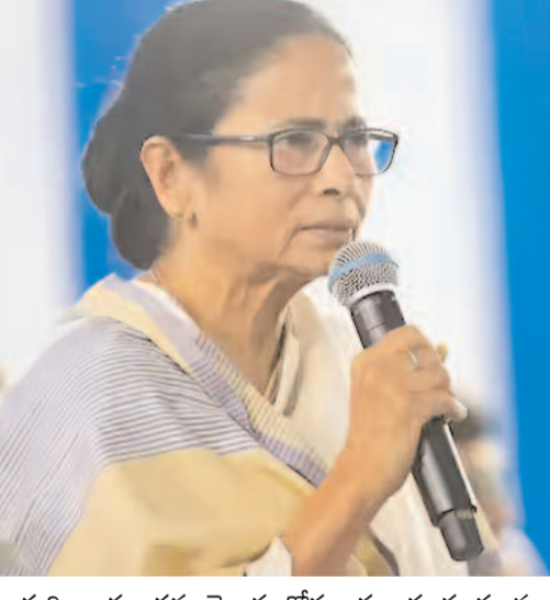
హెచ్చరించారు. తమ గెలుపు కోసం దర్భాష్ట్ర సంస్థలను

ఉపయోగించుకుంటూ బీజేపీ నేతలు అన్ని హద్దులను దాటుతున్నారని మండిపడ్డారు. ఆ పార్టీ ఆదేశాల మేరకే ఎన్నికల సంఘం రాష్ట్రంలో ఎలక్షన్స్ కు ముందు హడావిడిగా 'సర్' పత్రీయ చేపట్టిందని ఆరోపించారు. ఓటరు జాబితా నుంచి బెంగాల్ ఓటర్లను తొలగించడానికి ఎన్నికల కమిషన్ ను బీజేపీ పావులా వాడుకుంటోందని అన్నారు. రాష్ట్రంలో బీజేపీ ఉనికి లేకుండా చేయడం, ఆ పార్టీ నుంచి దేశాన్ని రక్షించడమే తుణుములే కాంగ్రెస్ ప్రధాన లక్ష్యమన్నారు. రాజీగంజోల్ లో పర్యటించిన తరువాత కొండచరియలు విరిగిపడుతుండడం వల్ల అక్కడి ప్రజలు ప్రాణాలు కోల్పోతున్నారని మమత ఆవేదన వ్యక్తం చేశారు. ఇటువంటి ప్రమాదకర ప్రాంతాలను విడిచిపెట్టి.. సురక్షిత ప్రాంతాలకు వెళ్లి వారికి తమ ప్రభుత్వం గృహపనితీతోపాటు రూ.10 లక్షల ఆర్థికసాయం అందిస్తుందని హామీ అన్నారు. బెంగాల్ లో గెలుపానే దేశంలోని ఇతర రాజకీయ పార్టీలతో కలిసి కేంద్రంలో బీజేపీని గద్దె దించుతానని హెచ్చరిక చేశారు.