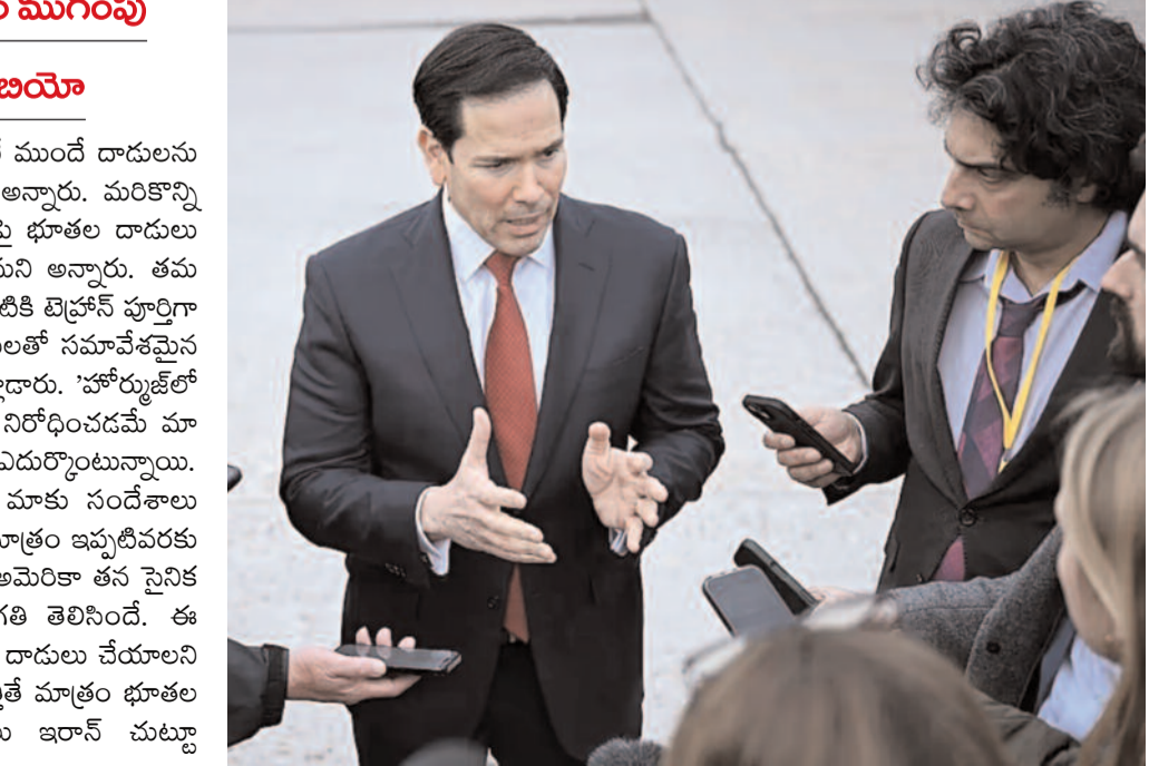
ప్యాసిస్, మార్చి 28: ఇరాన్ పై అనుకున్న సమయం కంటే ముందే దాడులను ముగిసేమని అమెరికా విదేశాంగ మంత్రి మార్క్ రుబయో అన్నారు. మరికొన్ని వారాల్లో ఇరాన్ యుద్ధం ముగుస్తుందని తెలిపారు. ఇరాన్ పై భూతల దాడులు చేయాల్సిన అవసరం లేకుండానే తమ లక్ష్యాలను సాధిస్తామని అన్నారు. తమ దాడులు మరో రెండు, మూడు వారాల్లో పూర్తవుతాయని, అప్పటికి బెన్ షాద్ హుర్రీగా బలహీనపడుతుందని పేర్కొన్నారు. ఫ్రాన్స్ లో జీ-7 ప్రతినిధులతో సమావేశమైన అసంతరం జరిగిన విలేజ్ లో సమావేశంలో రుబయో మాట్లాడారు. 'హోర్నోజ్ లో జరిగే చమురు రవాణాపై ఇరాన్ సుంకాలు విధించకుండా నిరోధించడమే మా తక్షణ కర్తవ్యం. ఆ సుంకాల వల్ల అనేక దేశాలు ఇబ్బందులు ఎదుర్కొంటున్నాయి. యుద్ధం ముగింపుపై చర్చల కోసం ఇరాన్ పాలకవర్గం మాకు సందేశాలు పంపింది. అయితే మేం ప్రతిపాదించిన శాంతి ప్రణాళికపై మాత్రం ఇప్పటివరకు స్పందించలేదు' అని రుబయో తెలిపారు. పశ్చిమాసియాలో అమెరికా తన సైనిక బలగా మోహరించును ఇటీవల భారీగా పెంచిన సంగతి తెలిసింది. ఈ విషయంపై కూడా రుబయో మాట్లాడారు. 'ఇరాన్ పై భూతల దాడులు చేయాలని మేం అనుకోవడం లేదు. కానీ, అత్యవసర పరిస్థితులు తలెత్తితే మాత్రం భూతల దాడులకు దిగక తప్పదు. అందుకే అమెరికా దళాలు ఇరాన్ చుట్టూ మోహరిస్తున్నాయి' అని రుబయో స్పష్టం చేశారు.

అనుకున్న సమయానికన్నా ముందే యుద్ధం ముగింపు అమెరికా విదేశాంగ మంత్రి మార్క్ రుబయో