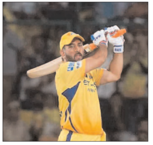
ఓపెనర్గా, వికెట్ కీపర్గా తన ముద్ర వేసేందుకు ఇంతకుముందైన సమయం ఉండదేమో.

యాజమాన్యం వెల్లడించింది. ధోనీ లేకుండా చెన్నై జట్టు ఐపీఎల్ ఆడనుండడం ఇదే మొదటిసారి కానుంది. అంతర్జాతీయ క్రికెట్కు వీడ్కోలు పలికినప్పటి నుంచి పూర్తిగా ఐపీఎల్కి అంకితమైన మహేంద్ర సింగ్ ధోనీ తొలిసారి టోర్నీకి దూరమవుతున్నాడు. ఆరంభ సీజన్ నుంచి బ్రేక్ లేకుండా ఆడుతున్న తాలా ఈసారి కొన్ని మ్యాచ్లకు అందుబాటులో ఉండడు. గత సీజన్ ఫైనల్లో మోకాలి గాయంతోనే ఆడిన ధోనీ అనంతరం సర్దర్ చేయించుకున్నాడు. ఈ గాయం నుంచి కోలుకున్నా. కండరాల గాయం ధోనీని వెంటాడింది. దాంతో, అతడికి విశ్రాంతి అవసరమని వైద్యులు సూచించారు. అందుకే రెండు వారాలు సీఎస్కే మ్యాచ్లకు ధోనీ దూరం కానున్నాడు. పంతొమ్మిదో ఎడిషన్ తొలి మ్యాచ్లో మార్చి 30న రాజస్థాన్ రాయల్స్తో సీఎస్కే తలపడనుంది. రికార్డు స్థాయిలో 278 మ్యాచ్లు ఆడిన ధోనీ గౌరవార్థం సంజూ శాంసన్ కు వికెట్ కీపింగ్ అప్పగించే అవకాశముంది. ఇటీవలే ట్రేడ్ పద్ధతిన సీఎస్కే గూటికి చేరిన శాంసన్