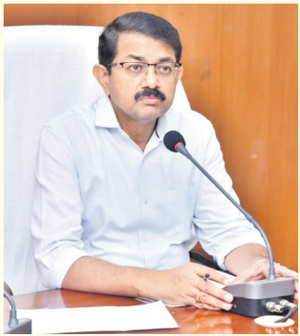
విజయనగరం, (మనసులో మాట) జిల్లా ప్రతినిధి, మే 30 :