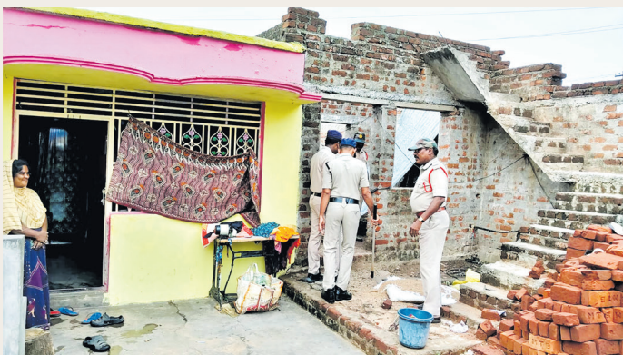
పార్వతీపురం మనసులో మాట, మే 30:

జిల్లాలో గంజాయి అక్రమ రవాణా, నిల్వలు, విక్రయాలను పూర్తిగా అరికట్టేందుకు పోలీసులు చేపట్టిన "వజ్ర ప్రహారీ" ఆపరేషన్ మరింత ఉధృతంగా కొనసాగుతోంది. ఈ క్రమంలో శనివారం బత్తిలి గ్రామంలోని కొత్తవీధిలో భారీ స్థాయిలో కార్డన్ అండ్ సెర్ప్ ఆపరేషన్ నిర్వహించి అనుమానితుల కదలికలపై నిఘా పెట్టారు. ఆపరేషన్లో భాగంగా పోలీసులు సుమారు 50 ఇళ్లను ఖుణ్ణంగా తనిఖీ చేసి, 200 మంది వ్యక్తుల వివరాలను ధృవీకరించారు. గంజాయి సాగు, రవాణా, విక్రయాలు లేదా ఇతర నేర కార్యకలాపాలతో ఎవరైనా సంబంధాలు కలిగి ఉన్నారా అనే అంశాలపై ఆరా తీశారు. గ్రామంలోని యువత, స్థానిక ప్రజలతో