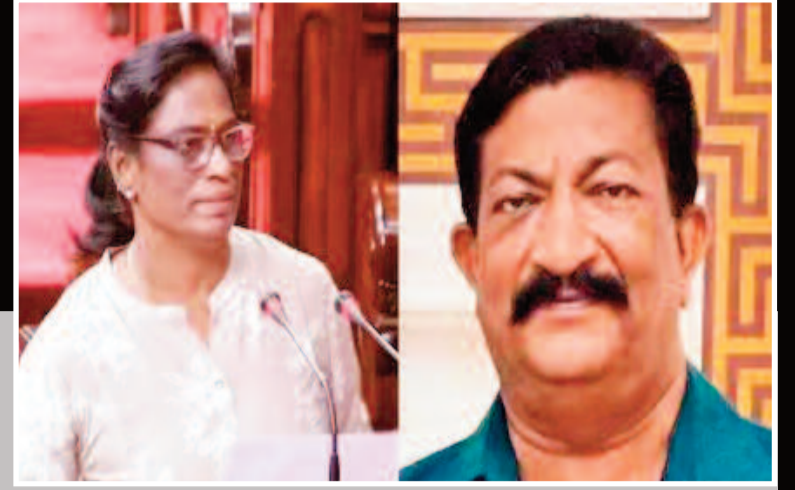
కుటుంబానికి నా ప్రగాఢ సానుభూతి తెలియజేస్తున్నాను. ఈ కష్టకాలంలో దేవుడు ఆమెకు మనోధైర్యాన్ని ప్రసాదించాలి" అని ఎక్స్ (ట్విట్టర్) వేదికగా పోస్ట్ చేశారు. క్రీడాకారులు, కోచ్లు, అభిమానులు సోషల్ మీడియా ద్వారా పీటీ ఉషకు సానుభూతి తెలుపుతున్నారు.

శుక్రవారం తెల్లవారుజామున హఠాన్వరణం.. కుప్పకూలిన కొద్దిసేపటికే మృతి ఉష విజయాల వెనుక ఉన్న నిశ్శబ్ద శక్తి ఆయన: కన్నీటి పర్యంతమైన కుటుంబం ప్రగాఢ సంతాపం తెలిపిన ప్రధాని మోదీ, కేంద్ర మంత్రి కిరణ్ రిజిజు