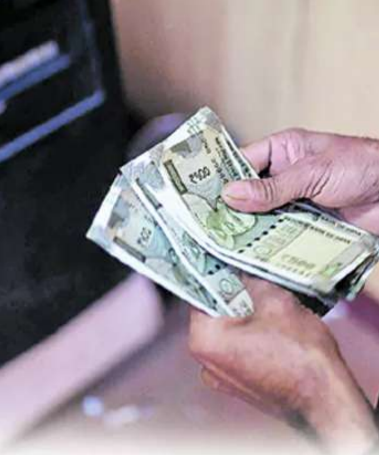
కాకుండా పిన్ లేదా బయోమెట్రిక్ వంటి అదనపు ధృవీకరణ (రెండంచెల భద్రత) తప్పనిసరి కానుంది.

హైదరాబాద్: కొత్త ఆర్థిక సంవత్సరం (202627) బుధవారం నుంచి ప్రారంభం కాబోతోంది. ఈ సందర్భంలో బ్యాంకింగ్ నిబంధనల్లో మార్పులు చేసే అవకాశం ఉంది. రిజర్వ్ బ్యాంక్ ఆఫ్ ఇండియా (ఆర్బిఐ)తో పాటు, పలు బ్యాంకులు తమ ఖాతాదారుల లావాదేవీల నియమాలను సవరిస్తున్నాయి. యూపీఐతో తీసుకున్నా: ఇప్పటివరకూ ఏటీఎంలలో కార్డు లేకుండా, యూపీఐ క్యూఆర్ కోడ్ స్కాన్ చేసి సగటు ఉపసంహరణను చేసుకోవడానికి వినియోగదారులు ఉచితంగా లేదా అదనపు లావాదేవీగా వాడుకునే వారు. ఏటీఎం 1 నుంచి డీనికీ అప్పుకట్ట పడనుంది. హెచ్డీఎఫ్ఎస్ బ్యాంక్ సహా పలు బ్యాంకులు ఇకపై ఏటీఎంలలో చేసే యూపీఐ ఆధారిత సగటు ఉపసంహరణను, నెలలకు ఉచిత ఏటీఎం లావాదేవీల పరిమితిని పరిగణించనున్నాయి. ఉచిత లావాదేవీల పరిమితి ముగిసాక.. యూపీఐ ద్వారా చేసే ప్రతి ఉపసంహరణపై రూ.23తో పాటు అదనంగా పన్నులు చెల్లించాల్సింది. ఉపసంహరణ చేయడం తగ్గింపు