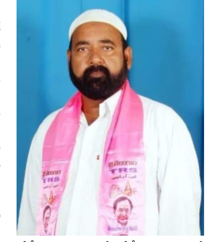
నోటీసులు ఇస్తున్నారు మీ నోటీసులకు భయపడే వ్యక్తి కెసిఆర్ కాదు కేసిఆర్ ఒక పులి ఈ ముస్లిం పల్ ఎన్నికల్లో మీకు ప్రజలు తగిన గుణపాఠం చెప్తారు జాగ్రత్త.

ప్రభుత్వం వచ్చిన వెంటనే వృత్తులకు ఆసరా పెంచారు 4000 ఇస్తా అంటివి దానికి దిక్కులేదు 18 సంవత్సరాలు నిండిన ఆడపడుచులకు నెలకు 2,500 ఇస్తానంటివి అవి తప్ప కనీసం కల్యాణ లక్ష్మి షాడి ముబారక్ లక్ష రూపాయలు తో పాటు తులం బంగారం అంటివి కదా సారీ లక్ష రూపాయలకే దిక్కులేదు పెళ్లి అయి పిల్లలు పుట్టిన తర్వాత మీ ప్రభుత్వం వారికి లక్ష రూపాయలే చెక్కులు ఇస్తున్నారు. రైతులకు వ్యవసాయానికి సరిపడా యూరియా సప్లీ చేయడానికి మీ ప్రభుత్వానికి చేతకాకడం లేదు రైతులు రోడ్డుపై యూరియా గురించి ధర్నాలు చేసి రాస్తారోకాలు చేస్తే పాస్ బుక్కులు లైఫ్ షెడ్యూల్ పొద్దు నుండి సాయంత్రం వరకు నిలబడితే ఒక బస్తా ఇచ్చినారా ఇది మీ ప్రభుత్వం మీరు చేసే ఘనకార్యం మీ విఫల ప్రభుత్వాన్ని కాపాడే దృష్టి పెట్టండి రైతులకు ఇస్తానన్న రైతు బంధు ఎకరారు 15000 ఇవ్వండి వృద్ధులకు మా