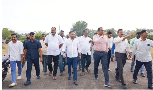
కాకినాడ (మనసులో మాట) మే 30

రాష్ట్ర ముఖ్యమంత్రి నారా చంద్రబాబు నాయుడు జూన్ 1 వ తేదీ న కాకినాడ జిల్లా తుని మండలం చామవరం గ్రామంలో నిర్వహించనున్న పర్యటన నేపథ్యంలో ఏర్పాట్లు వేగవంతమయ్యాయి. ఈ సందర్భంగా రాజ్యసభ సభ్యుడు సానా సతీష్ బాబు జిల్లా కలెక్టర్ ఎం.ఎన్. హరేంద్ర ప్రసాద్ తుని ఎమ్మెల్యే యనమల దివ్యతో కలిసి పర్యటన ఏర్పాట్లను అధికారులతో కలిసి క్షుణ్ణంగా పరిశీలించారు.