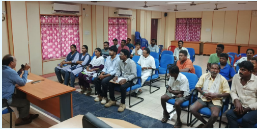
హిరాపురం, (మనసులో మాట) మే 30: