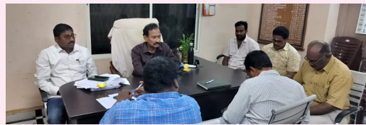
మండపేట (మనసులో మాట) మే 30

మండల కేంద్రం స్థానిక కపిలేశ్వరపురం మండల ప్రజా పరిషత్ కార్యాలయంలో పుష్కర స్పెషల్ డిప్యూటీ కలెక్టర్ మహేష్ ఆదేశాల మేరకు పుష్కరములు 2027 సంబంధించి అన్ని ప్రభుత్వ శాఖల వారిగా తీసుకుంటున్న చర్యలు విషయమై శనివారం సమీక్ష సమావేశం నిర్వహించారు. కపిలేశ్వరపురం మండలంలో మొత్తం 9 పుష్కర ఘాట్లుగా గుర్తించినట్లు, వాటిలో తాతపూడి, కపిలేశ్వరపురం, పెద కోరుమిల్లి, చిన్న కోరుమిల్లి, వాకతిప్ప నారాయణలంక, కేదార్లంక, అద్దంకివారిలంక లలో అన్ని C క్యాటగిరీకి చెందినట్లు, ఈ ఘాట్లను ఆధునికీకరణ చేయుటకు ప్రతిపాదనలు పంపించామని గౌతమి గోదావరి హెడ్ లైట్స్ హెడ్వార్ట్స్ అధికారులు తెలిపారు. పంచాయతీరాజ్ శాఖ మండలంలోని గ్రామాల పుష్కర ఘాట్లకు సంబంధించి భక్తులు చేరు ఘాట్లకు ఆయా పంచాయతీ రోడ్లను నిర్మాణము, పటిష్టతలకు ప్రతిపాదనలు పంపడమైనదని పంచాయతీరాజ్ అధికారులు ఈ సమీక్ష సమావేశాలు వివరించారు. ఆర్ అండ్ బి శాఖకు సంబంధించి ముఖ్యమైన రోడ్లకు అభివృద్ధి కోసం ప్రతిపాదనలు పంపినట్లు తెలిపారు. ఘాట్ల వద్ద బారికేడ్స్ ఏర్పాటు, శానిటేషన్, లైటింగ్, షామియానాలు పంచాయతీ తదితర భక్తులకు ఏర్పాట్లు, త్రాగునీరు, బయోటాయిలెట్ ఏర్పాటు, దేవదాయ శాఖ చేపిండ ప్రధానములు సంబంధించిన పురోహితులను నయామకం, ఆదేవిధంగా ఘాట్లకు సమీపంలో ఉన్న ప్రతి దేవాలయం వద్ద భక్తులు సౌకర్యార్థం త్రాగునీరు, క్యూలైన్ల వద్ద బారికేడ్స్ ఏర్పాటుకు సభలో చర్చించారు. ఈ సమావేశము లో కపిలేశ్వరపురం మండల తాహసిల్దార్ జి.శ్రీనివాస్, ఎంపీడివో బానోజిరావు పంచాయతీ రాజ్, ఇరిగేషన్, ఆర్ అండ్ బి తదితర శాఖల అధికారులు పాల్గొన్నారు.