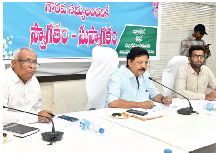
రాజమహేంద్రవరం (మనసులో మాట ప్రత్యేక ప్రతినిధి), మే 30:

తూర్పు గోదావరి జిల్లాలో ఖరీఫ్-2026 (ఫసలీ 1436) పంటలకు సాగునీరు అందించేందుకు ఆదివారం (మే 31) నుండి ధవళేశ్వరం సర్ ఆర్డర్ కాటన్ బ్యారేజీ నుంచి కాలువలకు నీటిని విడుదల చేయాలని జిల్లా సాగునీటి