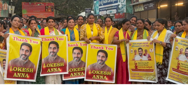
అనపర్తి (మనసులో మాట), మే 30:

తెలుగుదేశం పార్టీ మహిళలకు అధిక ప్రాధాన్యం కల్పిస్తుంది అనడంలో ఏ మాత్రం సందేహం లేదని, నారా లోకేశ్ నిర్ణయమే అందుకు నిదర్శన మని అనపర్తి నియోజకవర్గ మహిళా నాయకులు అన్నారు. అనపర్తి నియోజకవర్గం కేంద్ర ప్రాంతమైన అనపర్తి గ్రామంలో తెలుగుదేశం పార్టీ మహిళా నాయకులు రాష్ట్ర ఐటీ శాఖ మంత్రి నారా లోకేశ్ కు ప్రత్యేకంగా అభినందనలు తెలియజేశారు. చట్టసభల్లో ఎన్నో సంవత్సరాలుగా చర్చకు మాత్రమే పరిమితమైన మహిళా రిజర్వేషన్ అంశాన్ని, పార్టీ స్థాయిలో అమలు చేస్తూ మహిళలకు 33 శాతం రిజర్వేషన్ కల్పించాలని మహానాడు వేదికగా ప్రకటించిన నిర్ణయాన్ని మహిళలు స్వాగతించారు. ఈ సందర్భంగా మహిళా నాయకులు మాట్లాడుతూ మహిళలకు రాజకీయంగా మరింత ప్రాధాన్యత కల్పించే దిశగా ఈ నిర్ణయం చారిత్రాత్మకమని పేర్కొన్నారు. గ్రామ స్థాయి నుంచి రాష్ట్ర స్థాయి వరకు మహిళలకు సముచిత స్థానం కల్పించాలనే ఆలో