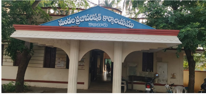
గ్రేడ్ టూ పంచాయతీ కార్యదర్శులుగా ఇతర మం డలాల్లో బాధ్యతలు స్వీకరించనున్నారు.