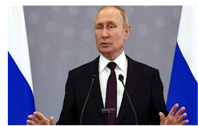
అతడి కుటుంబ సభ్యులు, ఇరాన్ ప్రజలు, సైనికులకు పుతిన ఆరోపణలు చేసింది.

అశ్రీఘానాఅబెల్ ౨౯౯౯ : ఇరాన్ నూతన సుప్రీం లీడర్గా ఎన్నికైన అయితోల్లా మొజ్జాబా ఖమేనికి రష్యా అధ్యక్షుడు వ్లాదిమిర్ పుతిన అభినందనలు తెలిపారు. ఇరాన్కు మద్దతుగా ఉంటామని పుతిన హామీ ఇచ్చారు. ఈ మేరకు సోమవారం పుతిన ఒక ప్రకటన విడుదల చేశారు. "ఇరాన్ సుప్రీం లీడర్గా ఎన్నికైన మొజ్జాబాకు శుభాకాంక్షలు. ఈ క్షిప్ర సమయంలో ఇరాన్కు రష్యా అండగా నిలబడుతుంది. ఇరాన్లోని మా స్నేహితులకు, వారి సమగ్రతకు రష్యా మద్దతుగా ఉంటుంది. మొజ్జాబా తన తండ్రి వారసత్వాన్ని కొనసాగిస్తూ, ఇరాన్ ప్రజల్లో ఏకతాటిపైకి తెస్తారని భావిస్తున్నాం. యుద్ధం కొనసాగుతున్న ఈ సమయంలో నాయకత్వం పనించడానికి మొజ్జాబాకు గొప్ప ధైర్యం, పట్టుదల కావాలి" అని పుతిన తన సందేశంలో పేర్కొన్నారు. ఒకవైపు మొజ్జాబా ఎన్నికపై అమెరికా అధ్యక్షుడు ట్రంప్ ఆగ్రహం వ్యక్తం చేస్తుంటే, రష్యా మాత్రం మద్దతుగా నిలవడం విశేషం. ఈ యుద్ధ సమయంలో ఇరాన్కు రష్యా వైతిక మద్దతు ప్రకటించింది. ఇటీవలే ఇరాన్ అధ్యక్షుడు మహ్మద్ పెజిషేయర్లు పుతిన ఫోన్లో మాట్లాడారు. దాడుల్లో మరణించిన ఖమేని,