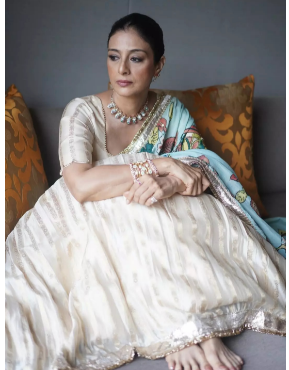
వయసు హీరోయిన్ మాదిరిగానే ఉంటుంది.

వడి మూడు ఏళ్లు అవుతుంది. అయినా కూడా టబు ఫోటో షూట్స్ లో మూడు పదుల