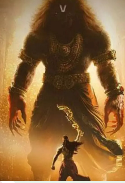
చేసినట్లు మేకర్స్ అనాస్ చేశారు. అలా సైయా, మహాచితార నరసింహా ఇప్పుడు ఇండియన్ బాక్సాఫీస్ వద్ద అగ్రస్థానంలో ఉన్నాయి.

మహాచితార.. ఒక్కటి కాదు చాలా మరోవైపు, ప్రముఖ హోంబల్ ఫిల్మ్ నిర్మించిన యానిమేషన్ మహాచితార నరసింహా చిన్న సినిమాగా విడుదలవచ్చా.. మోట్ టాక్ మూవీని విజేతగా నిలిపింది. భక్త ప్రహ్లాదుడి కథతో వచ్చిన సినిమా వీఎఫ్ ఎక్స్ వర్క్ కు అంతా ఫిదా అవుతున్నారు. ధియోటర్స్ కు ప్రజలు క్యూ కడుతున్నారు. దీంతో స్ట్రీట్ సంఖ్య రెట్టింపు అయింది. శుక్రవారం నుంచి ఆదివారం వరకు మహాచితార నరసింహా ప్రేక్షకుల సంఖ్య, బాక్సాఫీస్ సంఖ్యలో 400 శాతం పెరుగుదల కనిపించిందని ట్రేడ్ వర్గాలు అంచనా వేశాయి. ఇది చాలా పెద్ద విజయంగా చెబుతున్నారు. నార్త్ లో కూడా మల్టీప్లెక్స్ లు షోస్ కొంటు ను పెంచాయి. నిన్న ఒక్క రోజే రూ.11.25 కోట్లు వసూలు