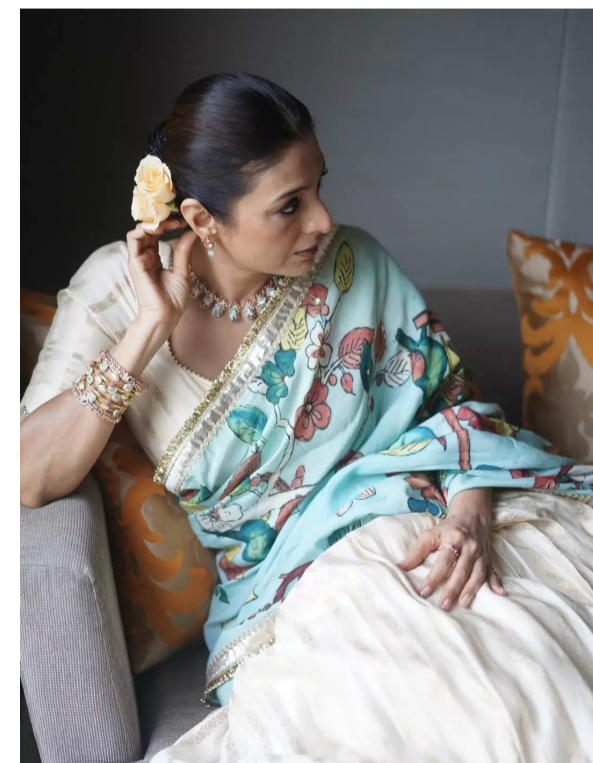
సీనియర్ హీరోయిన్ టబు అయిదు పదుల వయసులో

వడి మూడు ఏళ్లు అవుతుంది. అయినా కూడా టబు ఫోటో షూట్స్ లో మూడు పదుల