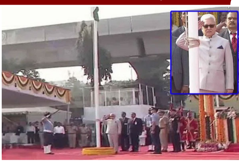
జరుగుతున్నాయి. సికింద్రాబాద్లోని పరేడ్ గ్రౌండ్స్లో నిర్వహించిన రాష్ట్రస్థాయి ఆధికారిక కార్యక్రమంలో గవర్నర్ జిష్ణుదేవ్ వర్మ జాతీయ జెండాను ఆవిష్కరించారు. అనంతరం ఆయన సాయుధ దళాల గౌరవ వందనం స్వీకరించారు. ఈ వేడుకలకు మిగతా..2లో

మున్సిపల్ ఎన్నికల్లో పోటీ చేస్తామన్న కోదండరాం