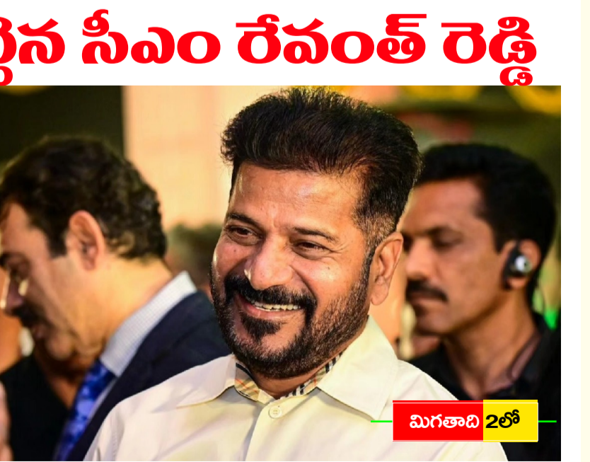
హైదరాబాద్: తెలంగాణ ముఖ్యమంత్రి రేవంత్ రెడ్డి అమెరికాలోని ప్రఖ్యాత హార్వర్డ్ యూనివర్సిటీలో తన ఎగ్జిక్యూటివ్ ఎడ్యుకేషన్ కార్యక్రమాన్ని మొదలుపెట్టారు. మసాచుసెట్స్ లోని కేంబ్రిడ్జ్ లో ఉన్న కెన్సెస్ న్యూజ్ లో 'లీడర్షిప్ ఇన్ 21వ శతాబ్దం: కేయాస్, కాన్సిక్వెట్, అండ్ కర్రెజ్' అనే కోర్సులో ఆయన చేరారు. అధివారం స్థానిక కాలమాసం ప్రకారం ఫ్రోగ్రామ్ ఓరియంటేషన్, సహ విద్యార్థుల పరిచయంతో తరగతులు మొదలయ్యాయని ముఖ్యమంత్రి కార్యాలయం ఒక ప్రకటనలో తెలిపింది. సోమవారం ఉదయం 7 గంటల నుంచి

హార్వర్డ్ యూనివర్సిటీలో విద్యాభ్యాసం మొదలుపెట్టిన సీఎం రేవంత్ రెడ్డి 'లీడర్షిప్ ఇన్ 21వ శతాబ్దం' కోర్సులో చేరిక భారీ హిమపాతం, ప్రతికూల వాతావరణంలోనే తరగతులకు హాజరు సీఎం అమెరికా పర్యటనపై ప్రతిపక్ష బీజేపీ విమర్శలు ప్రజా బాధ్యతల కంటే వ్యక్తిగత ఆకాంక్షలకే ప్రాధాన్యత అని ప్రశ్న