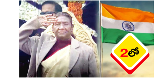
ఢిల్లీ : దేశ రక్షణ సామర్థ్యాన్ని, సాంస్కృతిక వైభవాన్ని చాటుతూ 77వ గణతంత్ర వేడుకలు దేశ రాజధాని దిల్లీలో అంబరాన్నుంటాయి. కర్తవ్యపథ్లో జరిగిన వేడుకల్లో జాతీయ జెండాను ఆవిష్కరించారు రాష్ట్రపతి ద్రౌపది ముర్ము. తొలుత రాష్ట్రపతి భవన్ నుంచి విదేశీ అతిథులతో కలిసి రాష్ట్రపతి ద్రౌపది ముర్ము సంప్రదాయ గుర్రపు బస్లో అశ్విక దళంతో కలిసి కర్తవ్యపథ్ కు బయలుదేరారు. కర్తవ్య పథ్ కు చేరుకున్న రాష్ట్రపతికి, విదేశీ అతిథులు యూరోపియన్ కోస్టల్ అడ్వంతుడు అంటోనియో కోస్టా, యూరోపియన్ కమిషన్ అధ్యక్షురాలు ఉర్సులా వాన్ దెర్ లేయన్ కు ఉపరాష్ట్రపతి, ప్రధాని నరేంద్ర మోదీ, కేంద్ర మంత్రులు స్వాగతం పలికారు. వేదికపైకి చేరుకున్న రాష్ట్రపతి ద్రౌపది ముర్ము జాతీయ జెండాను ఆవిష్కరించి