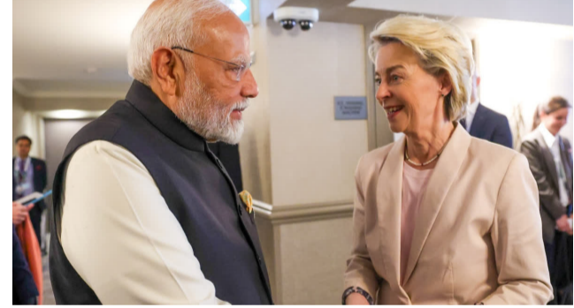
ఢిల్లీ : భారత్ విజయం ప్రపంచాన్ని మరింత స్థిరంగా, సంపన్నంగా, సురక్షితంగా ఉంచుతుందని యూరోపియన్ కమిషన్ అధ్యక్షురాలు ఉర్సులా వాన్ దెర్ లేయన్ వ్యాఖ్యానించారు. దిల్లీలోని కర్తవ్య పథ్లో నిర్వహించిన 77వ గణతంత్ర దినోత్సవ వేడుకల్లో ఉర్సులా వాన్ దెర్ లేయన్తో పాటు యూరోపియన్ కోస్టా కూడా ముఖ్య అతిథిగా పాల్గొన్నారు. ఈ సందర్భంగా వేడుకల్లో పాల్గొనడం తన జీవితంలో గౌరవకరమైన క్షణమని ఉర్సులా తెలిపారు. మిగతా..2లో

కలిసికట్టుగా పనిచేస్తే దేశంలోనే ఆదర్శ నియోజకవర్గంగా మంగళగిరి