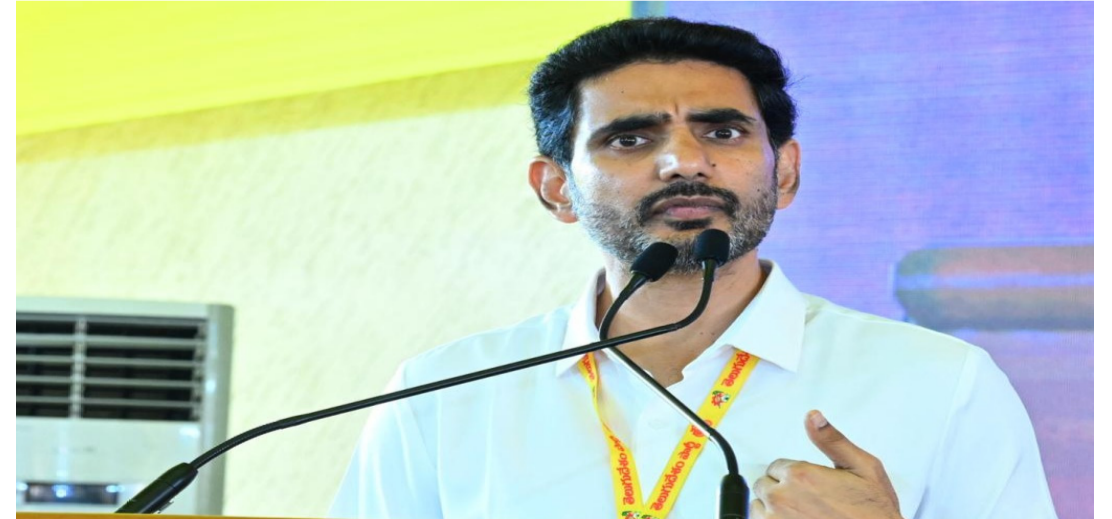
గ్రామ పార్టీ అధ్యక్షుడు పాలిట్ బ్యూరో వరకు ఎదగాలి