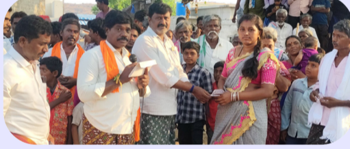
మహిళలందరూ ఎంతో ఉత్సాహంతో తమ ముగ్గులను అలంకరించి పోటీని మరింత అందంగా తీర్చిదిద్దారు. ఈ పోటీలో మొదటి