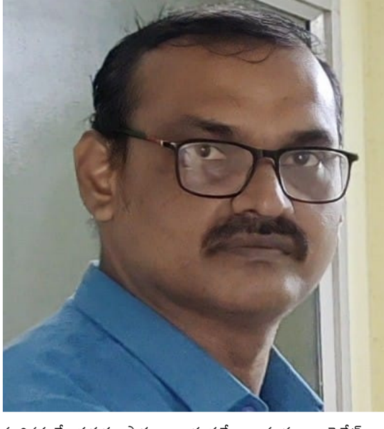
మారినప్పుడే ప్రభుత్వ పాఠశాల రూపురేఖలు మారతాయి. ప్రైవేట్

మార్చి 23 (ఆకాంక్ష) : విద్య అనేది ఒక సమాజ భవిష్యత్తును నిర్ణయించే పునాది. తెలంగాణ రాష్ట్రంలో ఇటీవల విద్యా వ్యవస్థపై జరుగుతున్న చర్చ, ముఖ్యంగా ప్రభుత్వ వర్సెస్ ప్రైవేట్ పాఠశాలల అంశం, ఒక ఆలోచనీయ ప్రజాస్వామ్యానికి సంకేతం. ముఖ్యమంత్రి రేవంత్ రెడ్డి గారు "పిల్లలను ప్రభుత్వ పాఠశాలలే పంపాలి" అని పిలుపునిచ్చడం వెనుక ప్రభుత్వ విద్యపై భరోసా కల్పించాలనే ఆకాంక్ష కనిపిస్తోంది. అయితే, ఈ ఆకాంక్ష వాస్తవరూపం దాల్చాలంటే భావోద్వేగాల కంటే వ్యవస్థాత్మక మార్పులే కీలకం. ప్రభుత్వ పాఠశాలల్లో అత్యంత ప్రతిభాపంతులైన, కఠినమైన పోటీ పరీక్షల ద్వారా ఎంపికైన అనుభవజ్ఞులైన ఉపాధ్యాయులు ఉన్నారు. ఇది ప్రభుత్వ వ్యవస్థకు ఉన్న అతిపెద్ద బలం. అయినప్పటికీ, కింది కారణాల వల్ల తల్లిదండ్రులు ప్రైవేట్ బాట పడుతున్నారు. మౌలిక సదుపాయాల కొరత: సరిపడా గదులు, స్వచ్ఛమైన తాగునీరు, మరుగుదొడ్లు మరలయి ఆట స్థలాల లేమి, వర్షవేళ్లలో పం: బోధన నాణ్యతపై నిరంతర పర్యవేక్షణ లేకపోవడం. ఆంగ్ల మాధ్యమం: మారుతున్న కాలానికి అనుగుణంగా ఆంగ్ల బోధనలో ఇంకా పూర్తిస్థాయి పట్టు సాధించకపోవడం. తెలంగాణ ముఖ్యమంత్రి రేవంత్ రెడ్డి గారు అన్నట్లుగా, విద్యా వ్యవస్థపై సమృద్ధం కలగాలంటే అది పై స్థాయి నుండి మొదలవాలి. ప్రభుత్వ ఉద్యోగులు, ప్రజా ప్రతినిధులు తమ పిల్లలను ప్రభుత్వ పాఠశాలల్లో చేర్పించినప్పుడే సామాన్య ప్రజల్లో ఆ వ్యవస్థపై ధీమా కుదుగుతారు. ఇది కేవలం ఒక నియమంలా కాకుండా, ఒక నైతిక బాధ్యతగా