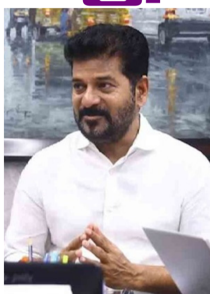
ప్రభుత్వ సంస్థలతో మాట్లాడి భూసేకరణ చేస్తున్నామని పేర్కొన్నారు. విగత..2లో

హైదరాబాద్ నగరాన్ని అద్భుత నగరంగా తీర్చిదిద్దడామని ముఖ్యమంత్రి రేవంత్ రెడ్డి ప్రకటించారు. శాసనసభలో ఆభివృద్ధిపై జరిగిన చర్చలో పాల్గొన్న ఆయన, భవిష్యత్ అవసరాల దృష్ట్యా నగరాన్ని మూడు ప్రత్యేక జోన్లుగా విభజిస్తున్నట్లు వెల్లడించారు. క్యూర్, ప్యూర్, రేర్ విభాగాలుగా ఈ ప్రణాళిక సాగనుంది. నగరంలోని కాలుష్యాన్ని తగ్గించేందుకు ఓఆర్ఆర్ లోపల ఉన్న పరిశ్రమలన్నింటినీ వెలుపలికి తరలిస్తామని ఆయన స్పష్టం చేశారు. ట్రాఫిక్ రద్దీని తగ్గించడమే లక్ష్యంగా అందర్పానీలు, సర్వేస్ రోడ్లు మరియు భారీ ఎలివేటర్ కారిడార్ నిర్మాణానికి శ్రీకారం చుట్టబోతున్నట్లు సీఎం తెలిపారు. ముఖ్యంగా శామీర్ పేట, మేన్టల్ వైపు వెళ్లే ప్రయాణికుల కోసం ప్రత్యేక కారిడార్ నిర్మిస్తామని, దీని కోసం కేంద్ర