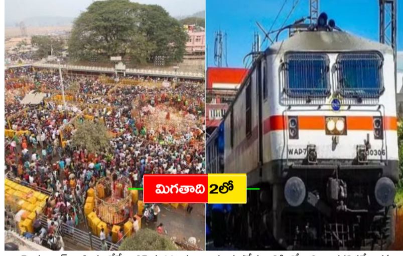
హైదరాబాద్: ఆసియాలోనే అతిపెద్ద గిరిజన పండుగగా ప్రసిద్ధి చెందిన మేడారం సమృక్త-సారలమ్మ మహాజాతర తేదీలు సమీపించాయి. ఈ నెల 28న ప్రారంభం కానున్న ఈ మహోత్సవానికి కోట్లాదిగా తరలివచ్చే భక్తుల సౌకర్యార్థం తెలంగాణ ప్రభుత్వం విస్తృత ఏర్పాట్లు చేసింది. ముఖ్యంగా దక్షిణ మధ్య రైల్వే తెలంగాణ రాష్ట్ర లోడ్డు రవాణా సంస్థ సమన్వయంతో