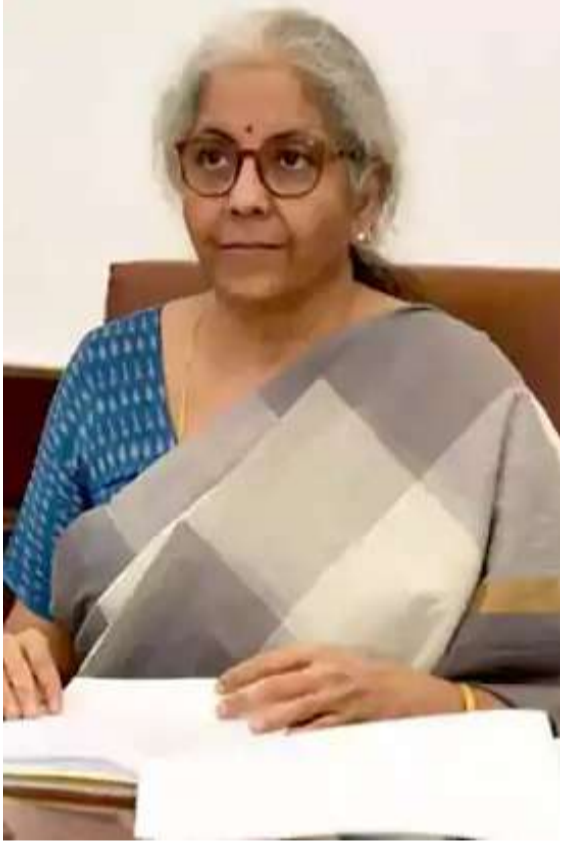
పేజి 2లో ▶

ఫిబ్రవరి 1న ప్రవేశపెట్టబోయే కేంద్ర బడ్జెట్ కు సంబంధించిన పనులు తుది దశకు చేరుకున్నాయి. ఇందులో భాగంగా ఏటా నిర్వహించే హల్వా వేడుక ను నార్త్ బ్లాక్ లో (ఆర్థిక శాఖ కార్యాలయం) మంగళవారం సాయంత్రం నిర్వహించారు. ఈ వేడుకలో కేంద్ర ఆర్థిక మంత్రి నిర్మలా సీతారామన్, సహాయ మంత్రి పంకజ్ చౌదరి పాల్గొన్నారు. అలాగే ఆర్థిక శాఖ పరిధిలోని అన్ని విభాగాల కార్యదర్శులు, బడ్జెట్ రూపకల్పనలో భాగమైన అధికారులు కూడా హాజరయ్యారు. అనంతరం ఆమె బడ్జెట్ ప్రెసెస్ ను పరిశీలించారు. ఫ్రీటింగ్, ఇతర ఏర్పాట్లను పర్యవేక్షించారు. నిర్మలా సీతారామన్ బడ్జెట్ ప్రవేశపెట్టడం ఇది వరకుగా తొమ్మిదోసారి. ఒక వైపు అంతర్జాతీయ భౌగోళిక రాజకీయ అనిశ్చితులు, మరోవైపు మన దేశం 7.4% వృద్ధి సాధిస్తున్న తరుణంలో ఈ బడ్జెట్ వెలువడనుంది. లాక్-ఇన్ లో అధికారులు.. హల్వా వేడుకతో బడ్జెట్ లాక్-ఇన్ పీరియడ్ ప్రారంభం అవుతుంది.