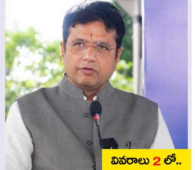
వివరాలు 2 లో..