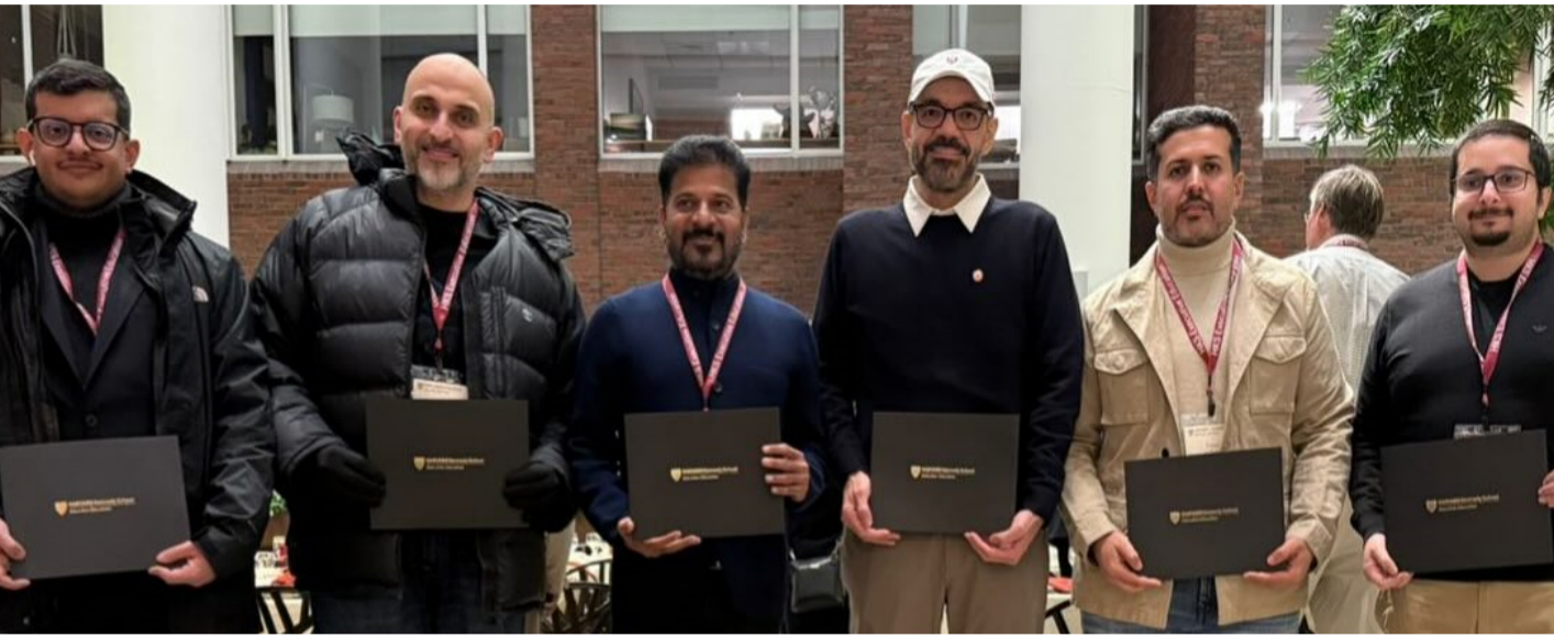
వారం రోజుల సర్టిఫికేట్ కోర్సు పూర్తి

హైదరాబాద్, జనవరి 30 (ఆర్ఎన్ఎ): తెలంగాణ ముఖ్యమంత్రి రేవంత్ రెడ్డి ఆమెరికాలో ప్రతిష్టాత్మక హార్వర్డ్ యూనివర్సిటీలోని కెన్సెడీ స్కూల్ ఆఫ్ గవర్నమెంట్లో ఎగ్జిక్యూటివ్ ఎడ్యుకేషన్ ప్రోగ్రామ్ను విజయవంతంగా పూర్తి చేశారు. లీడర్ షిప్ అనే కోర్సును పూర్తిచేసి సంబంధిత డ్రువీకరణ పత్రాన్ని పొందారు. జనవరి 25న ఈ కోర్సు ప్రారంభమవగా జనవరి 30 వరకు అంటే వారం రోజుల పాటు నిర్వహించారు. ఈ కోర్సులో సిఎం రేవంత్తో పాటు 62 మంది కో-ఛోర్స్ విద్యార్థులు కూడా పాల్గొన్నారు. దాదాపు 20కి పైగా దేశాల నుంచి ప్రతినిధులు ఇందులో భాగస్వాములయ్యారు. ఆమెరికాలోని