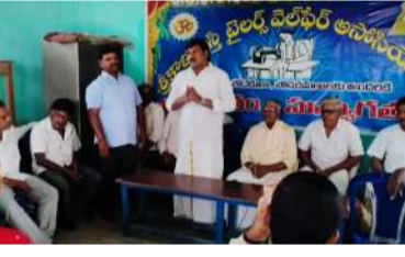
అసోసియేషన్ చొరవ చూపుతుందని తెలిపారు. ఈ ప్రయోజనాలను పూర్తిస్థాయిలో పొందాలంటే ప్రతి సభ్యులు సంఘటితంగా ఉండాలని సూచించారు. ట్రైలర్స్ డే కార్యక్రమాన్ని

ఘనంగా నిర్వహించేందుకు సభ్యుల సూచనలు తీసుకున్నట్లు తెలిపారు. ఈ కార్యక్రమానికి శ్రీకాళహస్తి ఎమ్మెల్యే బొజ్జల సుధీర్ రెడ్డిని ముఖ్య అతిథిగా ఆహ్వానించి, ట్రైలర్స్ ఎదుర్కొంటున్న సమస్యలను ఆయన దృష్టికి నిర్ణయించినట్లు వెల్లడించారు. ప్రభుత్వం అందిస్తున్న లేబర్ గుర్తింపు కార్డులు, హెల్త్ సీమ్ల ద్వారా అనారోగ్య కారణాలతో ఇబ్బందులు పడుతున్న ట్రైలర్స్ కు మరింత మద్దతు లభించేలా