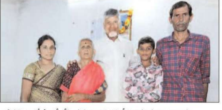
అభివృద్ధి అండ్ ఏంట్ చేసి చూపించాం" అని సీఎం చంద్రబాబు అన్నారు.