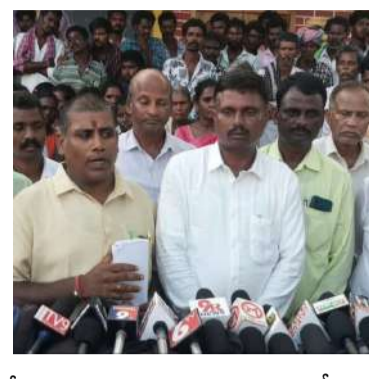
చేయడం ద్వారా రాజకీయ వాతావరణాన్ని దిగజార్చే ప్రయత్నం చేస్తున్నారని విమర్శించారు. ఇకపై

ముఖ్యంగా ముఖ్యమంత్రి చంద్రబాబు నాయుడు, మంత్రి నారా లోకేష్ లపై వ్యక్తిగత ఆరోపణలు చేయడం తీవ్రంగా ఖండనీయమని సుబ్బయ్య పేర్కొన్నారు. రాజకీయ విమర్శలు విధానాలపై ఉండాలి గానీ, వ్యక్తిగత దూషణలకు దిగడం ప్రజాస్వామ్య రాజకీయాలకు తగదన్నారు. తమ గతాన్ని పక్కన పెట్టి ఇతరులపై నైతికత, సంస్కృతి గురించి మాట్లాడడం సరికాదని ఆయన వ్యాఖ్యానించారు. ఆధారాలు లేకుండా ఆరోపణలు