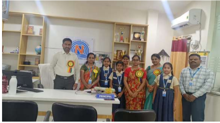
శ్రీకాళహస్తి, గాయత్రి వార్తలు, ఫిబ్రవరి 27