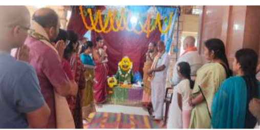
గోవును పవిత్రంగా అలంకరించి వేదమంత్రాలతో పూజలు చేశారు. తదుపరి దేవస్థానం చుట్టూ ప్రదక్షణలు నిర్వహించి స్వామివారికి మహా నైవేద్యం సమర్పించి భక్తులకు తీర్థ ప్రసాదాలు అందజేశారు అనంతరం అన్న ప్రసాద వితరణ కార్యక్రమం నిర్వహించారు ఈ కార్యక్రమంలో ఆలయ సిబ్బంది, ఆలయ అర్చకులు, భక్తులు తదితరులు పాల్గొన్నారు.