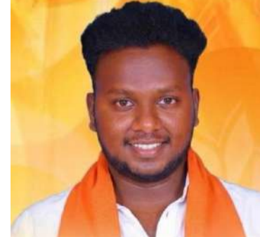
సాగుతోందని, అదే స్ఫూర్తితో పార్టీ బలోపేతానికి కృషి చేస్తామని తెలిపారు. యువమోర్చా ద్వారా యువతలో జాతీయ భావన పెంపొందించి, ప్రభుత్వ సంక్షేమ పథకాలను గ్రామ స్థాయిలో ప్రజలకు చేరవేసేందుకు తమ పంతు పాత్ర పోషిస్తామని చెప్పారు. జిల్లాలో బీజేపీ పార్టీ మరింత బలపడేలా కృషి