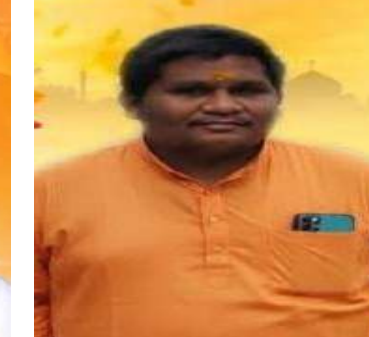
చేస్తూ, బీజేపీ నాయకత్వం తమపై ఉంచిన నమ్మకాన్ని నిలబెట్టుకునేందుకు కట్టుబడి పనిచేస్తామని నూతన కమిటీ సభ్యులు తెలిపారు. ఈ నిమిత్తాలను పలువురు బీజేపీ నాయకులు స్వాగతించి వారికి ఆభినందనలు తెలిపారు